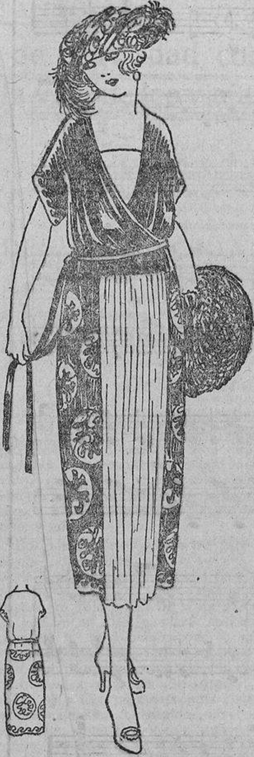
El tipo de vestido de silueta recta de la presente estación está representado por este modelo de «Crêpe satin» negro bordado con medallones y greca de seda gris mezclada con hilo de plata; delantero gris, fruncido.

La moda es elemento, y crea para todos los tipos y para todos los gustos; el acierto nues-