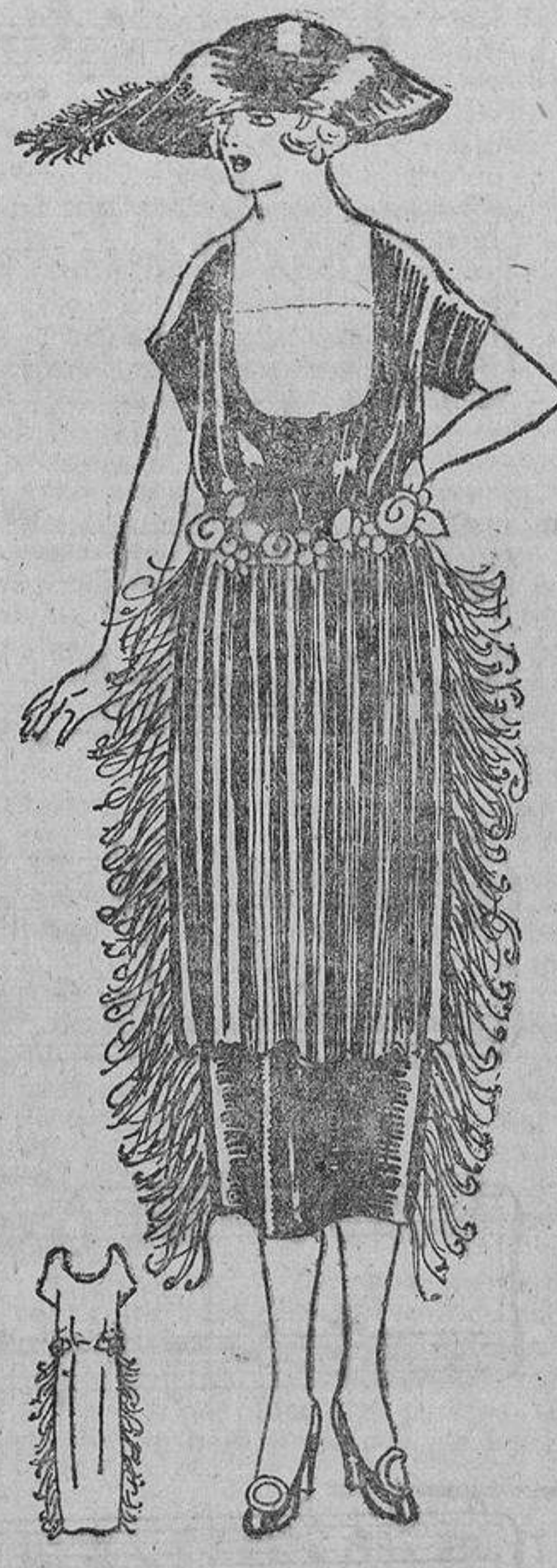
Es lástima que el dibujo no pueda dar una idea exacta de lo maravilloso que resulta este vestido de seda negro, con su guirnalda de flores verde y púrpura en la cintura, su delantal fruncido y sobretodo con el fleco de plumas que vaporosamente cae a los lados.

tro está en saber elegir, después de mirarnos la faja y fríamente, en el espejo.