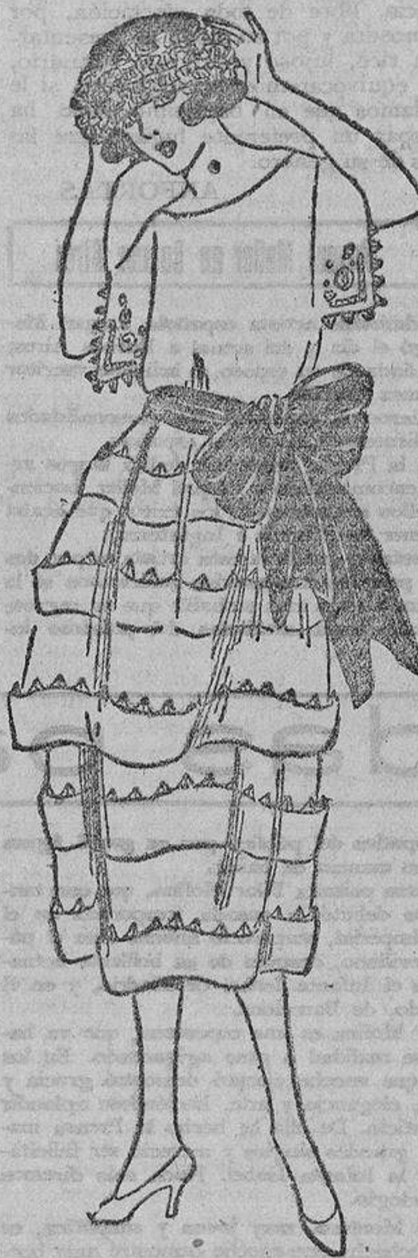
Muy juvenil este organdi blanco, o tafetán con tiras colocadas hacia arriba, rematadas con piquitos de cinta o tafetán, y una gran banda color tomate.

conduce a crear modas ridículas y feas. Cuando, por el contrario, son artistas consiguen, después de tentativas más o menos felices, llegar a la creación de modelos que son coronados por franco éxito. Estos son los que se destacan de la vulgaridad y del batiburrillo de la masa y producen en el observador una agradable impresión artística. Así, una reunión de verdaderas elegantes es siempre un espectáculo de lujo acertado, de arte.