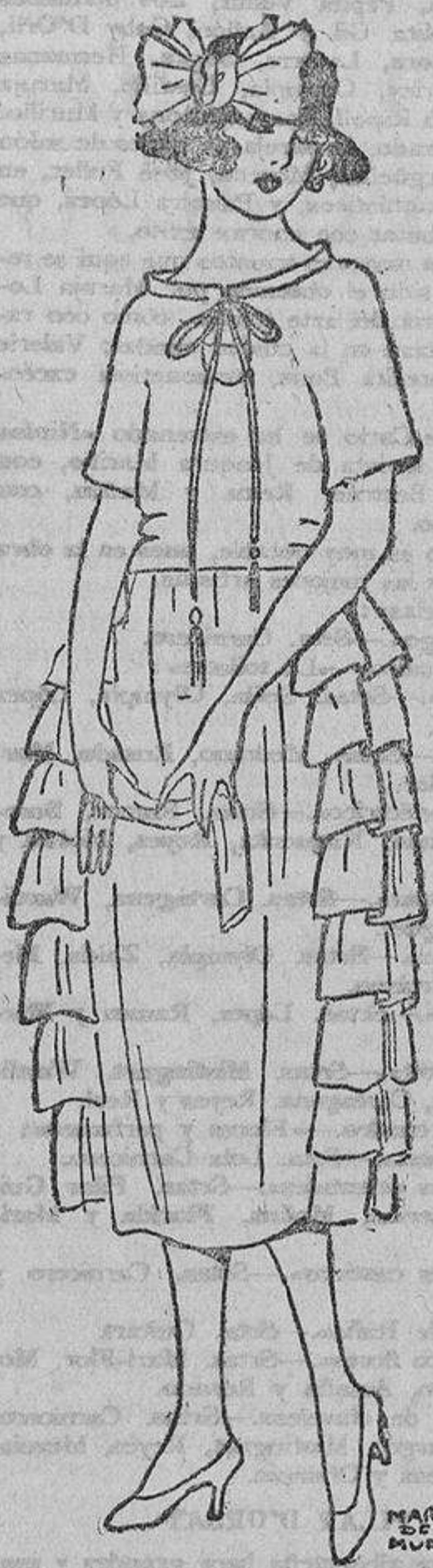
Sugestivo en extremo, este vestido de tafetán «petalo de rosa» con sus volantes a los lados y su cordón de plata cerrando el original cuello.

Pero las modistas y las sombrereras no lo desean así. Unas y otras ambicionan únicamente producir algo que transforme completamente lo llevado la temporada anterior. Cuando las modistas carecen de gusto, este esfuerzo de querer cambiar las