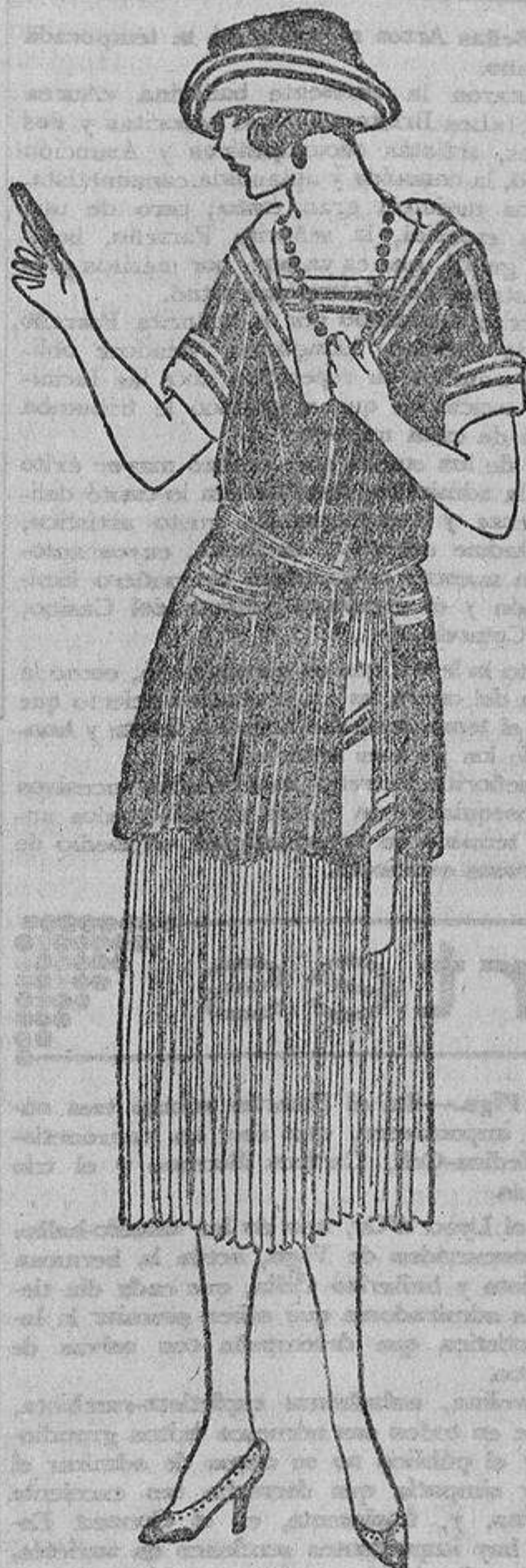
Una fantasía sobre el traje marineró: falda plisada blanca, gran blusa marino con cuello, carteras, etcétera, de punto de lana blanco y trenillas azules.