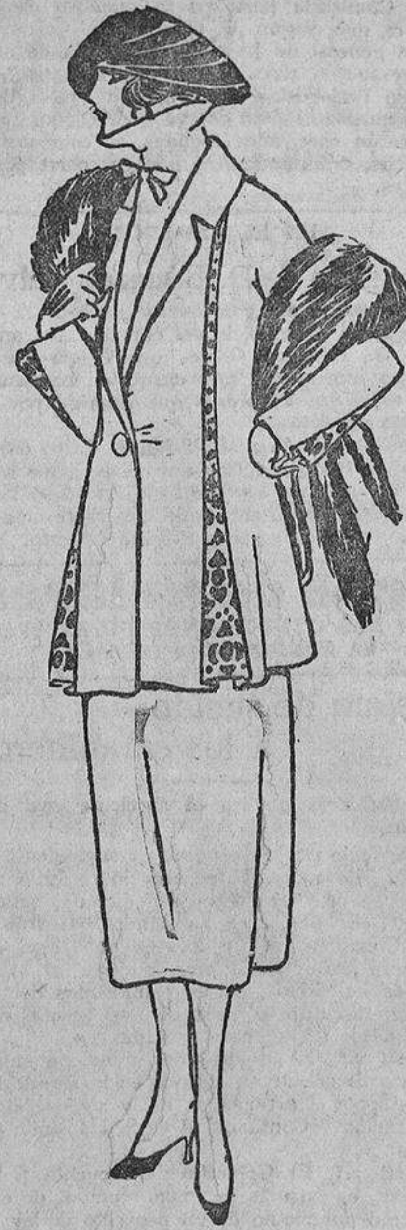
Para feminizar un traje sastre basta dejarle hacia adentro o hacia fuera unos «fuelles» bordados.

Hasta los diez y doce años, mientras conservan una silueta muy anifiada, pueden vestirse las niñas con algo de originalidad; desde esa edad hay que vestir las con más sencillez.