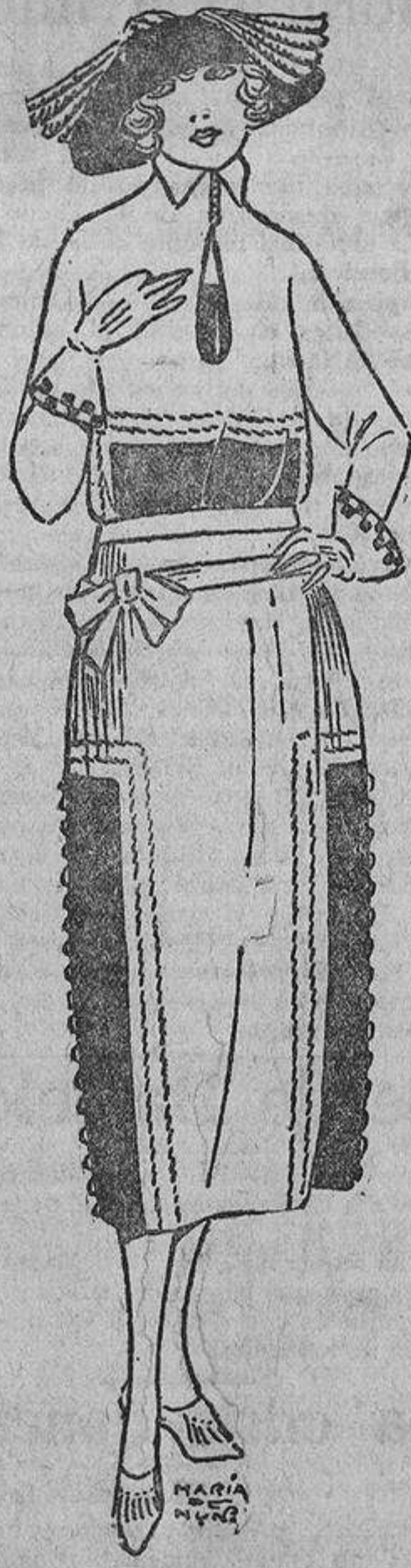
Una persona profana diría que este vestido está hecho a «patachos», y sin embargo, qué originales resultan esas incrustaciones de paño rojo oscuro, como los pespantes sobre el fondo azul marino.