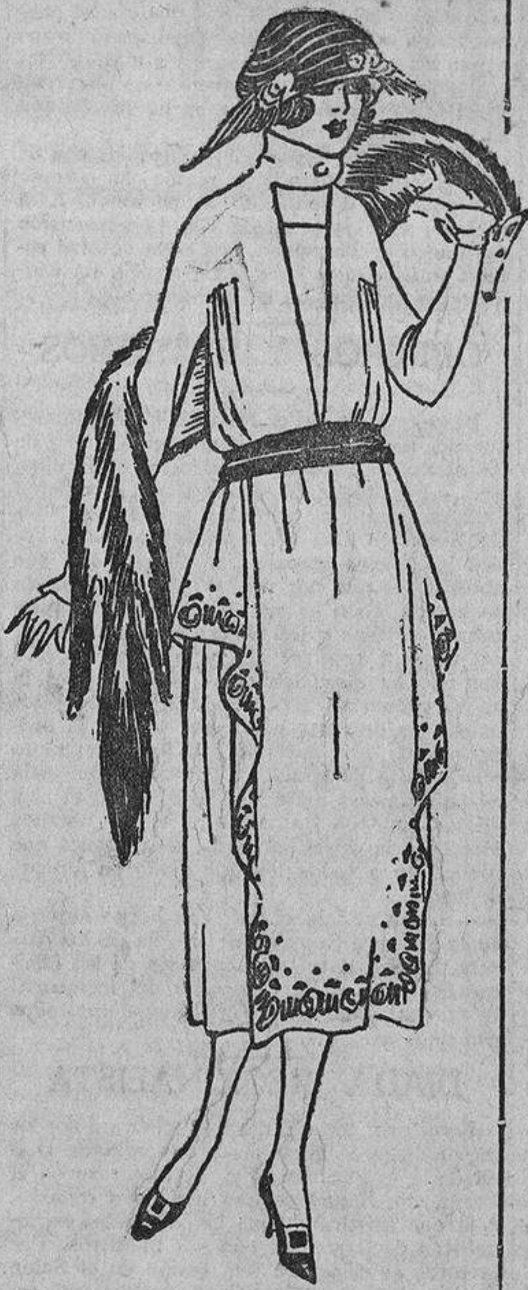
Puede copiarse este modelo de tarde, en una seda muy flexible o en terciopelo. El modelo era gris, bordado con cuentas de acero.

Cuando los niños son de corta edad resulta gracioso vestirlos con colores vivos; por muy chillón que sea el color resulta bien, siempre que no se mezcle sin ton ni son con otros colores también muy vivos.