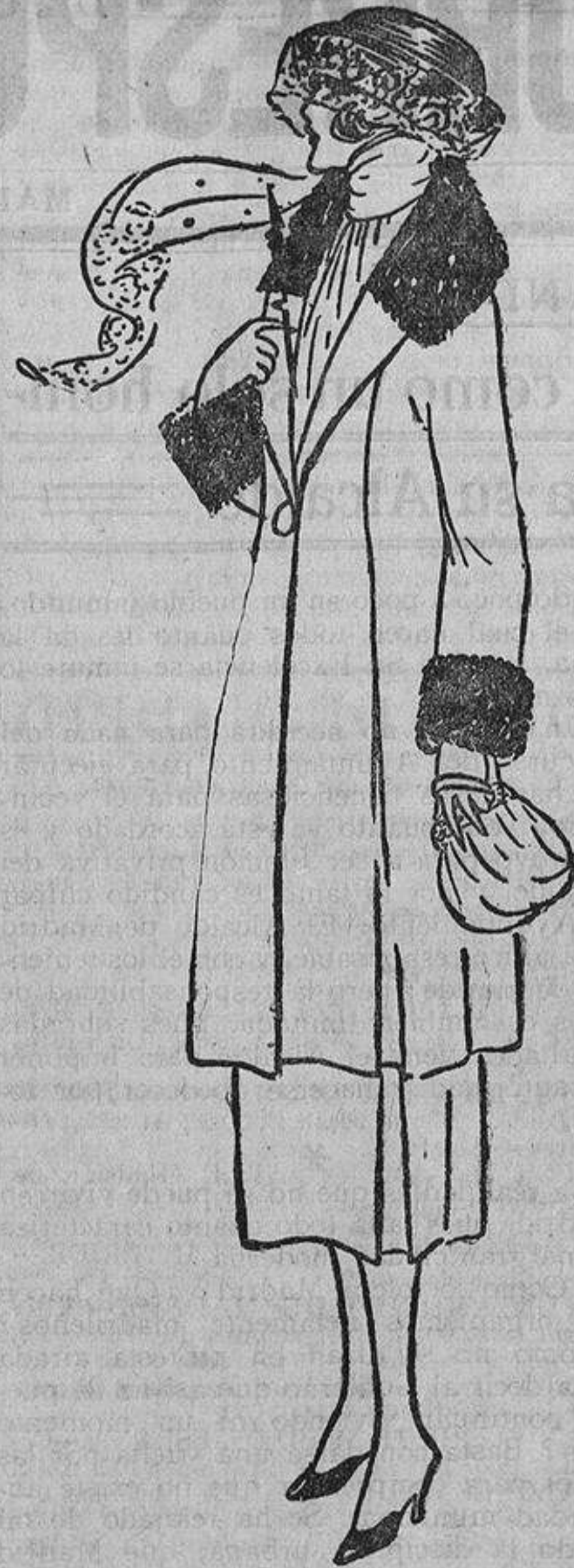
Sencillo y propio para el trote callejero, este traje sastrero, con sus dos pinzas delante y dos detrás, que se abren en el bajo formando un pliegue metido.

que acoger una declaración, aunque sea la décima vez que la han oído, cómo, más tarde, deben abandonar su mano, tras un mazo de flores, para que él la bese... Bien es verdad que no aprenden a dar su corazón, esto no se les puede enseñar; pero aprenden a hacerlo con gracia, con ese poquito de coquetería que tanto gusta a los hombres.