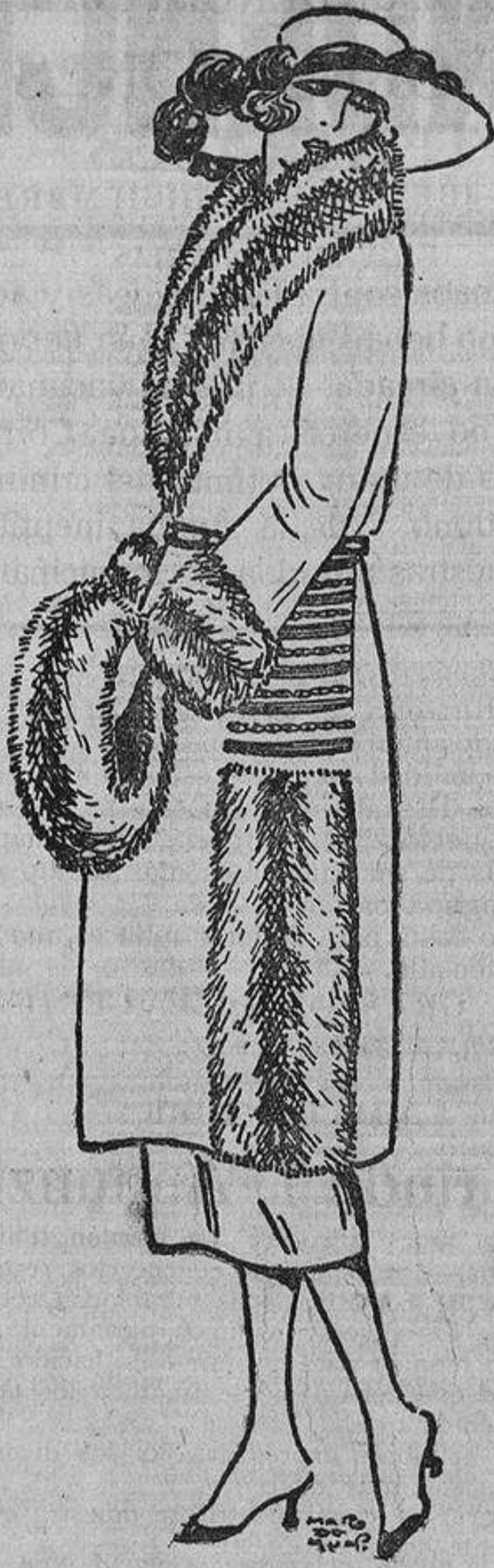
Imaginaos el «chic» de este traje de duvetón de lana azul marino o gris, adornado con piel de «opossum» y bordados grises.