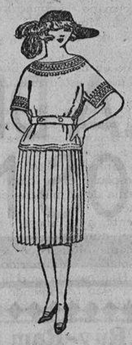
Trajes de gabardina, lanilla, sarga inglesa, etc., adornos bordados. De ptas. 100 a 130.