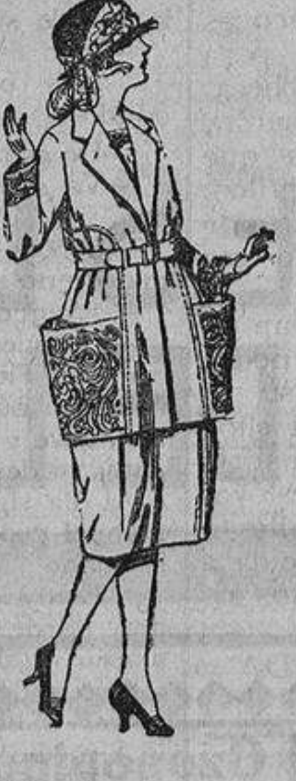
Vestidos de sarga inglesa, estambre, etc., en azul y color, adornos bordados. De ptas. 65 a 90.