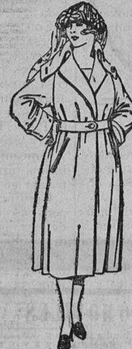
Abrigos de gabardina inglesa, impermeabilizada. De ptas. 110 a 200.

ROPAS CONFECCIONADAS PARA CABALLERO, SEÑORA Y NIÑOS