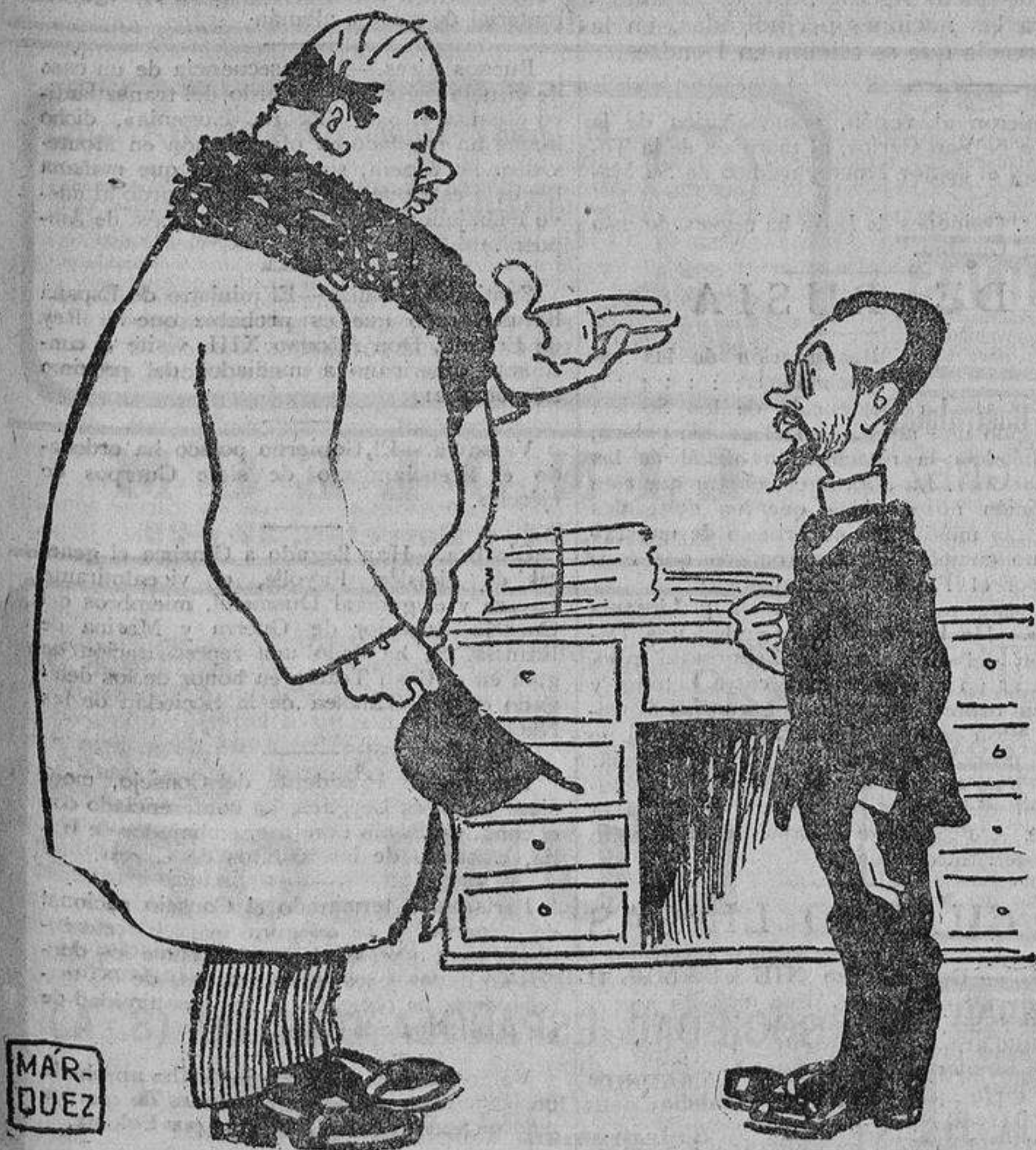
—¿El oficial mayor de este departamento? —Servidor de usted.