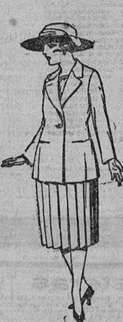
Trajes de lanilla, sarga, etcétera, en azul y color. De ptas. 90 a 120.