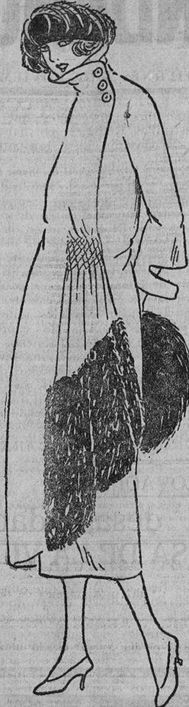
Un cuerpo esbelto puede permitirse el «lajado» en un vestido de duvetina cruzado a un lado y con frances «rido de abeja» y piel.