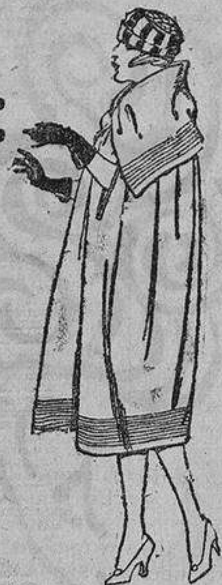
Capas de gabardina inglesa, diferentes colores, pespunte de adorno. De ptas. 130 a 160.