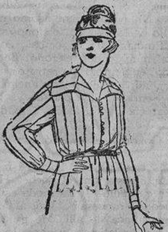
Blusas de franela listada. De ptas. 9 a 15.