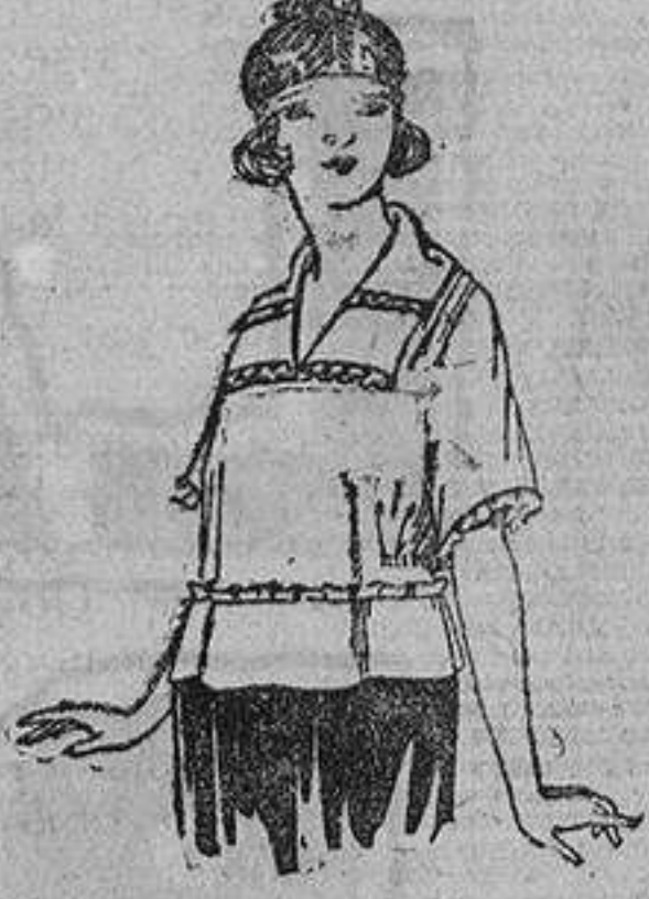
Blusas de crepón de seda, granadina, charmeuse, etc. De ptas. 45 a 70.