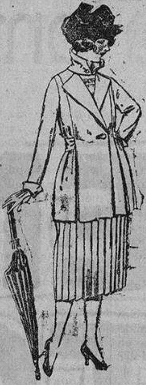
Trajes de gabardina, lanilla, estambre, etc., en negro, azul y color. De ptas. 130 a 165.

Barcelona, Alicante, Almería, Bilbao, Cádiz, Cartagena, Gijón, Granada, Málaga, Palma de Mallorca, Santander, Sevilla, Valencia, Valladolid y Zaragoza