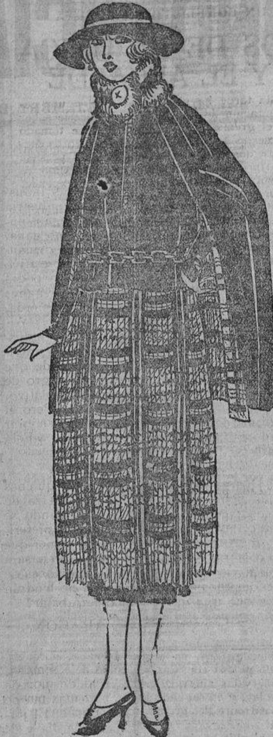
«Escocés» llaman a este modelo, compuesto, por una falda escocesa plisada muy oscura, sobre un traje azul marino y una capa forrada con tejido escocés.