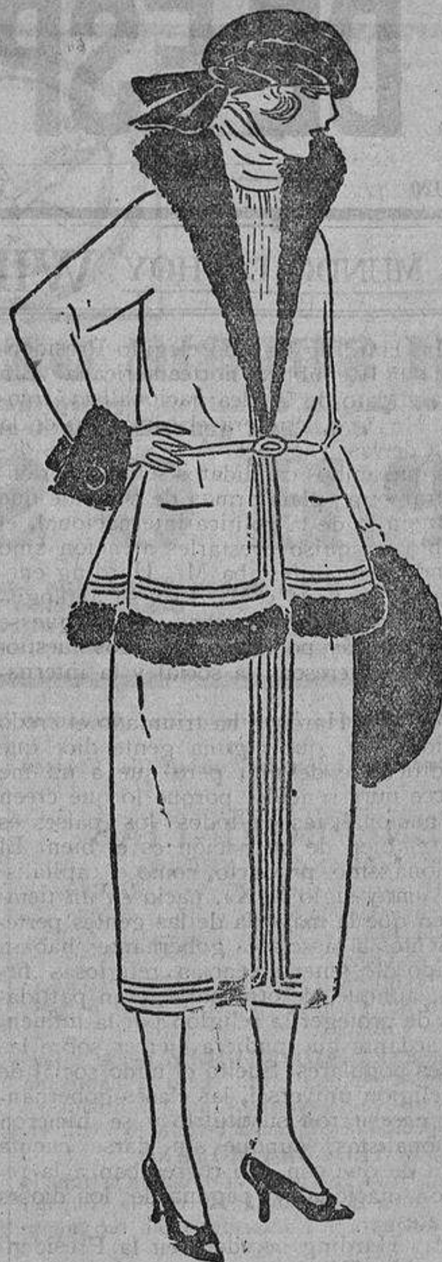
La piel de nutria y las tiras de charol negro son de un efecto muy bonito sobre el tejido de duvetina verde oscuro.

Los abrigos de piel están de moda... entre las potentadas; se llevan en piel de topo, nutria, y el más de moda el de caracul afeitado. Las que no pueden o no quieren gastar estos dinerales pueden hacerlo en buen «peluche»; pero no liso, como se llevaba antes, sino con estampados imitando la piel trabajada o el caracul recortado. Algunas capas sólo llevan de piel el gran canesú, que baja hasta debajo de los hombros y el talle, unidos a