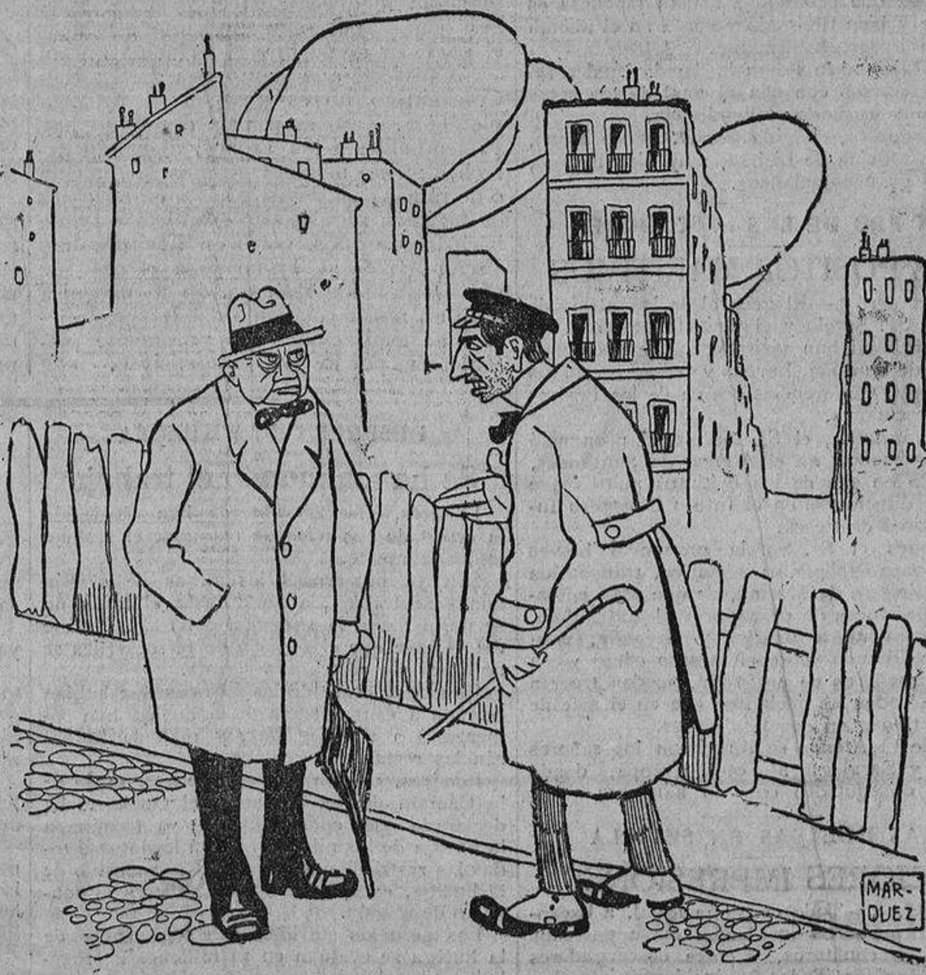
—¿Y este año dónde has hecho los "Tenorios,?" —En la calle de Sevilla.