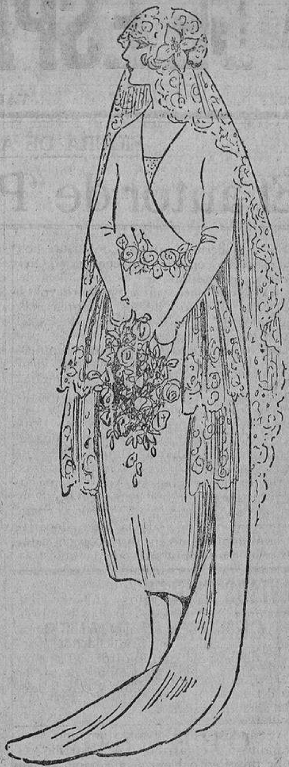
No creáis, lectoras, al ver dos novias, que se trata de una boda «futurista» en la cual, como predicó alguno, hay dos mujeres para un hombre, no son dos hermanas que se casaron el mismo día.

En su meditación considera lo que sería de él y de ella una vez fundado el hogar, en el cual sólo él aportaría su sueldo como recurso monetario. ¡Qué envanecido mediocridad! Un pisito de reducidas proporciones por el cual deben pagar una