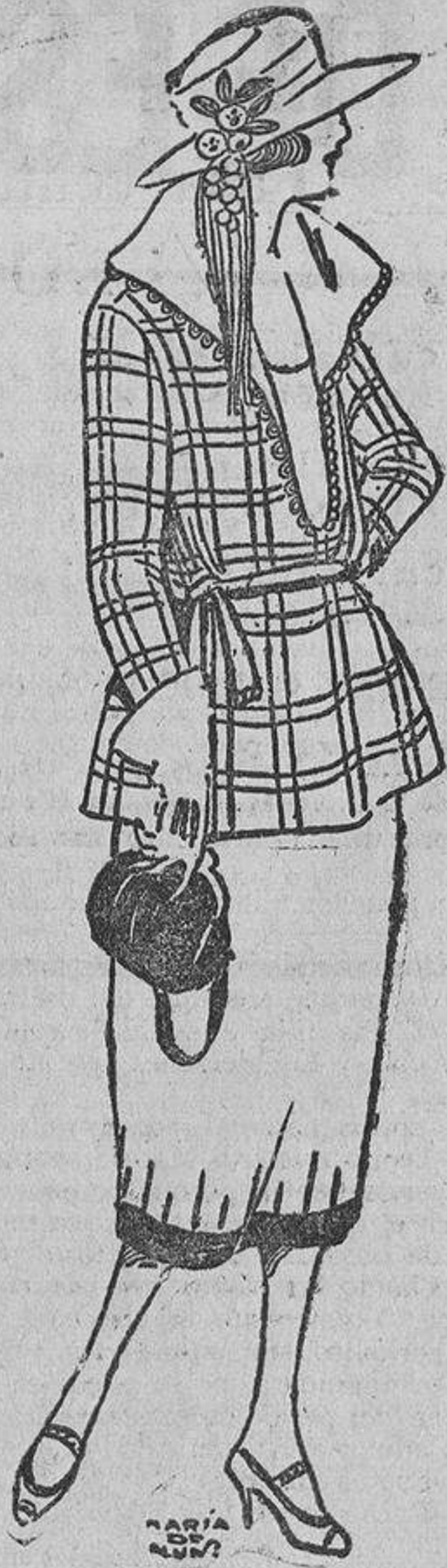
Me gustaría este modelo con falda de sarga blanca y chaqueta azul marino con rayas, formando cuadros, en blanco.

Según nos cuenta «París», la moda exige ahora los encajes crudos, y todos los blancos se meten en un baño de té para darles ese preciado tono que a los antiguos da la pátina del tiempo.