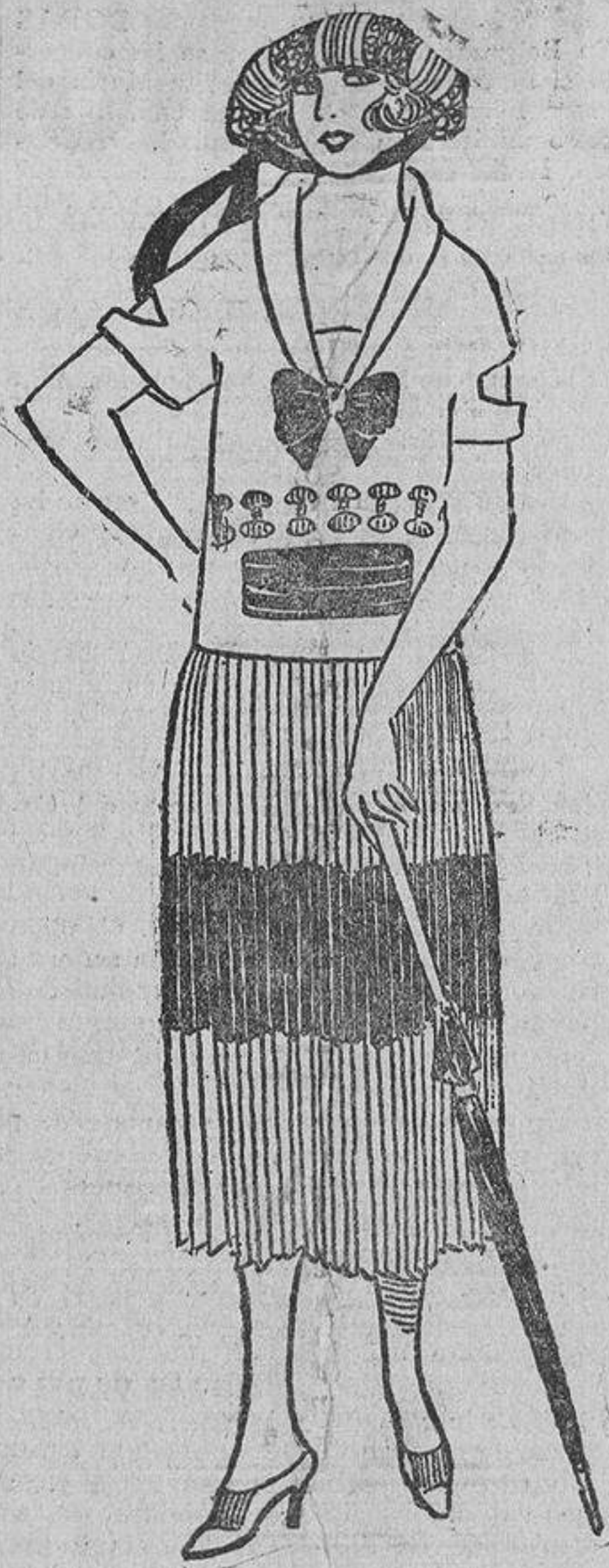
Este otro, en «tussor» crudo y «tussor» rojo; la chaquetilla, abierta delante, dejando aperibir una banda roja. Falda plisada.