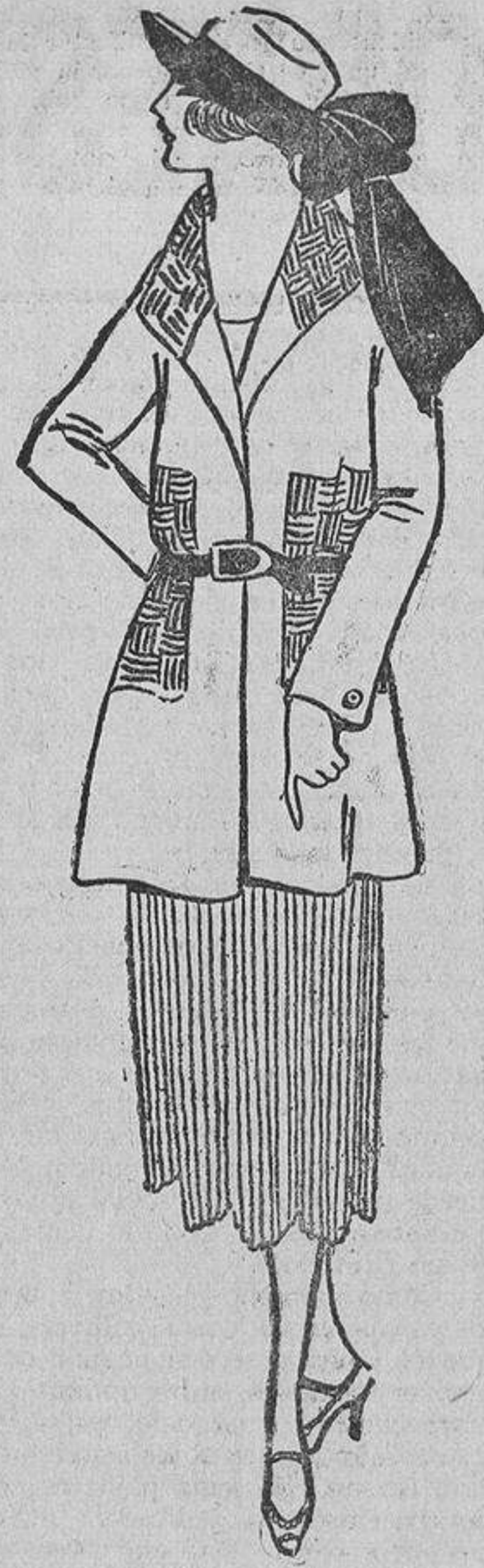
Y, finalmente, este de sarga «beige» con falda plisada formando ondas en el bajo, y bordados marino en la chaqueta.

Sobre los vestidos de verano continuará con más furor la boga, iniciada el verano pasado, de los encajes teñidos en el mismo tono del vestido. En primer lugar figura el «chantilly», siempre regio, y sus imitaciones. Sería demasiado exigir que todas las mujeres lo llevaran verdadero. Después vienen las blondas españolas; pero las de dibujo claro, separado, y finalmente el tul bordado. Estos vestidos tienen la ventaja de ser muy elegantes y femeninos.