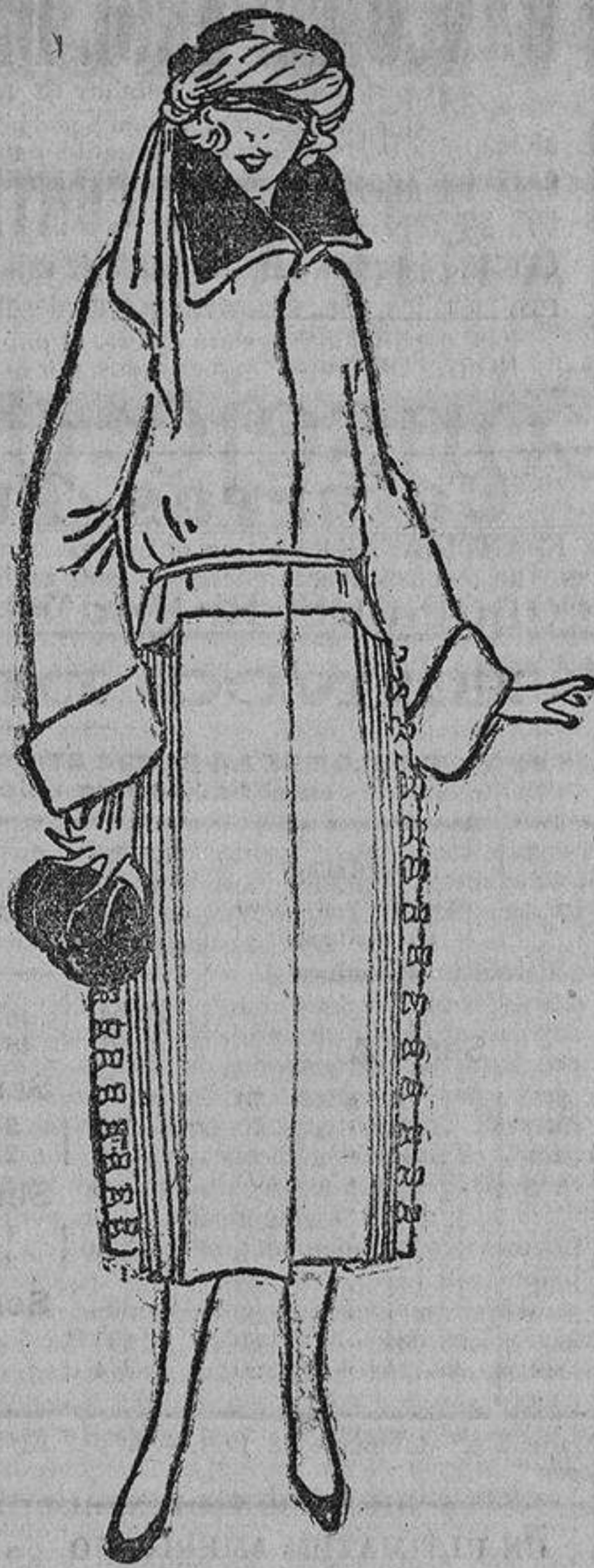
Abriego de entretiempo. Paño fino color mostaza con «plissé» a los lados y unos lactos del mismo paño en la tabla que está en el centro del «plissé».