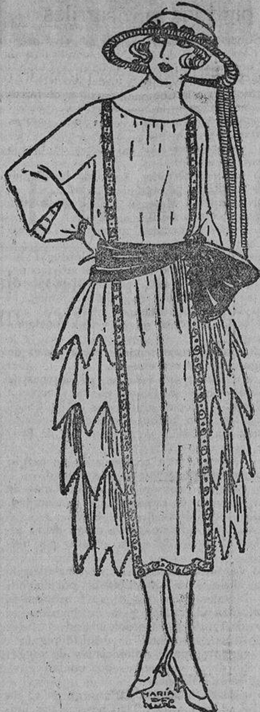
A fin de que las lectoras de «LA CORRES» sean las primeras en conocer la moda para este verano, he aquí un lindo modelo de creación de China rosa, con banda azul porcelana y entredós, formando delantal, bordado con cuentas azules.