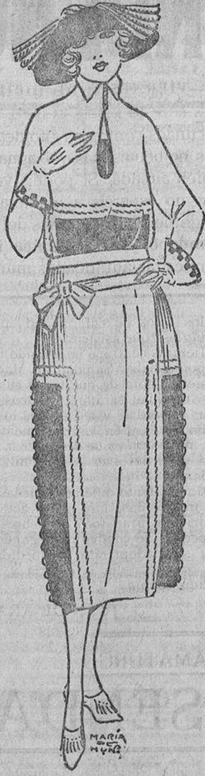
Una persona profana diría que este vestido está hecho a «petachos», y sin embargo, qué originales resultan esas incrustaciones de paño rojo oscuro, como los pespunte sobre el fondo azul marino.