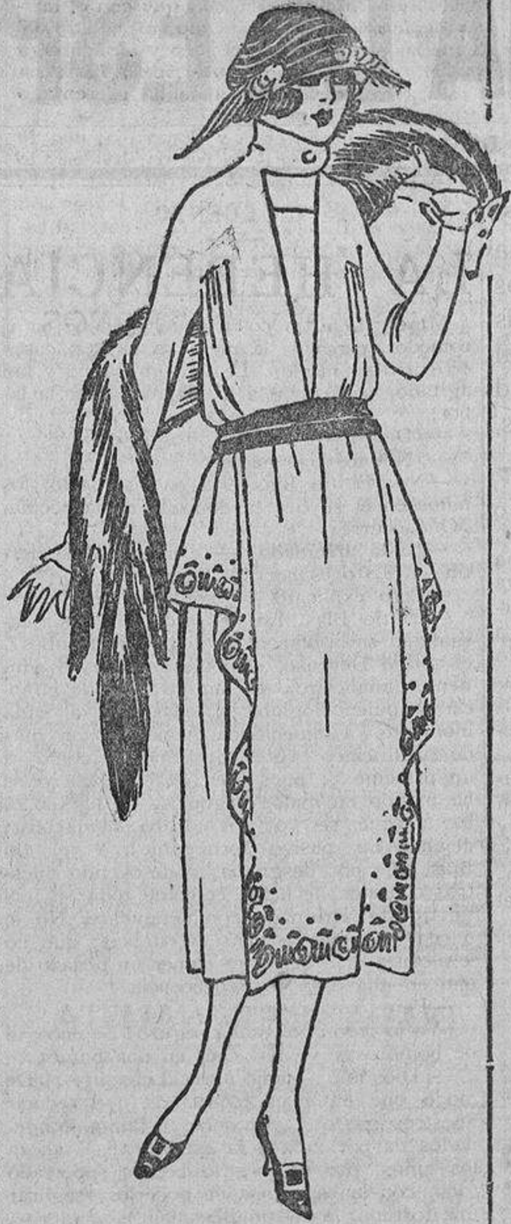
Puede copiarse este modelo de tarde, en una seda muy flexible o en terciopelo. El modelo era gris, bordado con cuentas de acero.

Cuando los niños son de corta edad resulta gracioso vestirlos con colores vivos; por muy chillón que sea el color resulta bien, siempre que no se mezcle sin ton ni son con otros colores también muy vivos. El otro día vi una nena de unos cinco años muy confortablemente vestida con un traje de punto, todo de amarillo, de pies a cabeza, empezando por el gorro, guantes, abrigo y terminando por las polainas; Todas las personas se fijaban en ella, aun las más indiferentes. El efecto era de un patito o un pollito recién salido del cascarón.