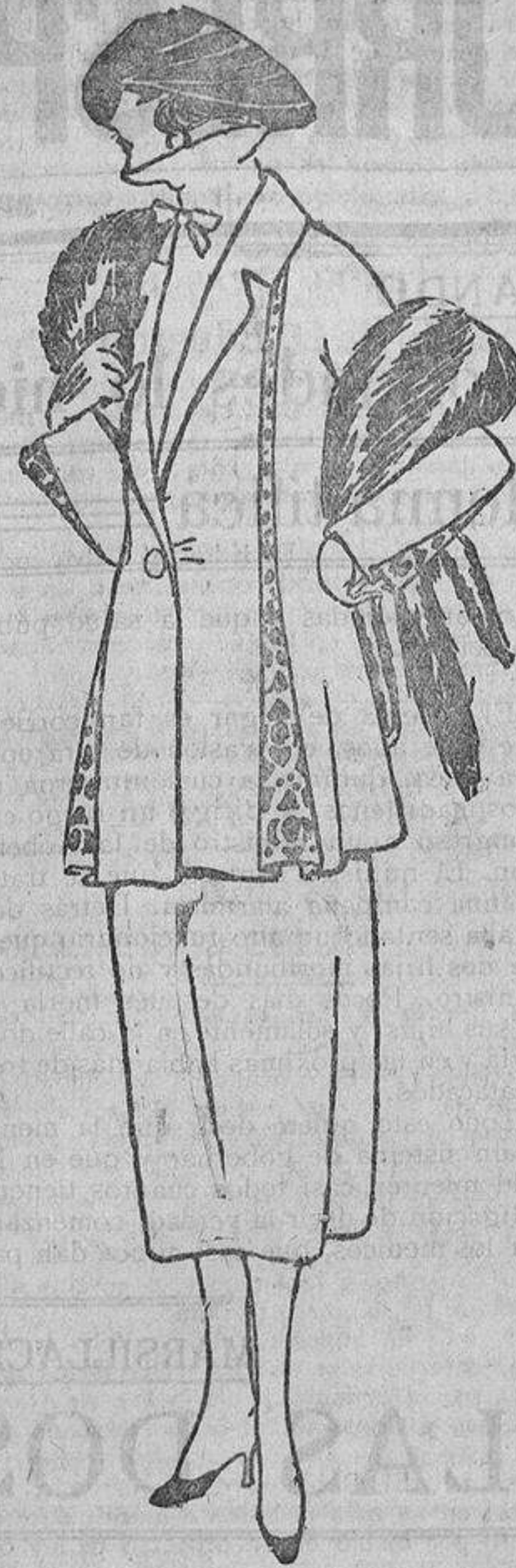
Para feminizar un traje sastré basta dejarle hacia adentro o hacia fuera unos «fuelles» bordados.

Hasta los diez y doce años, mientras conservan una silueta muy anifada, pueden vestirse las niñas con algo de originalidad; desde esa edad hay que vestir las con más sencillez.