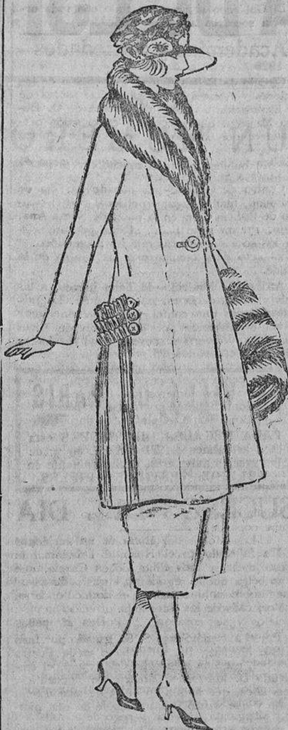
Sobre un traje sastre de «kasha», color cuero, unas trencillas a los lados lisas, y otras plisadas, del mismo tono. Gran cuello chal de piel.

No les recomiendo se aventuren en la confección del traje sastre, de no ser verdaderamente habilidosas. De otro modo, lo