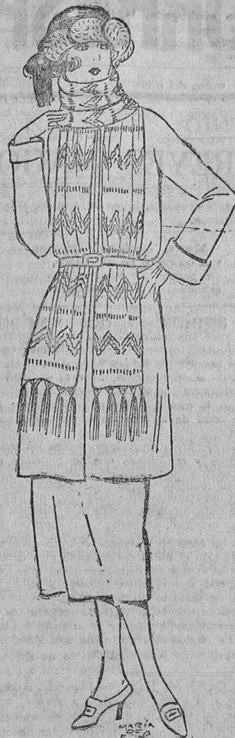
Una bufanda de punto de lana, del mismo tono que el traje, o bien de otro opuesto, puede bordarse con sencillez y adornar y dar confort a cualquier vestido.

más probable es que estropeen una tela costosa o que resulte una prenda poco elegante por faltarle el sello y la plancha de una mano hábil y especializada. Pero pueden ensayar, con probabilidad de éxito, la confección de una chaqueta recta, llamada saco, hasta la cadera, con cuello de piel y solapas sencillas, que no requieren mucho esmero. Dos pinzas, desde el hombro al pecho, le dan una ligera forma, y como esta prenda no tiene que amoldarse a la forma del cuerpo, los defectos y ligeras imperfecciones se disimulan. Unas tiras de piel, unos bordaditos, cualquier detalle, da una nota «chico» a esta chaqueta fantástica. Ante todo, recomiendo no elegir tejidos rayados o a cuadros, que requieren especial cuidado para que las rayas o los cuadros casen bien. También son difíciles de manejar los terciopelos, por el cuidado que requiere el sentido de los pedazos para que no hagan reflejos distintos. El forro debe ser siempre algo más flojo que la chaqueta. Este detalle es indispensable para el éxito. Los vestidos de fantasía son los más sencillos de hacer, teniendo un poco de gusto, sobre todo estos llamados «camisa», sobre la cual se arman mil detalles elegantes, y también las túnicas o largas blusas rusas, sin forma, y tan fáciles de variar de aspecto, según sea el cinturón, que lo mismo puede ser una modesta tira o trenzado de su misma tela, como una cadena y medallones de galalita o metal, o una ancha banda colocada sobre las caderas, con grandes caídas. M. DE M.