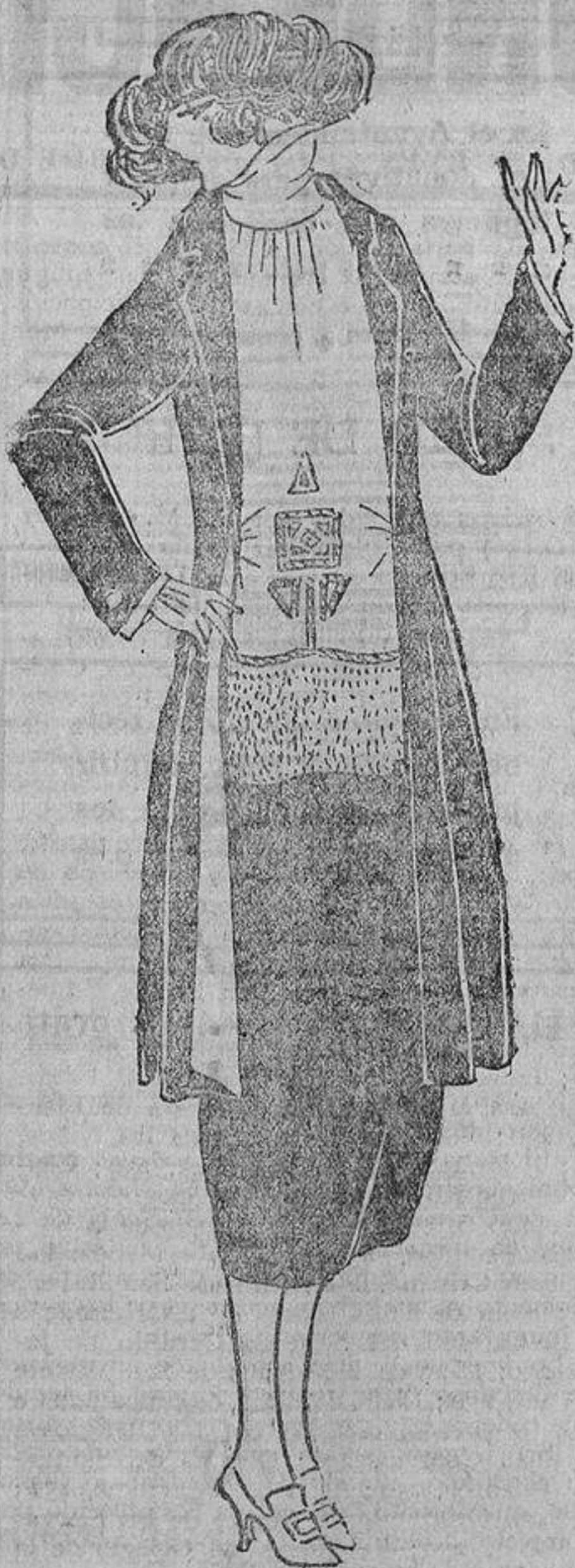
Los chalecos y las blusas que se llevan bajo los trajes sastre, han de ser bastante ajustados; este modelo, muy confortable, es de punto de lana, yema de huevo, con una tira de lana escardada y bordados azul marino.