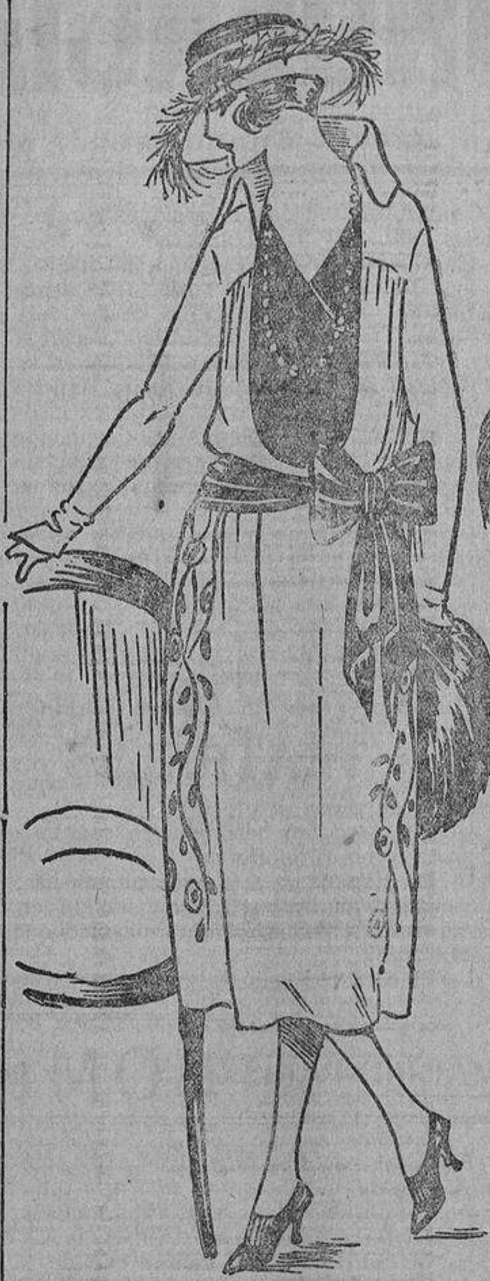
Al quitarse el abrigo podemos contemplar su vestido verde jade bordado con unas ramas negras de seda y azabache, y una banda y chaleco de raso negro.