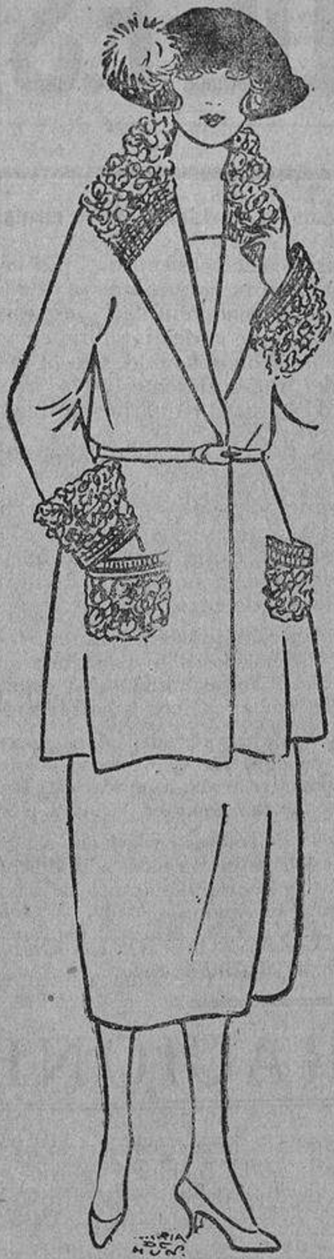
Como la piel de cordero teñida en gris está muy de moda, esta damisela no podía menos de llevarla en su traje azul marino, acompañada de unos galones de plata oxidada.