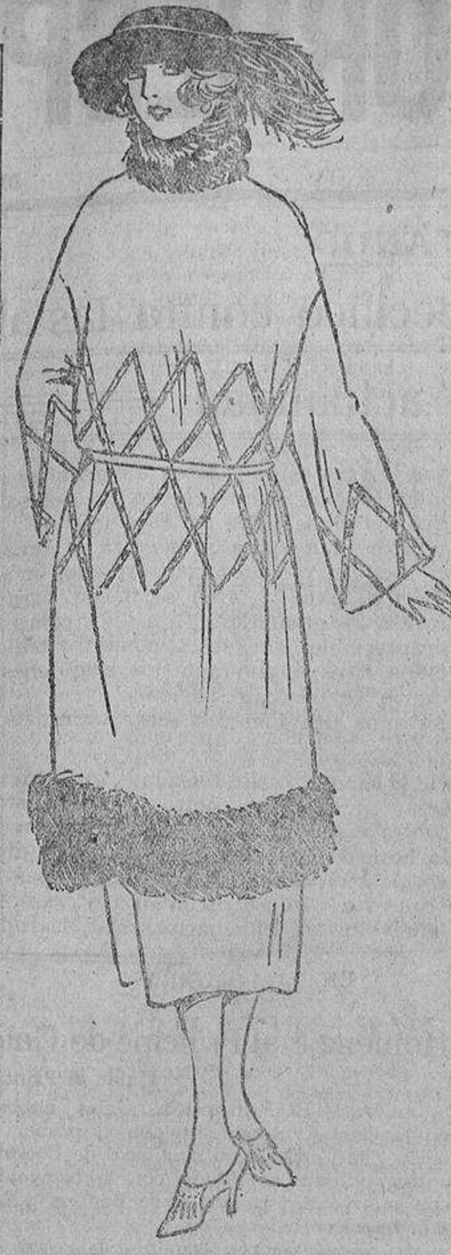
En un traje de terciopelo de lana rojo etrusco, unos pespunte de seda negra y unos azabaches, además de un cuello y zócalo de piel negra.

tan el vino, después no votan mas que por su idea.