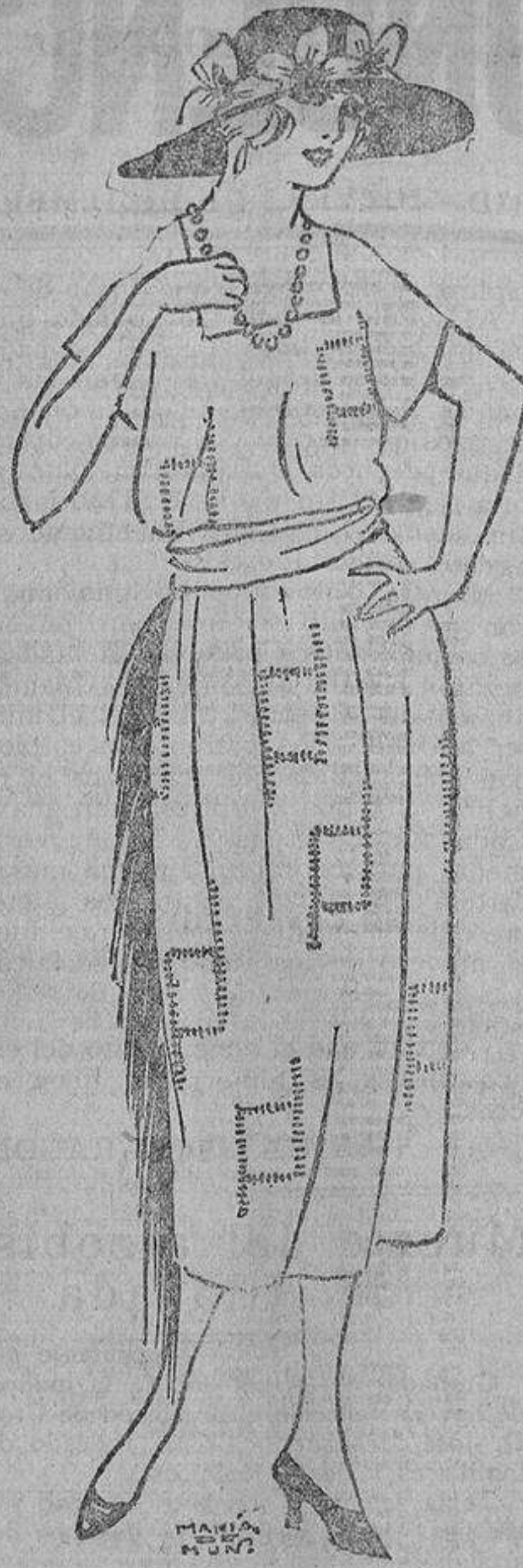
A un lado, fleco de piel de mono o de seda y motivos bordados con cuentas tubulares blancas sobre la seda azul marino.