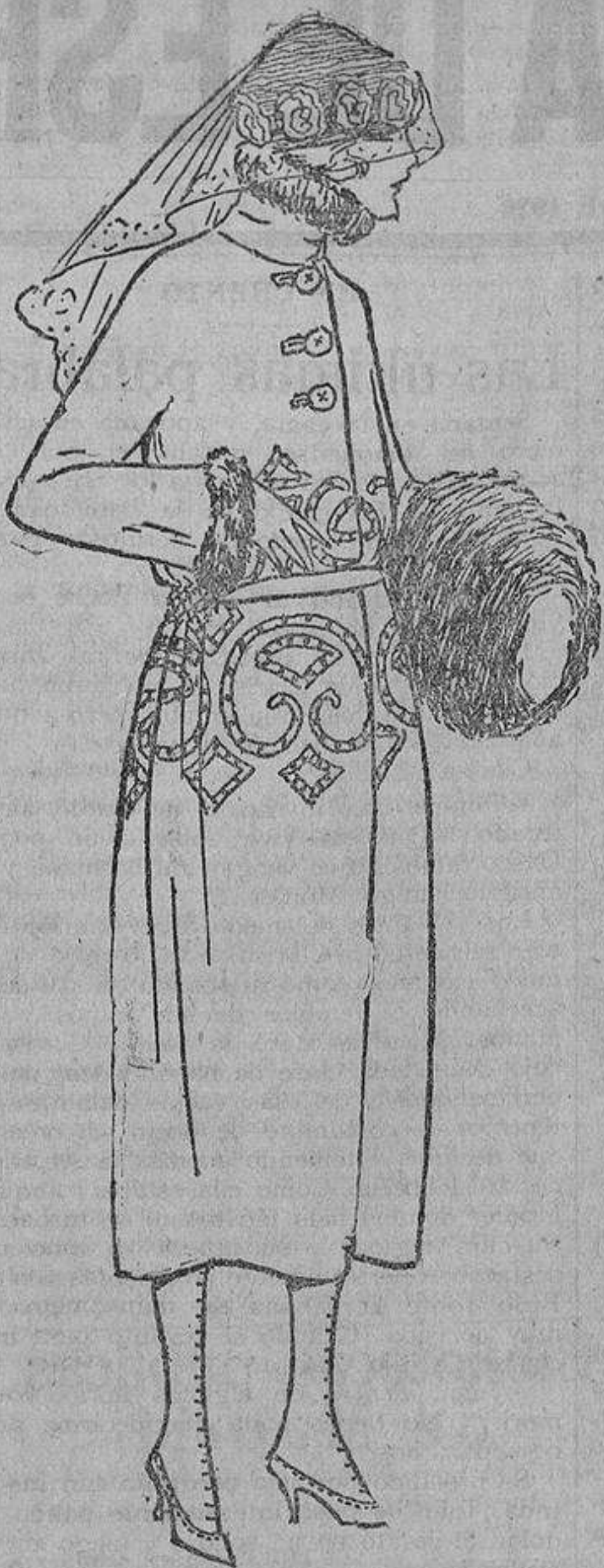
Para un vestido o un abrigo este detalle, hasta ahora reservado para labores de casa, que consiste en unos calados «Colbert» por entre cuyas presillas puede verse el forro, de un tono distinto.

Señor.—No hay que hacer caso; no se compran las conciencias de los hombres con un vaso de vino blanco o un vermouth de granadina, y casi siempre los que acep-