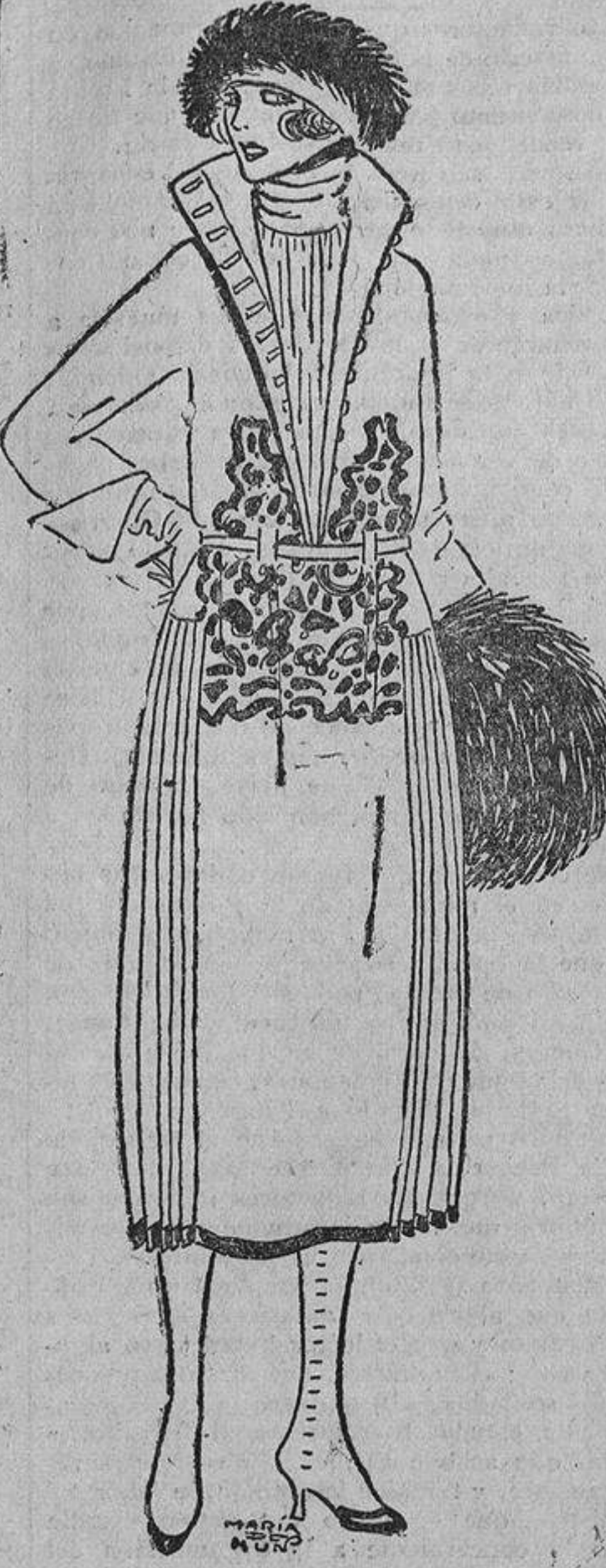
De «kasha» o fina sarga marino, lados plisados, vivo en el borde y bordados rojos. El cuello puede cerrarse.

su locura; pero no les quedaba más remedio que el tiempo. ¡Y la impaciencia lo hace tan largo!