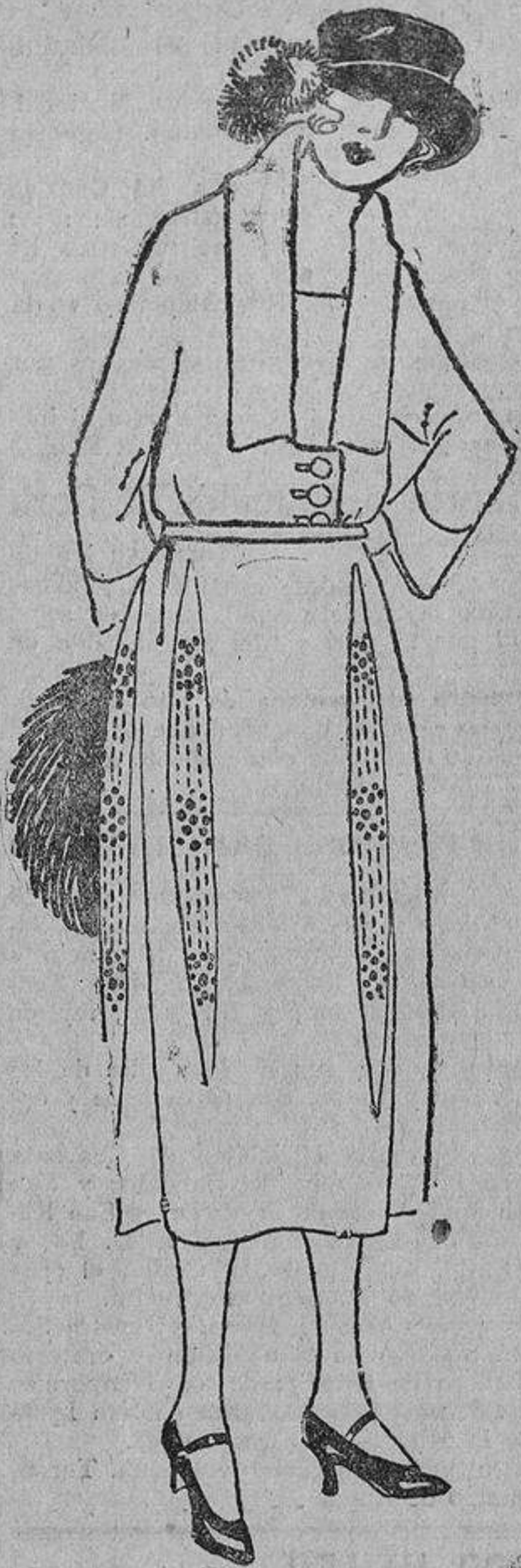
Puede ser la gabardina marino con unos acuchillados de raso negro bordados en rojo, o bien de paño azul «natier» (en vez del raso), bordado en azul marino.

Muy pocas veces se veían mujeres a quienes el cambio mejoraba. Para estas pocas beneficiadas, ¿cuánta jamaña cuarentona, ridículamente disfrazada de bebé!