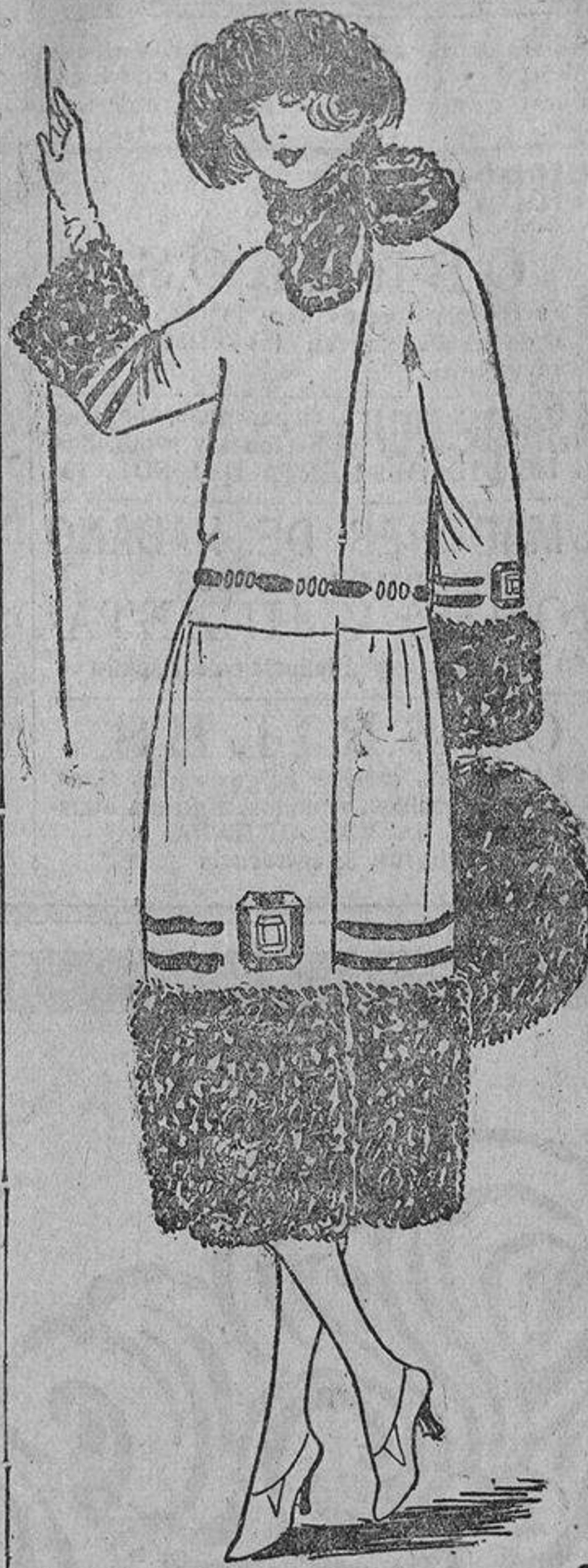
Buscad en el fondo de los baúles pedazos de astracán o caracul (que se vuelve a llevar), y haceros este abrigo de lana color cobre adornado con tiras de cinta encerada negra.

modelo comprado en Biarritz; seiscientos francos; favorece mucho y da pena. ¿Un jersey?... ¿La faldita plisada?... Si; pero todo eso es necesario, y en llegando a casa, todo lo regalado necesita ser repuesto, lo que representa un nuevo gasto para usted, señor marido. Y si lo lleva todo consigo, se ve usted obligado a pagar un precio exorbitante por el exceso de peso.