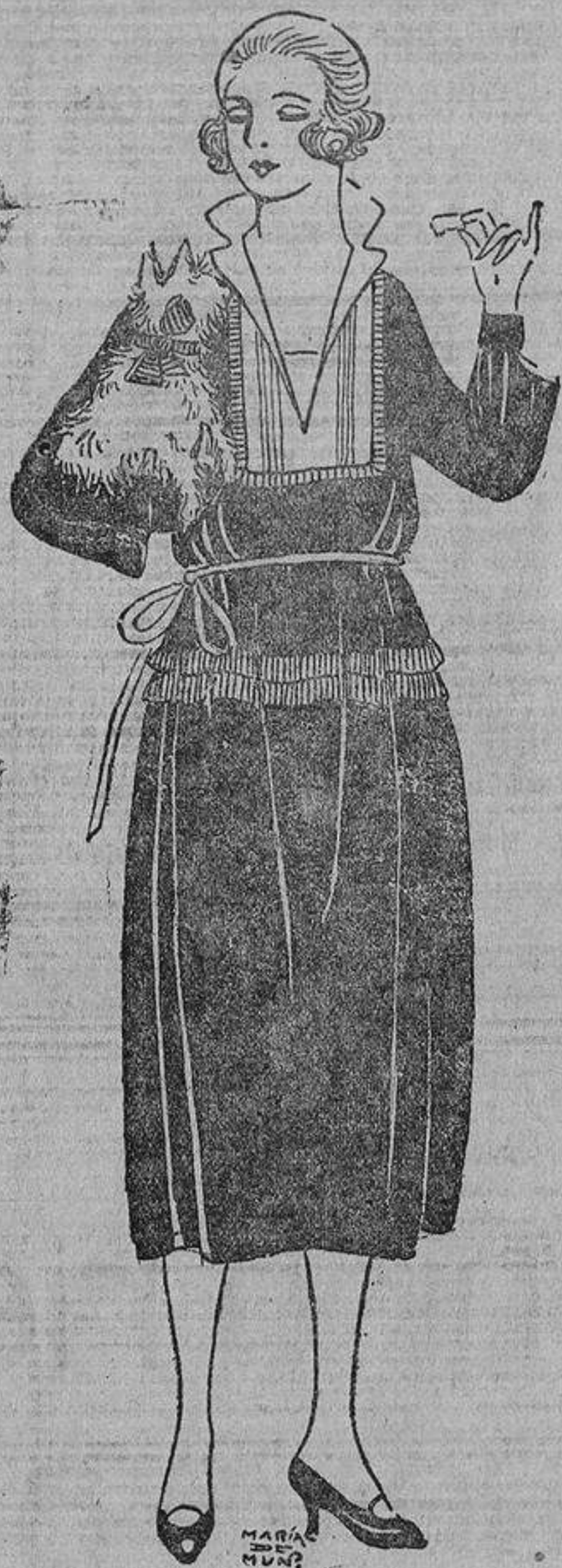
Gustará, por su sencillez, este vestido de terciopelo negro, adornado con trenzilla brillante y bordaditos de azabache. Pechero de seda lavable blanca.

¿Regalar a las amigas algunas prendas? Pero ¿cuáles? El traje verde es un