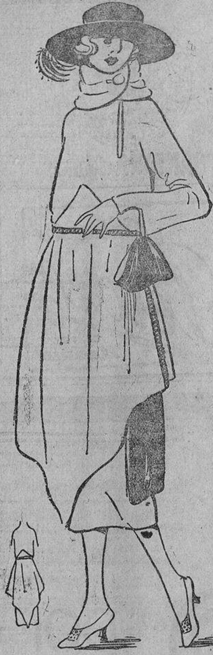
Este otro, formado por dos pañuelos, uno delante y otro detrás, abiertos a los lados, puede ser de un tejido de lana, terciopelo o seda. Caída de cinta en el lado izquierdo.