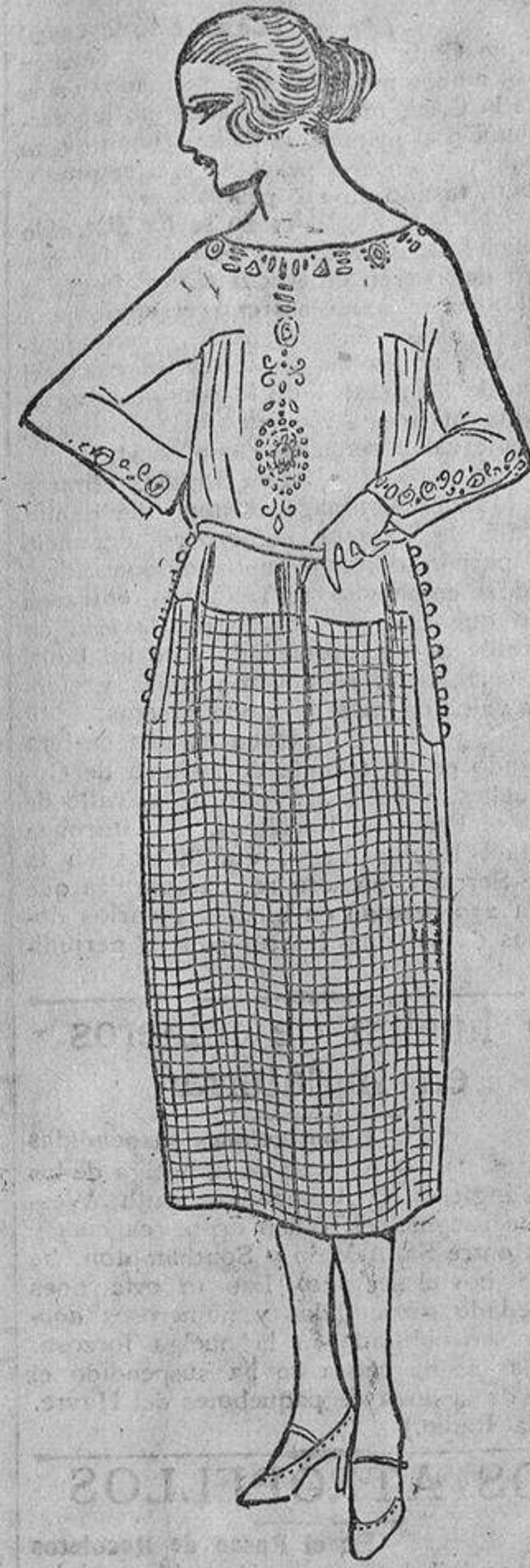
Bajo la capa descrita, este vestido a cuadros marino y verde; la parte superior es de grueso crespon verde bordado en azul marino.

sobre todo tratándose de un tono muy pálido, que favorecerá a las morenas. El azul, que sienta a las rubias porque armoniza con sus ojos, requiere elección cuidadosa, cambia mucho a la luz artificial; el mismo azul que encanta a la luz del día se apaga a la luz artificial, y un azul demasiado vivo para la calle se atenúa y toma reflejos preciosos con la luz artificial.