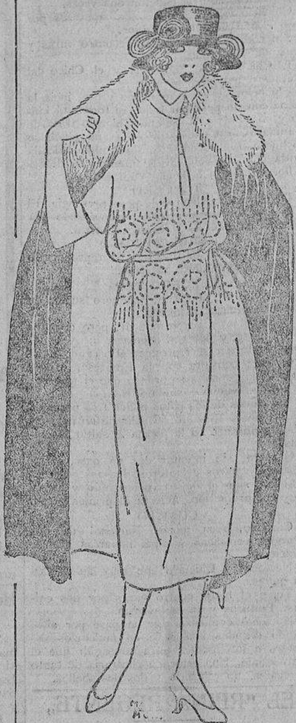
Seduce la sencillez de este modelo de gabardina azul marino bordado con cuentas de perla blanca. El mismo puede hacerse en tafetán negro.