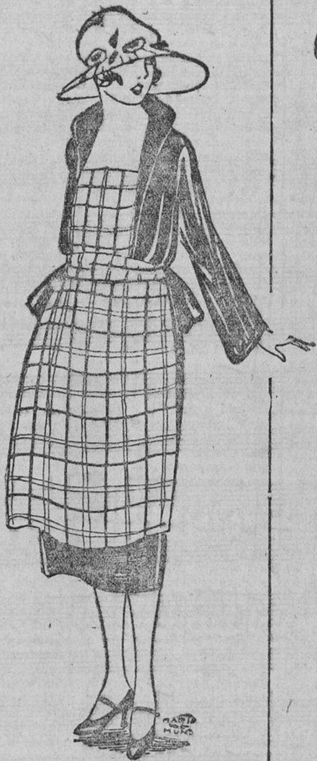
Una linda manera de «refrescar» un vestido «camisa», añadiéndole un pechero y un delantal de taletán escocés en tonos discretos.