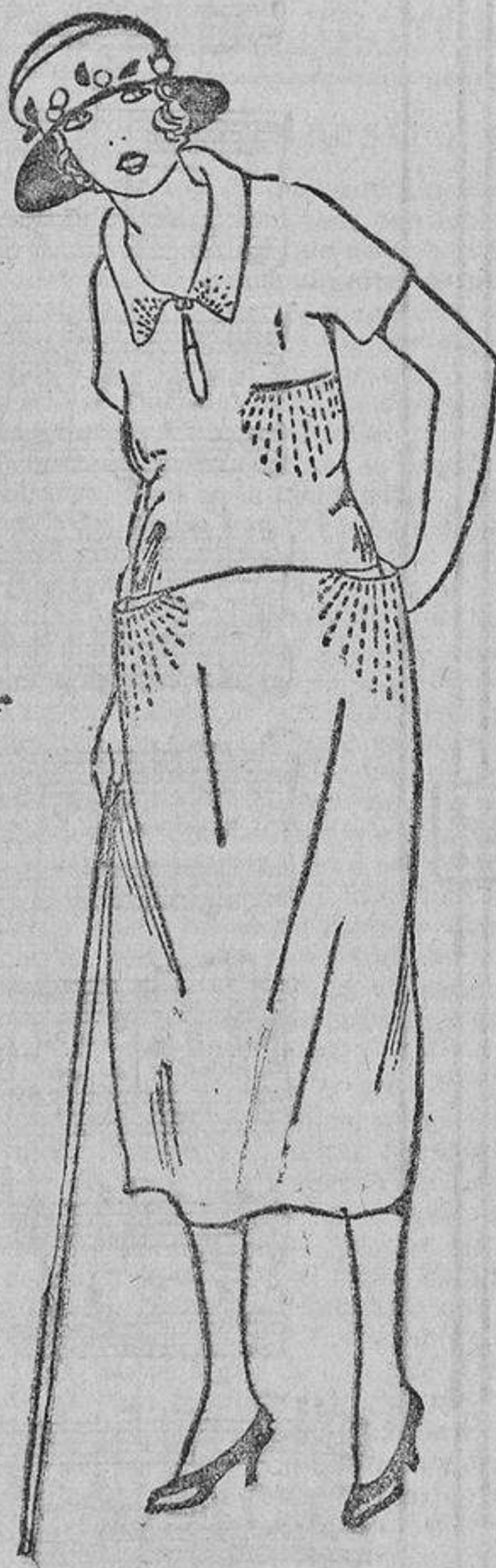
Muy sencillo este vestido de tela esponja, adornado con unos pespantes de lana en un color vivo, sobre los bolsillos.