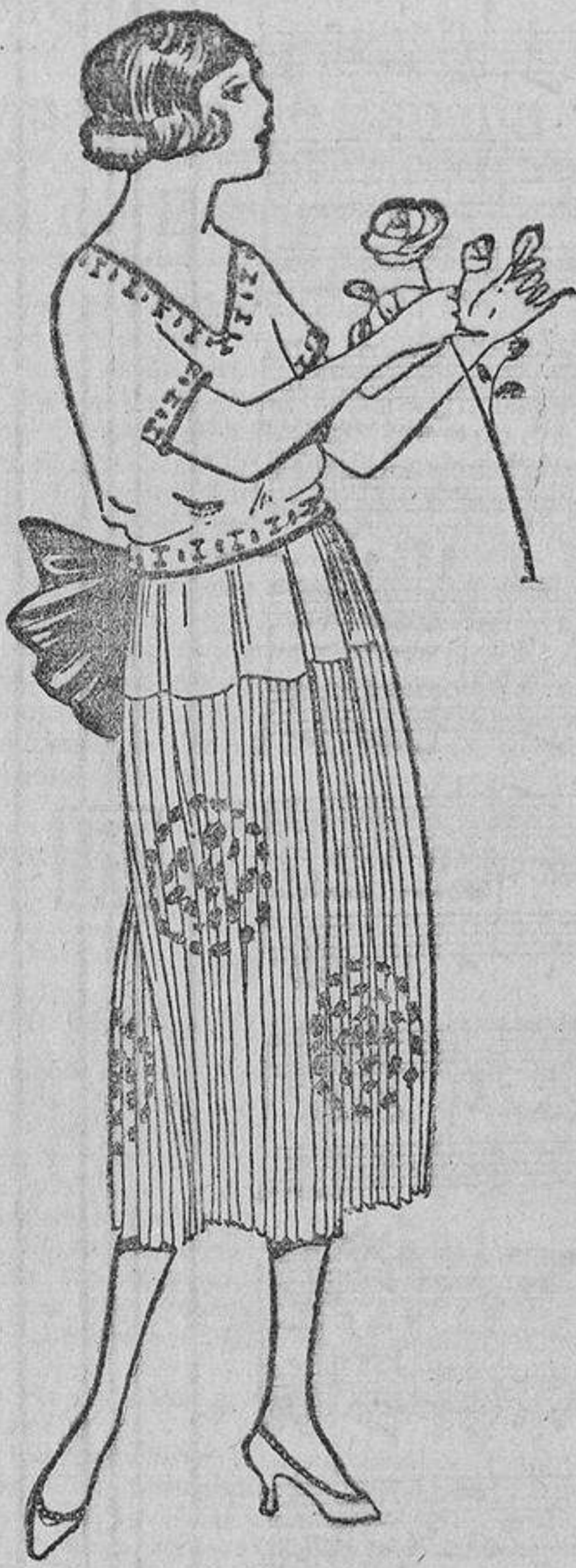
Crespón de China salmón pálido con bordados azul porcelana, y un gran lazo mariposa, de laya del color de los bordados.