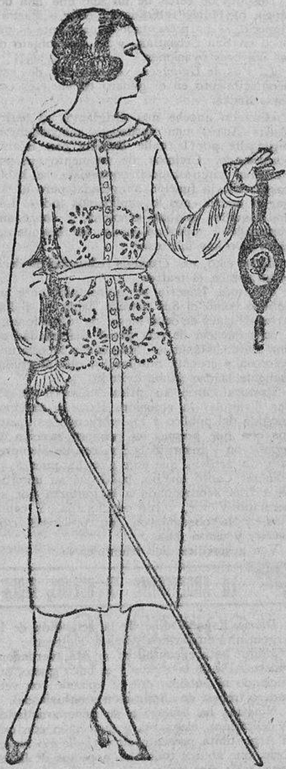
En una tela de hilo rosa pálido ella misma ha bordado con algodón blanco unos motivos casti...