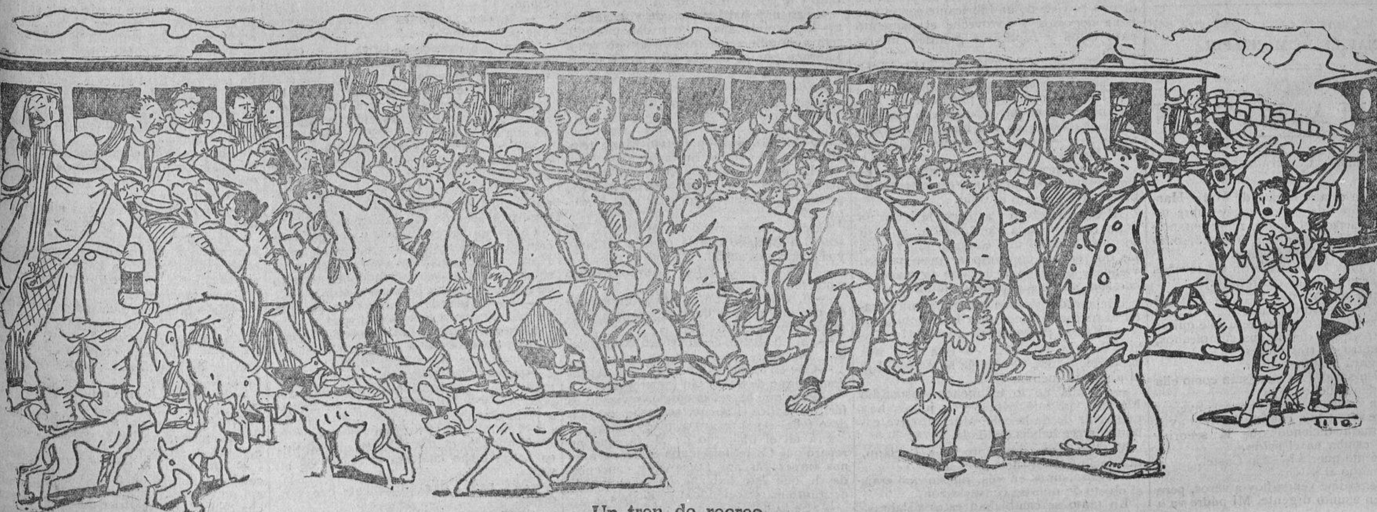
Un tren de recreo