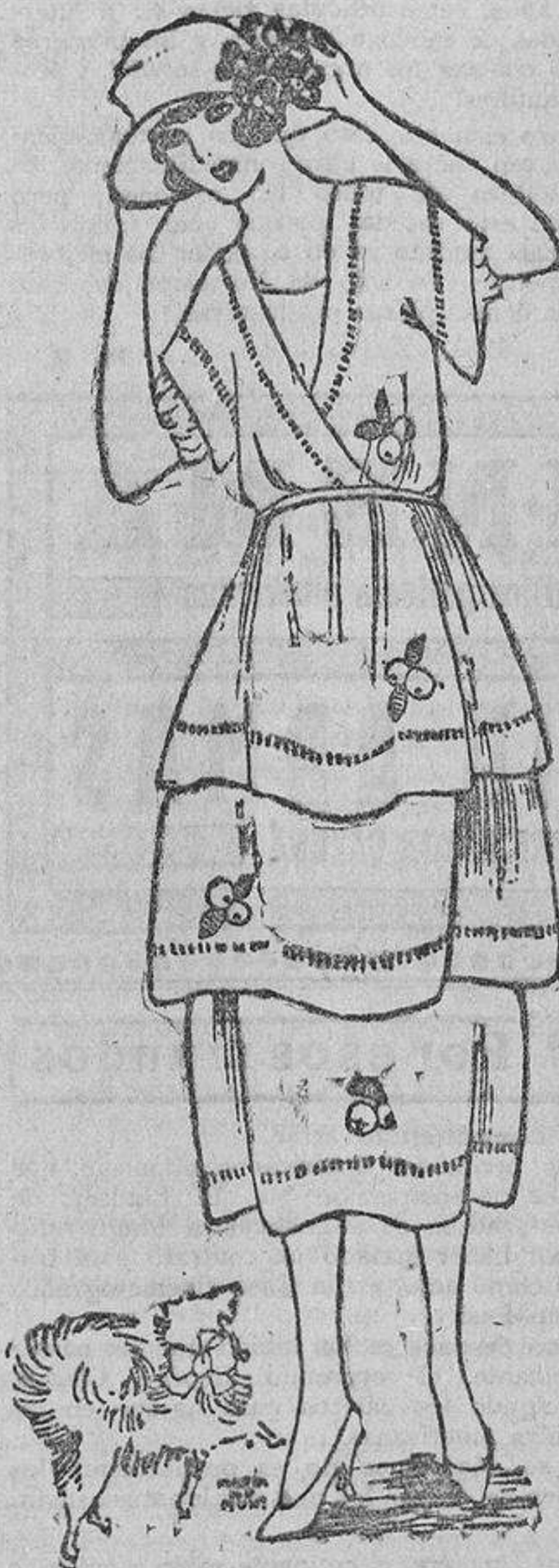
Una nota sencilla es este vestido de «tussor» blanco con tiras de tussor color limón en el borde, unidas con calado y unas frutas recortadas de goma.