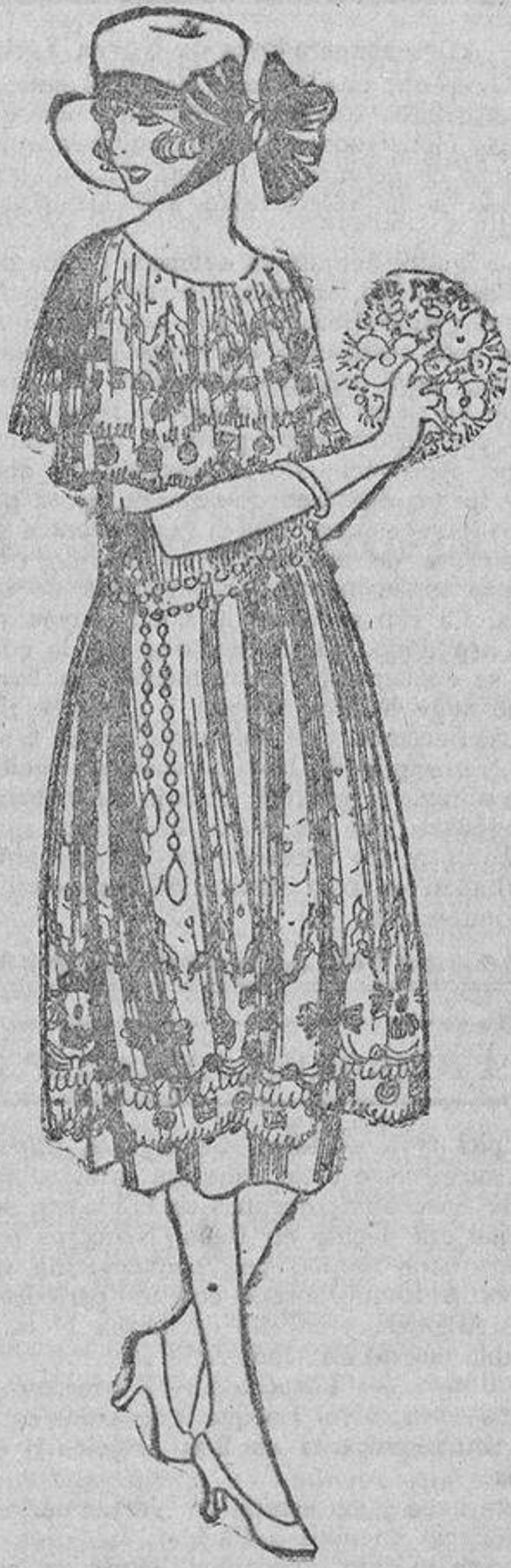
Un vestido de encaje de algodón o tul bordado, color crudo, con doble fila de cuentas verde maquina.

Las pomadas y materias grasientas son perjudiciales, ya que aumentan el carácter grasiento de esta secreción.