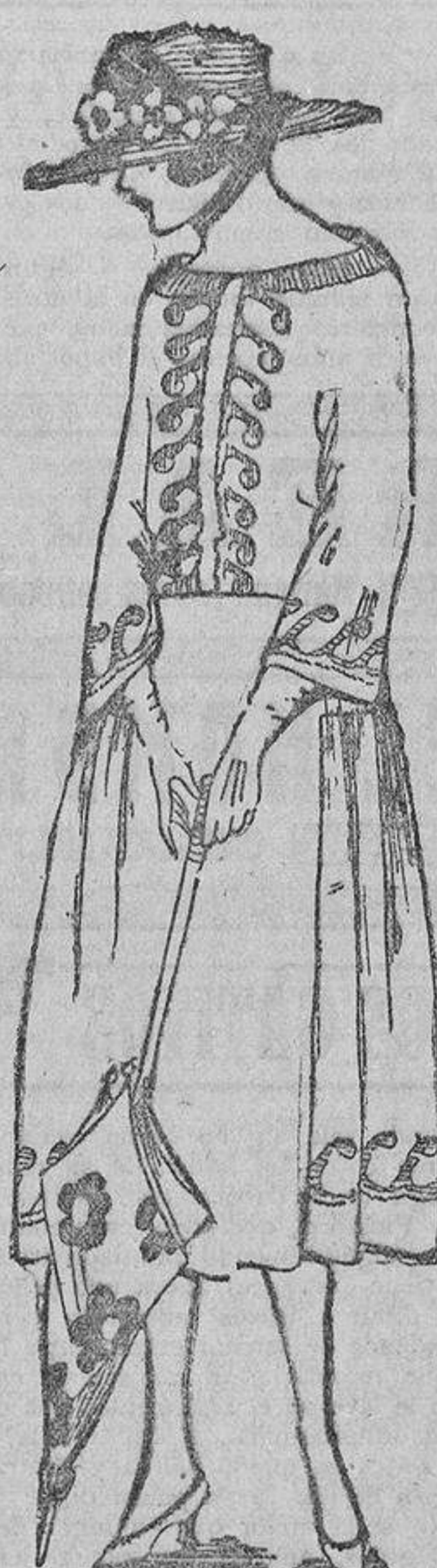
Unos bordados rojos de algodón grueso lavable sobre un vestido de algodón crudo y una hilera de botones rojos de gualita.

Deben usarse lociones alcoholizadas, como la siguiente: