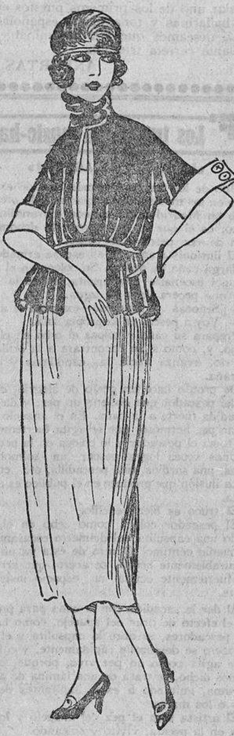
Esta blusa adornará cualquier falda sencilla gracias a su aldetá; es de seda negra, con un pechero blanco, vivos y carteras asimismo de seda blanca.