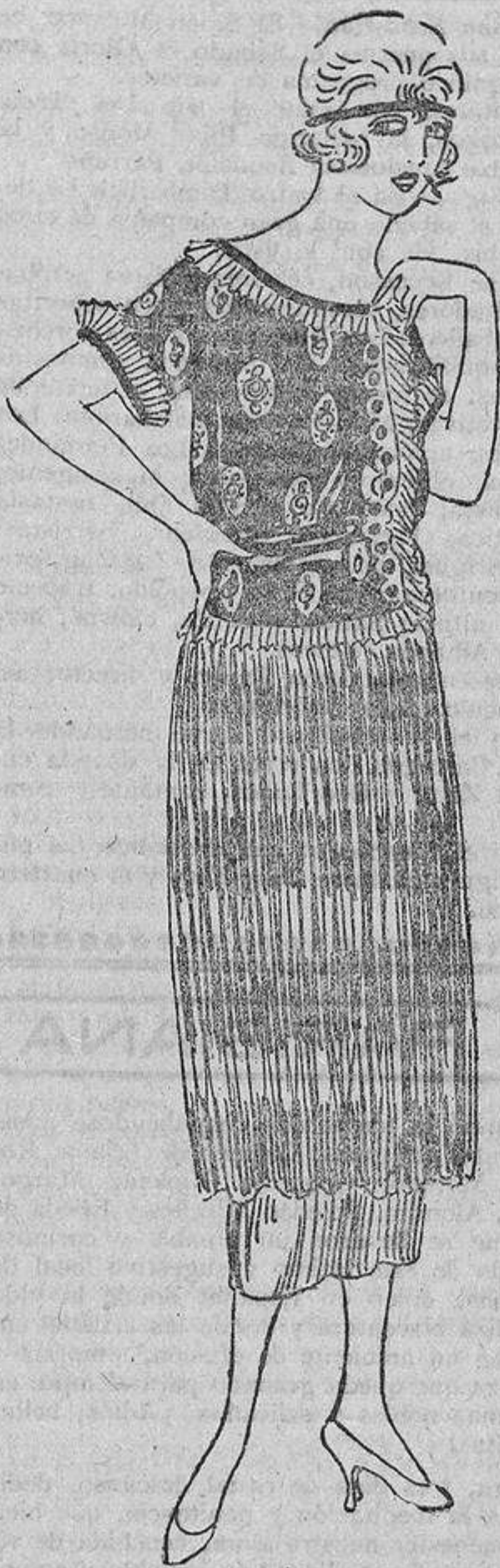
Las blusas, esas importantes partes del vestido que hace años proclamaron su independencia, deben hacerse con manga estrecha cuando han de ir bajo chaquetas; este modelo es de «double» estampado, con plissés y se abotona en el lado izquierdo.

Hervid 20 gramos de manteca con 125 de cera blanca. Al empezar la ebullición añadid 30 gramos de oraneta en polvo y tres racimos de uva negra de buena clase. Dejad hervir todo hasta que tome la con-