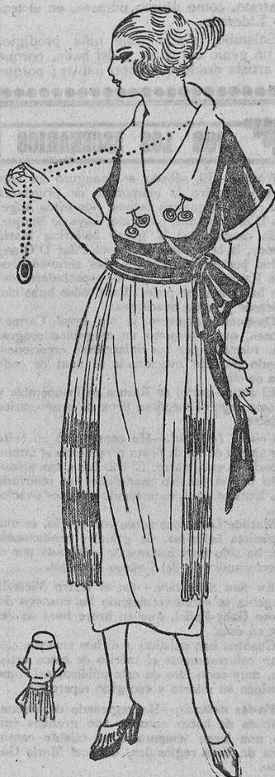
Un crespón de china fresa ha sido elegido para confeccionar este bonito modelo cuyo cuerpo cruza a un lado, donde se anuda. El cuello es de crespón de seda blanco, bordado en azul fresa y limón.

sistencia de un jarabe. Colad con un trapo, sin comprimir.