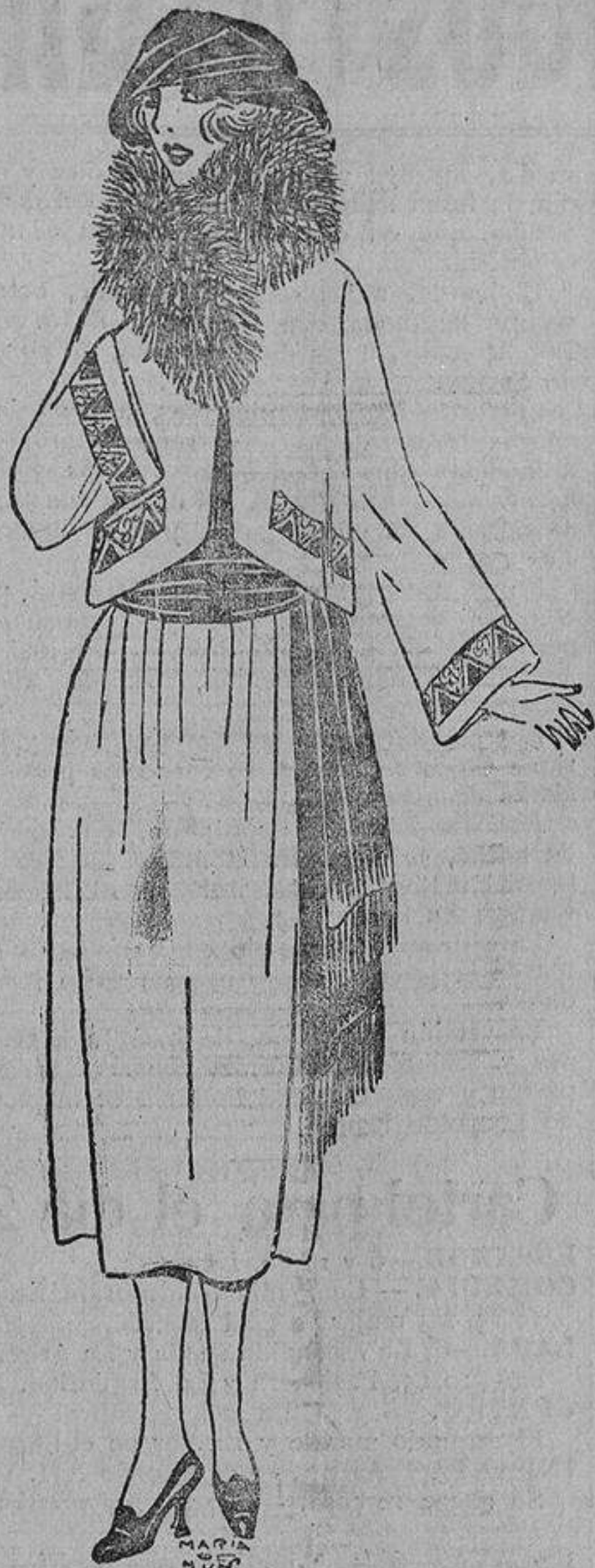
Veremos también algunas «toreras» bordadas que son saladísimas en mujeres esbeltas, de talle flexible.