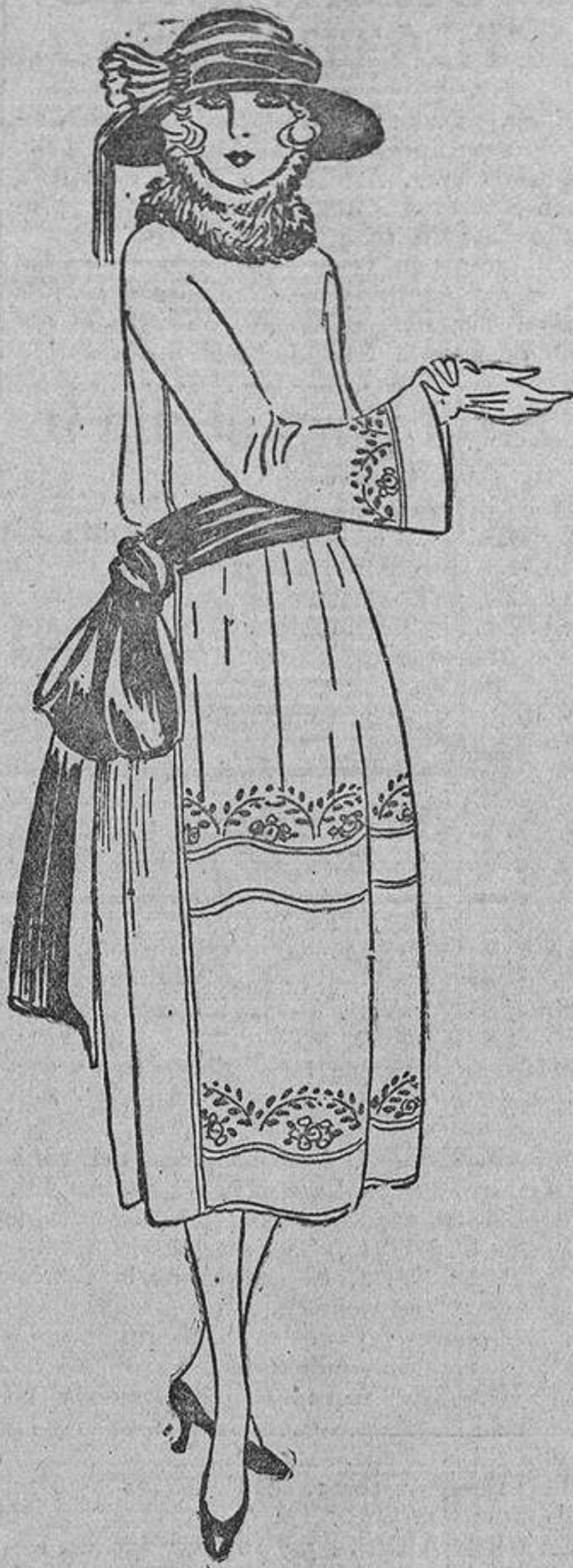
...Así como este modelo de crespón de China, color ocre, con bordados negros y banda también negra.