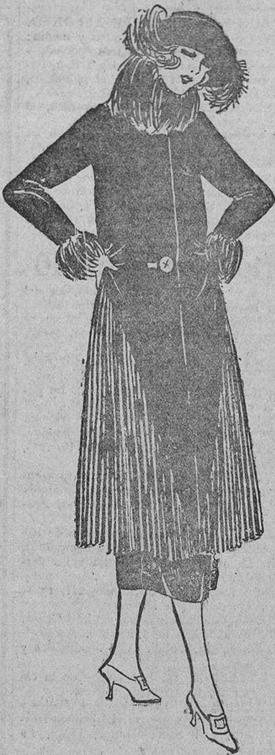
Una levita fantasía, de sarga azul marino con los lados plisados y guarnecido de piel de mono, no podemos negar que tiene un aire de gran modisto...

Desde el patio de butacas, donde yo estaba, el efecto era feísimo, y más por ser brazos gordos, pues es sabido que la belleza no reside en la gordura ni en la «es-