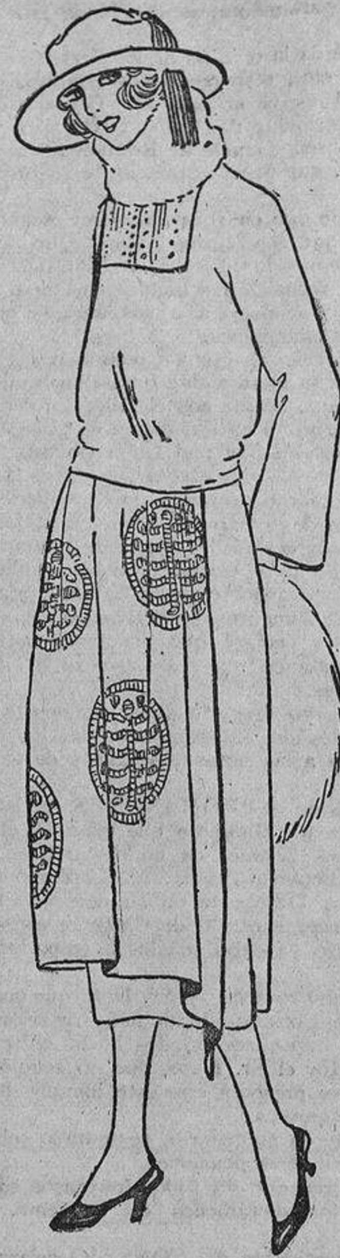
Para las mismas ocasiones se lleva este vestido de terciopelo negro, bordado con espuma azul Talavera; delantal forrado de crespon, azul ídem.

Además, los magníficos candelabros diseminados sobre los muebles, dan un carácter aristocrático a las fastuosas mansiones modernas, carácter que es muy buscado a pesar de la democracia de estos tiempos.