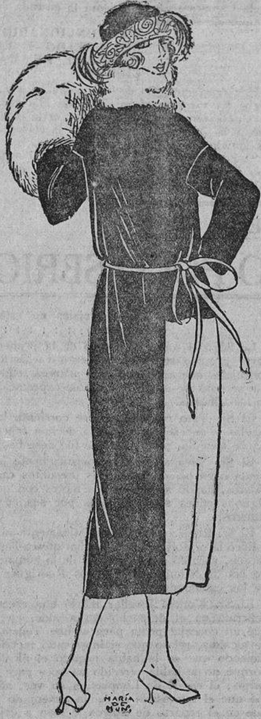
La combinación de tejidos acertados es de un efecto elegante, como sucede con este abrigo de raso negro o marrón, combinado con terciopelo negro, gris o marrón, o bien un grueso paño flexible mate.

Parecemos fatigadas de la crudeza impertinente de la luz eléctrica que fatiga la vista. Las velas, colocadas en modernos candelabros, proyectan una luz suave y temblorosa que hace brillar la cristalería y la plata, se multiplica en los espejos, realza el valor de los más insignificantes objetos, y no es dura para los rostros que han perdido el primer esplendor de la juventud.