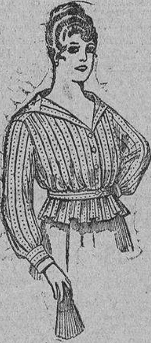
Blusa batista listada, cuello organdín con calados, 4 pts. 3,50 y 4