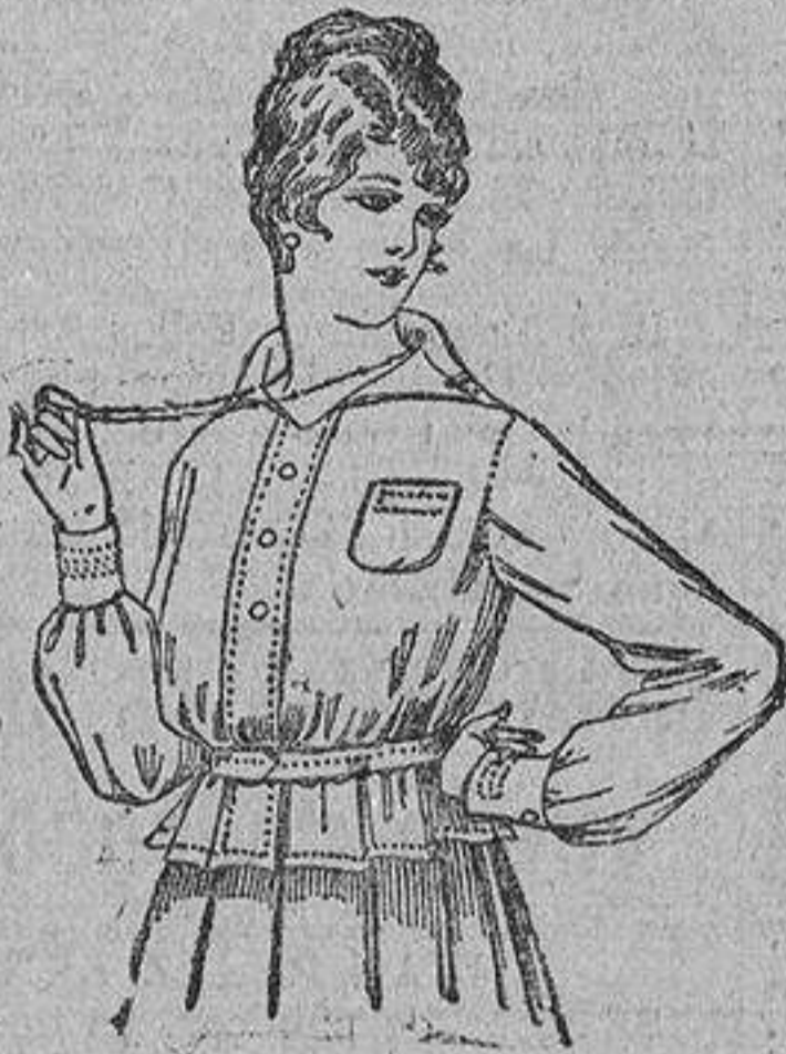
Blusa batista blanca, cuello con calados, 4 pesetas..... 4,50