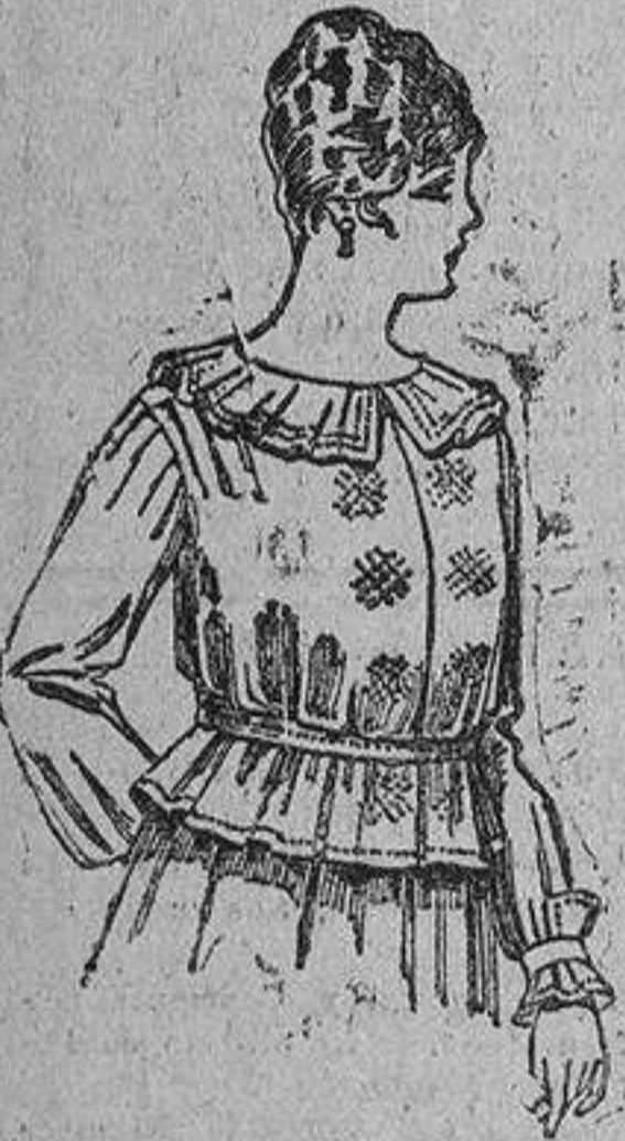
Blusa rolle, con bordados blanco y negro, 6 pesetas... 6,50

Trajes de dril crudo, kaki ó listado, de pesetas..... 10 a 33. Los mismos, a medida... 36 a 64. Trajes estambre «Fresco», azul y colores, de pesetas.... 28 a 60