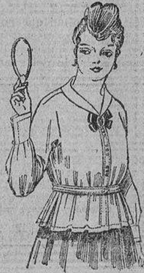
Blusa batista blanca, cuello organdín, lacio seda negro, 4 pts. 6