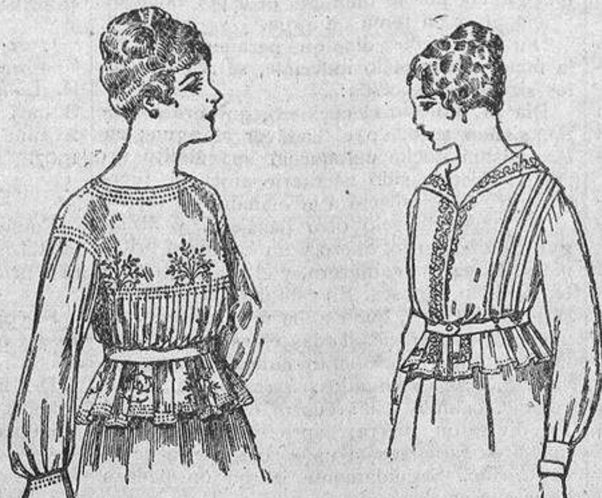
Blusa seda bordada, para señora, á ptas. 33. Gran surtido en blusas seda, variados modelos, de ptas. 10 a 35. Blusas voile bordadas, señora, á ptas. 9,50. Gran surtido en blusas, nips, voile, diferentes modelos, de ptas. 3 a 18.

Sucursales: Barcelona, Alicante, Almería, Bilbao, Cádiz, Cartagena, Gijón, Granada, Málaga, Palma de Mallorca, Santander, Sevilla, Valencia, Valladolid y Zaragoza.