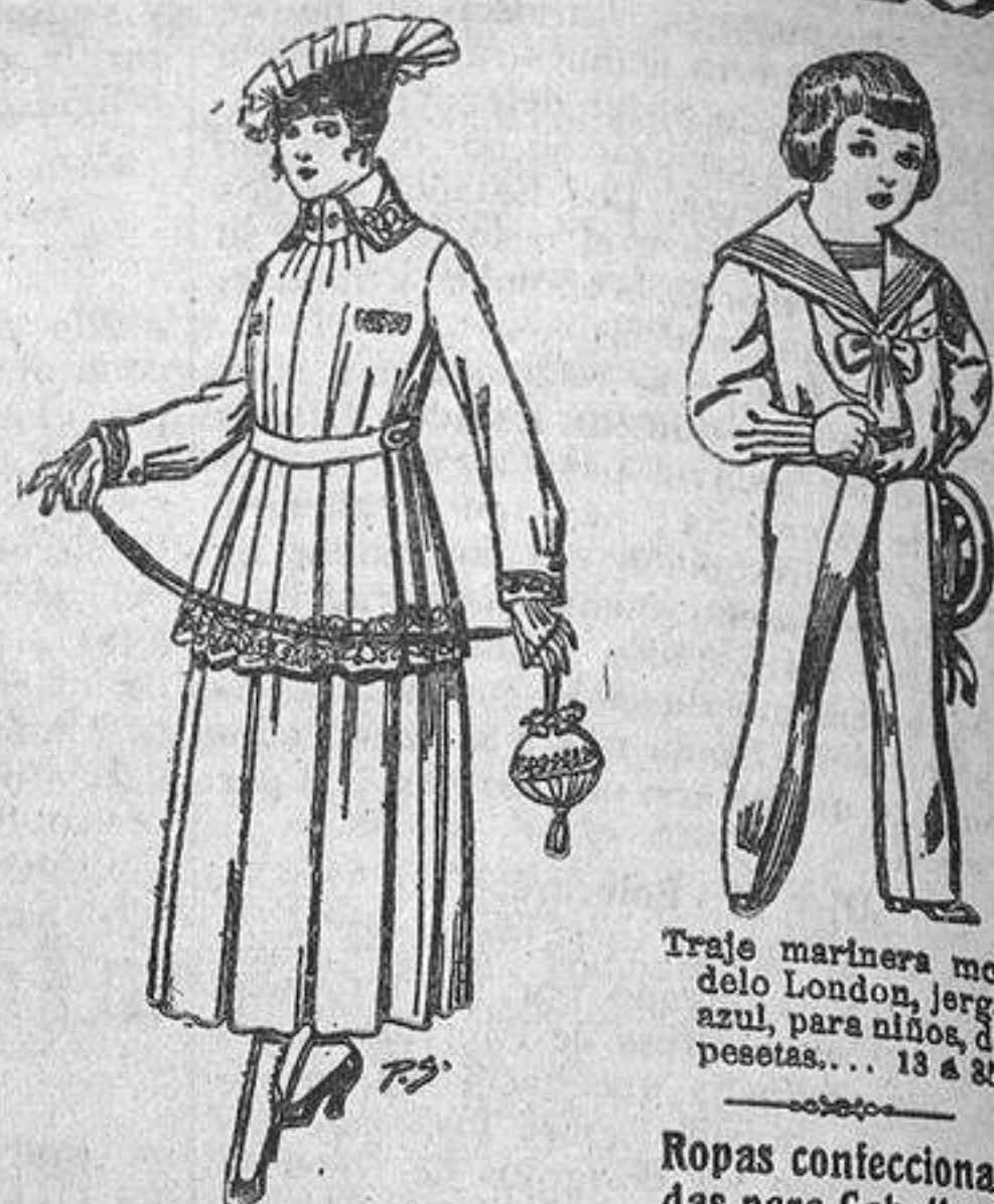
Traje marinera modelo London, jerga azul, para niños, de pesetas. 13 á 35. Ropas confeccionadas para Caballero, Señora y Niños. PRECIO FIJO Ventas al contado.

Camisería, Géneros de punto, Corbatería, Guantería, Sombrerería, Zapatería, Paraguas, Bastones y Artículos de viaje.