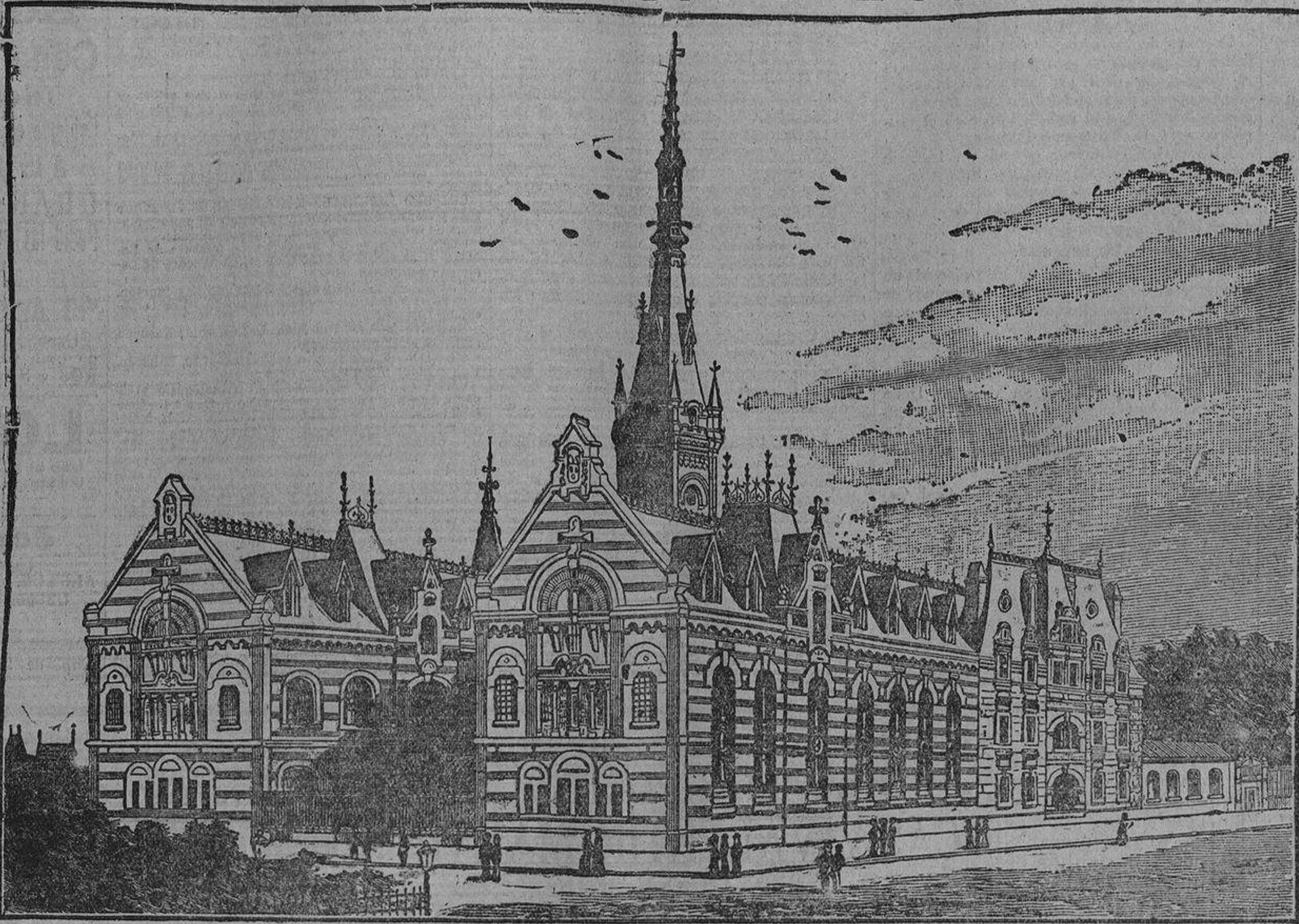
La fábrica del Licor BENEDICTINE ocupa una superficie de 10,000 metros cuadrados, hace trabajar 350 obreros en Fécamp y produce cerca de 2.000,000 de botellas al año.

El Licor BENEDICTINE se usó en muchas ocasiones y con la mayor eficacia contra las enfermedades epidémicas; así es que tiene su sitio indicado en el hogar de cada familia.