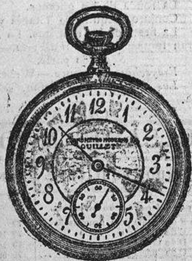
N.º 1.—SIN TAPA

Va acompañado de un Boletín de Marcha y de Registro, expedido por una de las primeras Manufacturas de Relojería del mundo. Está garantizado por 5 años y su precisión