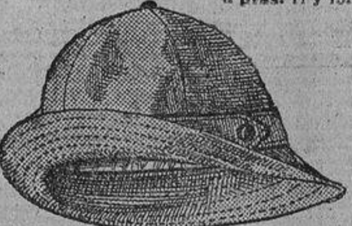
Sombreros impermeables, para niños, color beige, a ptas. 4.