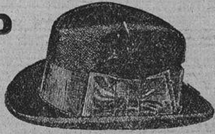
Sombreros flexibles, de fieltro, gran novedad, clase fina, surtido en colores, a ptas. 7,50. Los mismos, en clase superior y extra, a ptas. 11 y 15.