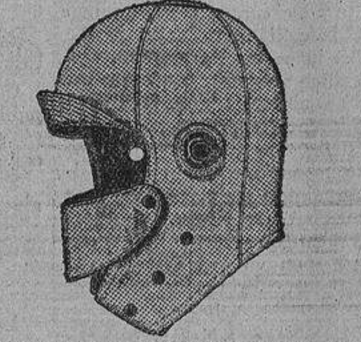
Gorras de lana, para auto y moto, clase superior, a ptas. 8.

GRAN SORTIDO EN BOINAS PARA CABALLERO Y NIÑO