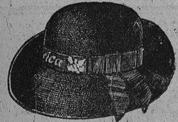
Sombreritos de fieltro, para niños, varios modelos, surtido en colores, a ptas. 6,50.