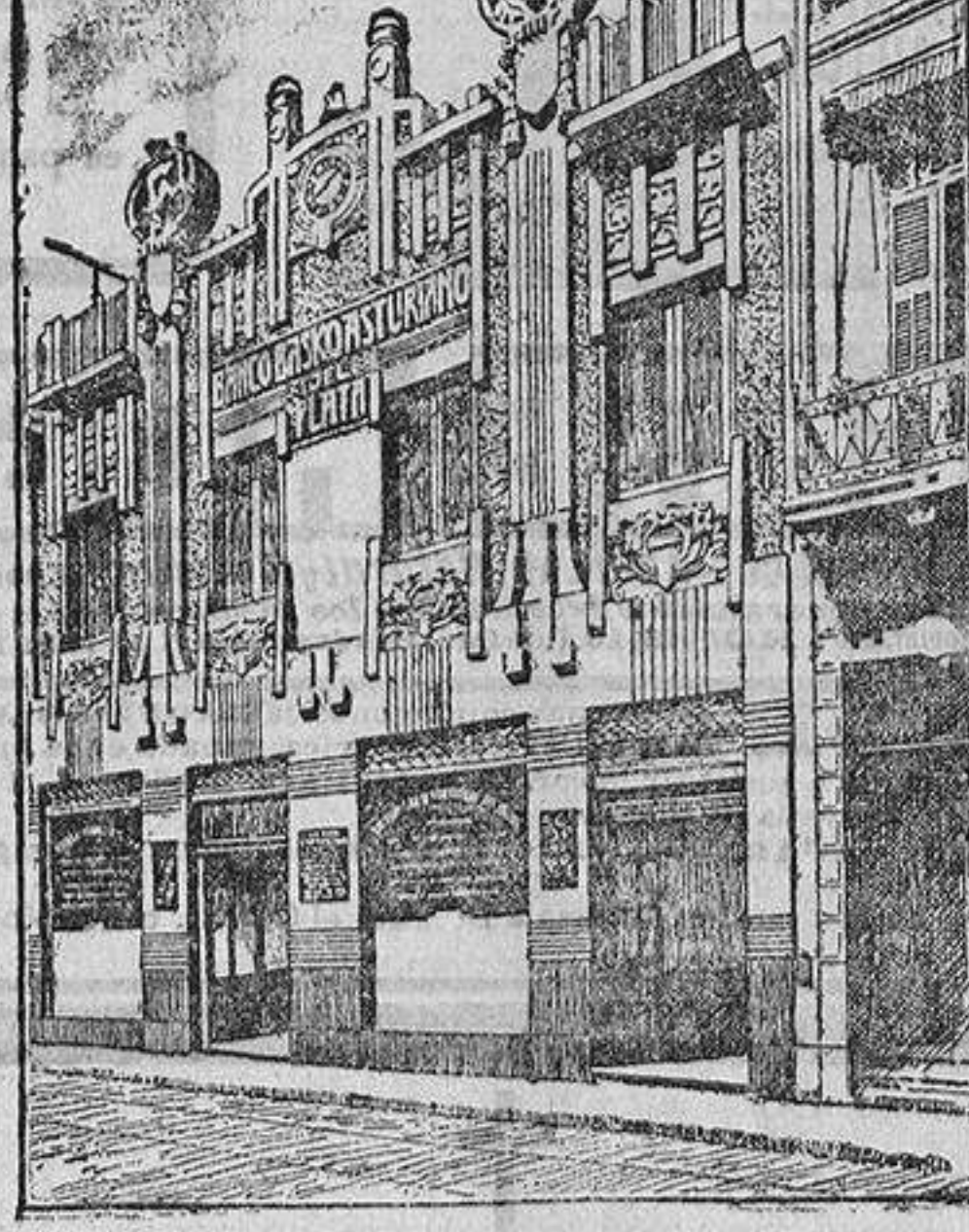
EDIFICIO DEL BANCO

Los grandes Mercados del Plata consumen anualmente del Extranjero productos por valor de 500 millones de pesos oro, y de España sólo 14.