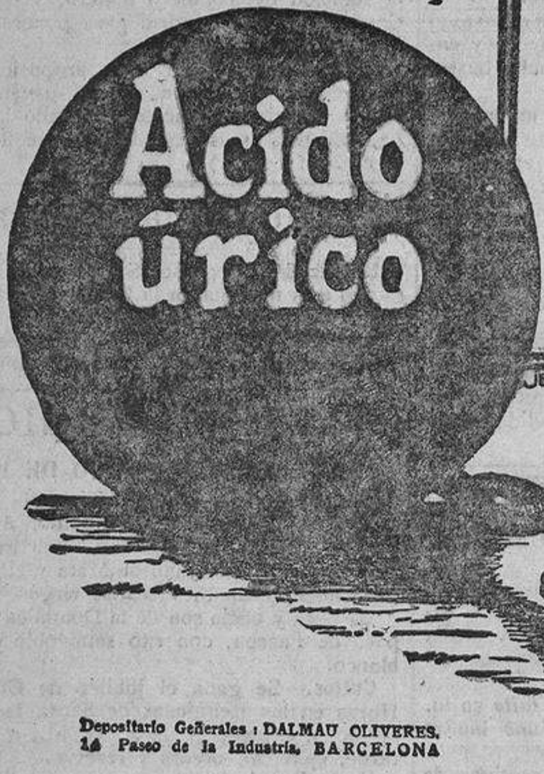
Depositorio Generales: DALMAU OLIVERES, 18 Paseo de la Industria, BARCELONA

La caja de 12 paquetes de Lithinés del Dr. Gustin para hacerse 12 litros de agua mineral: 1 ra 50