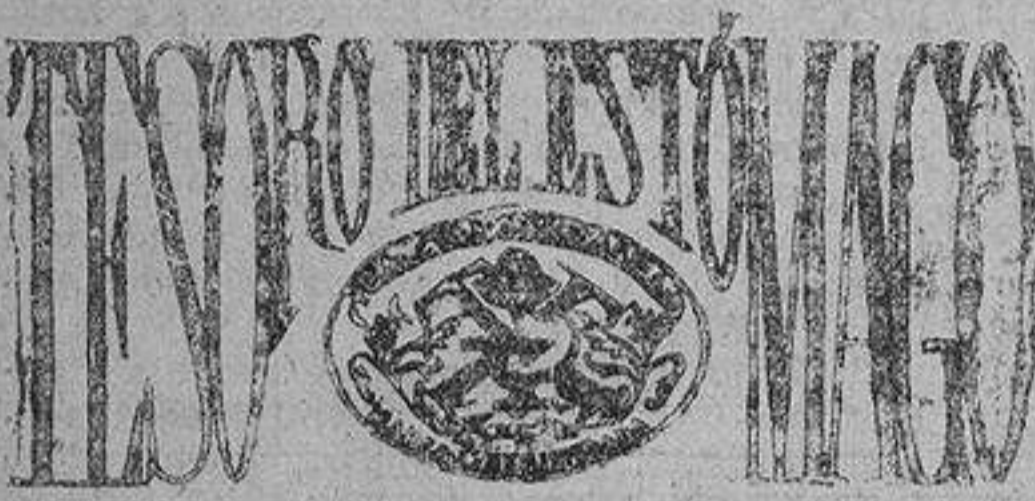
TÓNICO-DIGESTIVO Y ANTICÁUSTICO

ANEMIA DEBILIDAD Verdadero HIERRO QUEVENNE La Prensa, Curmen, 18