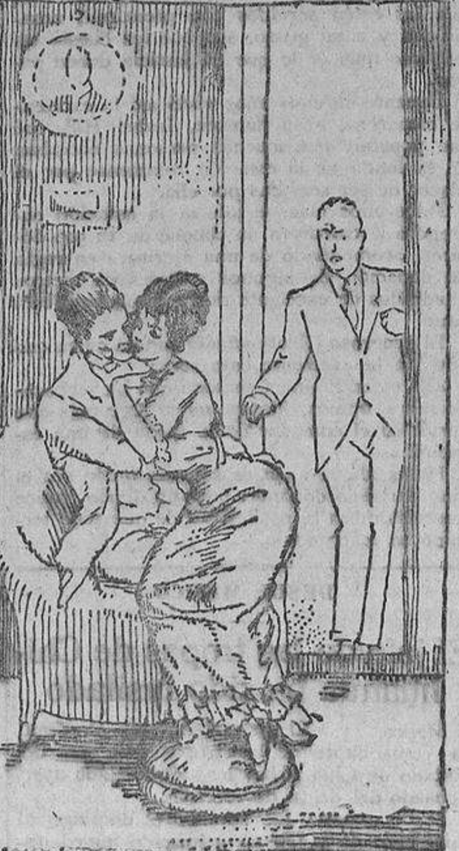
Nora se hallaba con mi criado...

Tom Greenwood clavó en su hijo una mirada agradecida.