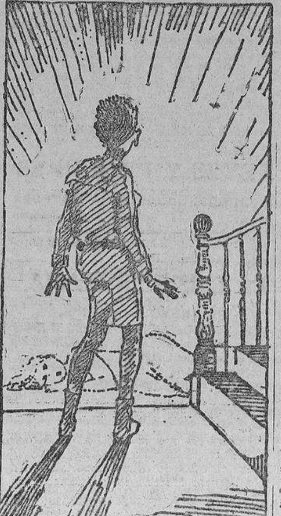
...intinto a la galería vió una mujer...

Tom Greenwood se le quedó mirando fijamente. ¡Diablo de muchacho! ¡Qué