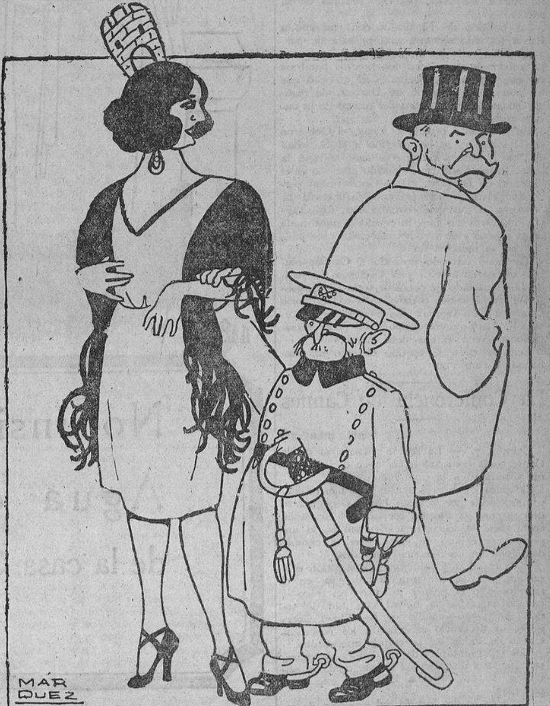
«Es mi hombre».