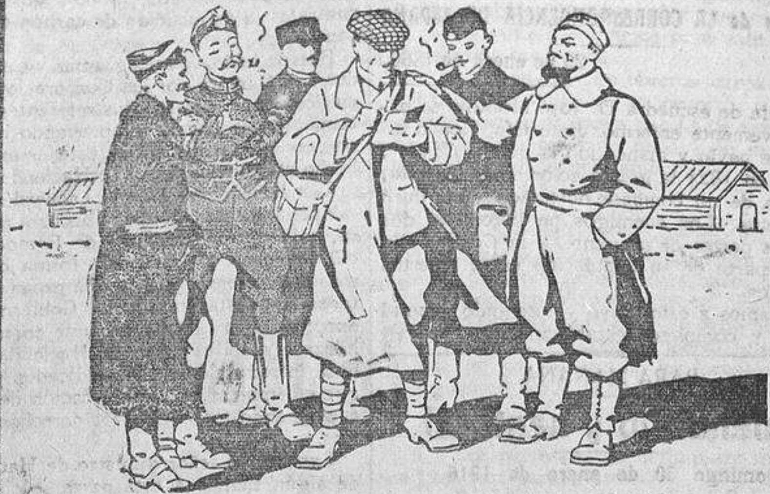
M. W*** reporter holandés interrogando a los prisioneros del campamento de Harderwyk.