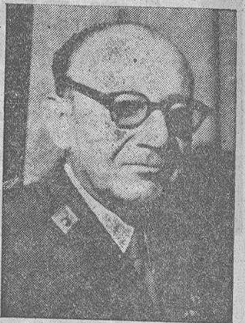
DON JORGE VIGON

Al levantarse a hablar el señor Vigón, todo el público le tributó una gran ovación. El ministro, en su discurso, después de unas palabras de saludo, comentó la ponencia que tiene puntos de contacto con la función propia de su Ministerio y más concretamente en el aspecto que se refiere a carreteras, ferrocarriles, puertos, obras hidráulicas y a las tareas de saneamiento de poblaciones rurales. En la parte final de su discurso, comentó asimismo la situación del proyecto del canal del Ebro y sentó afirmaciones muy halagüeñas, que fueron interrumpidas por aplausos, prometiendo la