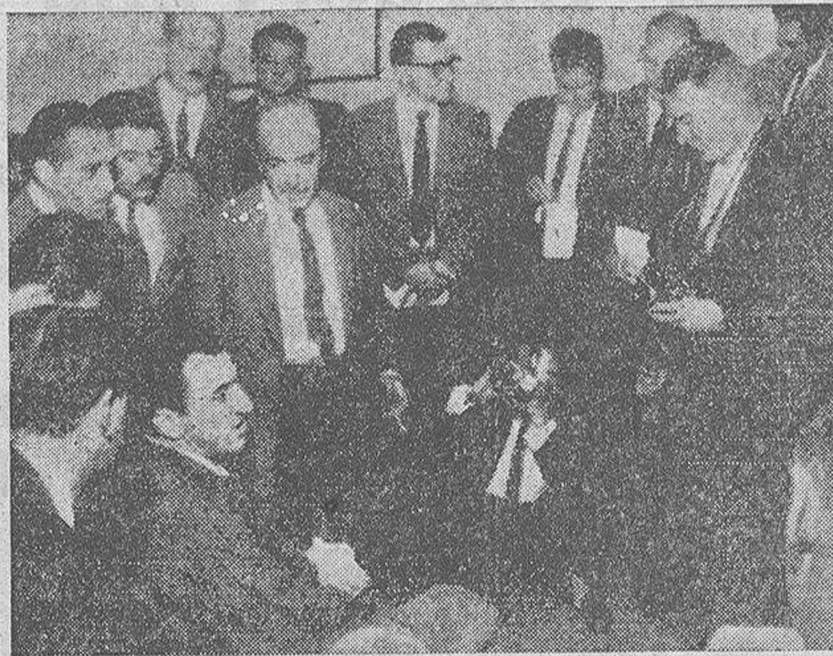
Caryl Chessman, el hombre que se ha hecho famoso desde su celda de condenado a muerte, aparece en la foto durante la conferencia que concedió últimamente a los representantes de la Prensa, al enterarse de que su ejecución había sido aplazada de nuevo.

El recluso Caryl Chessman es un nombre de actualidad mundial. Un personaje que acapara la atención de las gentes y de la Prensa. ¿Morirá Caryl Chessman en la cámara de gas? He aquí la incógnita que apasiona. El pasado día 5 fue ejecutado en la horca, en Londres, el fotógrafo inglés Guenther Fritz Podola, al serle denegado el indulto que sus defensores habían solicitado. Recientemente proyectada en el Rosalia la película "¡Quiero vivir!", en la que se relata la triste historia de Bárbara Graham, que murió gaseada en los Estados Unidos hace seis años. Esta película impresionó vivamente y fue muy comentada en todas partes, y, naturalmente, en La Coruña.