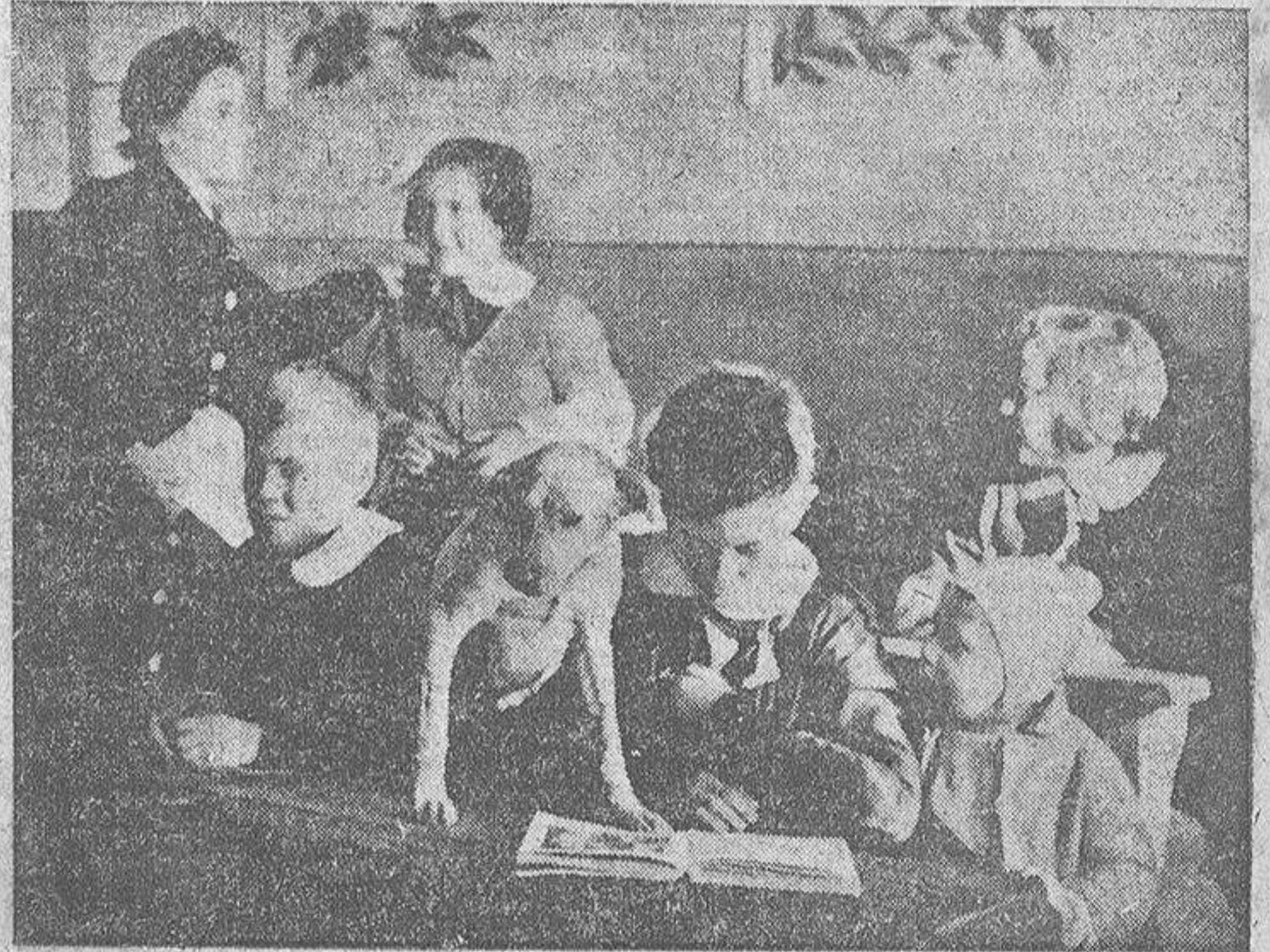
Estos niños de una ciudad de la Lombardía italiana, habían rescatado un perro vulgar de un amo que lo maltrataba. El perro, agradecido, les seguía siempre y se quedaba a la puerta de la escuela. Llegó el mal tiempo, y los niños pidieron a la maestra que dejara entrar al perro "para que no pasara frío". La maestra tuvo que ceder porque sino no entrarían ellos en clase. Ahí están todostan contentos.