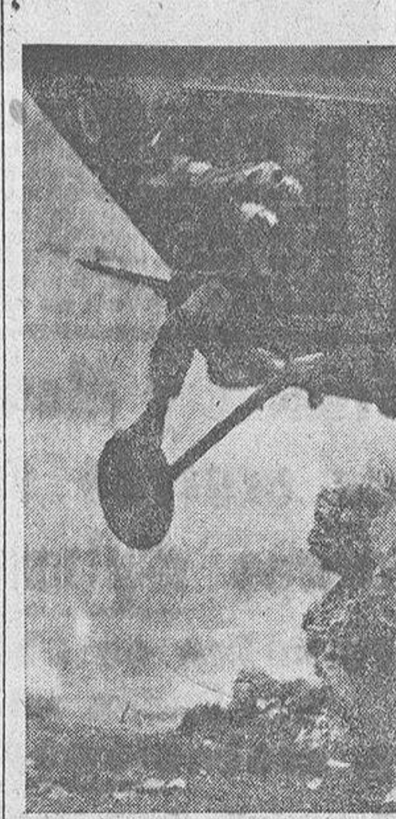
Para acudir rápidamente a los lugares donde se registran agresiones, las tropas francesas emplean helicópteros que ni siquiera toman tierra...