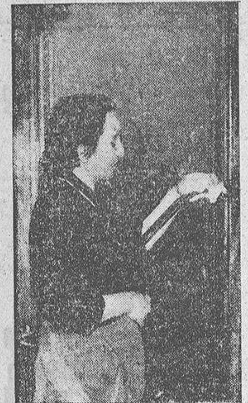
"Limpia, fija y da esplendor" en la portería, mientras concibe sus versos.

He aquí un nuevo deporte que acaba de nacer en Norteamérica y que pronto se extenderá por todas partes: el vuelo en helicóptero sin motor. La construcción del aparato es sencilla. Tiene un rotor que, al ser remolcado por una furgoneta o por una moto, gira y se eleva como un autogiro, pues está fundado en el principio que inventó el ingeniero español La Cierva. El piloto hace lo demás, y, cuando quiere, se desprende del remolque. Al descender, el rotor hace de paracaídas. Sirve para practicar el vuelo a vela y cuesta 120 dólares.