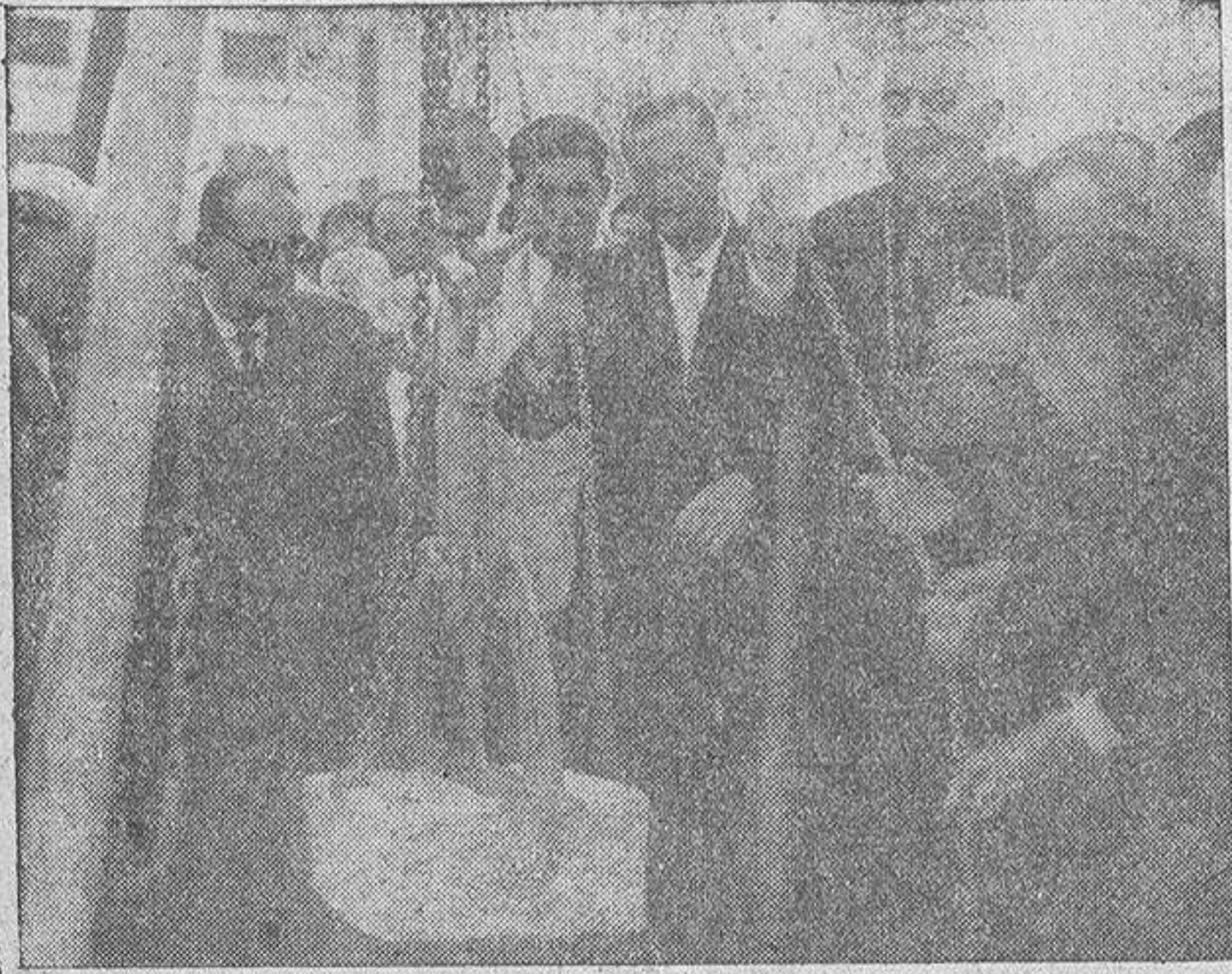
El Cardenal Quiroga Palacios bendice la primera piedra del nuevo Refugio del Patronato de Caridad

En un sencillo y emotivo acto fue colocada ayer por la mañana la primera piedra del nuevo Refugio de la Caridad, sito en lugar próximo al actual, frente al moderno edificio del Hogar "Calvo Sotelo", en el populoso barrio mariner de San Pedro de Visma.