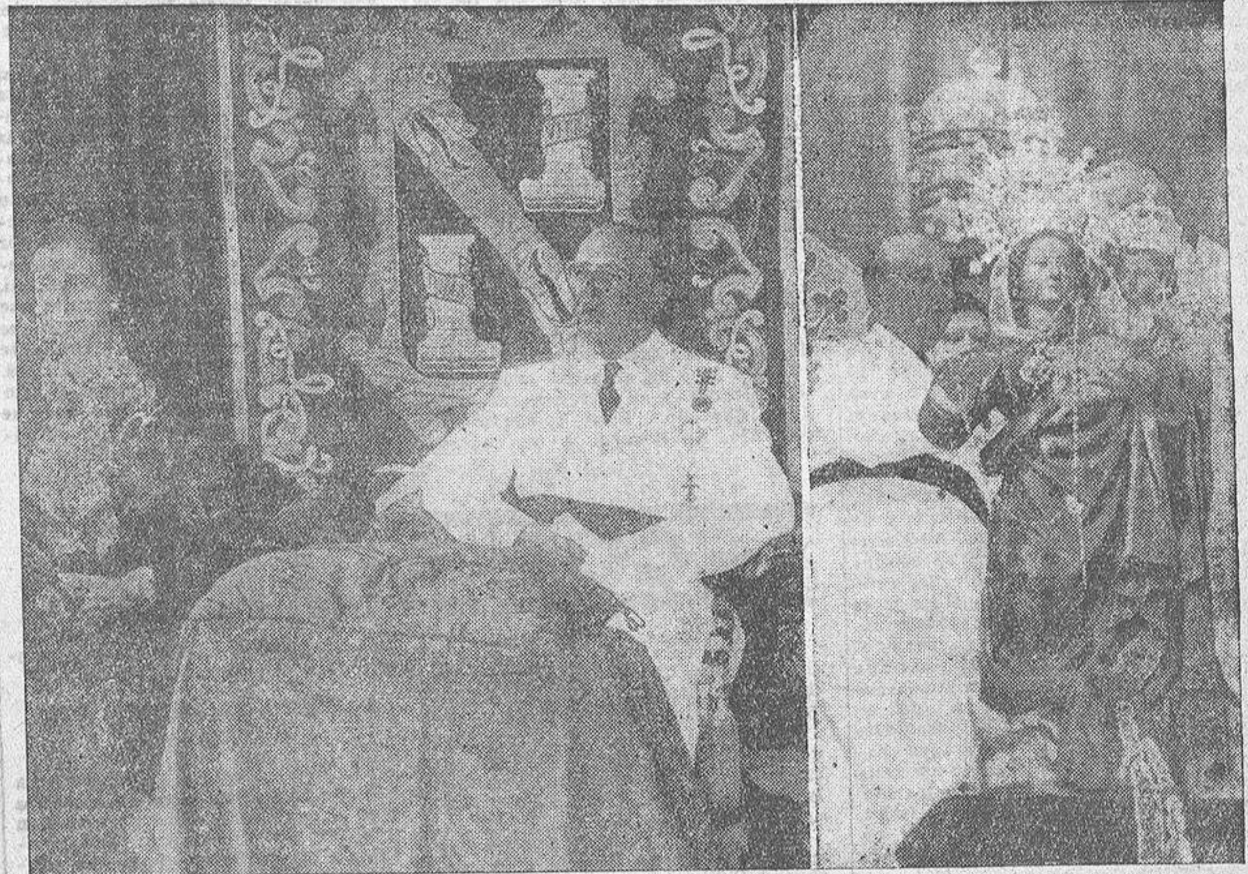
Recogemos aquí dos aspectos gráficos de la brillante ceremonia celebrada ayer en La Coruña. A la izquierda, el Caudillo y su esposa durante el acto; a la derecha, el Jefe del Estado impone a la imagen de la Virgen la Medalla de Oro de la ciudad

La Coruña vivió ayer, pues, una gran jornada de exaltación mariana y patriótica. Si la presencia de Franco sirvió para comprobar, una vez más, la completa identificación del pueblo con su Caudillo, la coronación de la Virgen del Rosario constituye uno de los mejores homenajes que podían rendírsele a la Reina del Cielo y Señora nuestra.