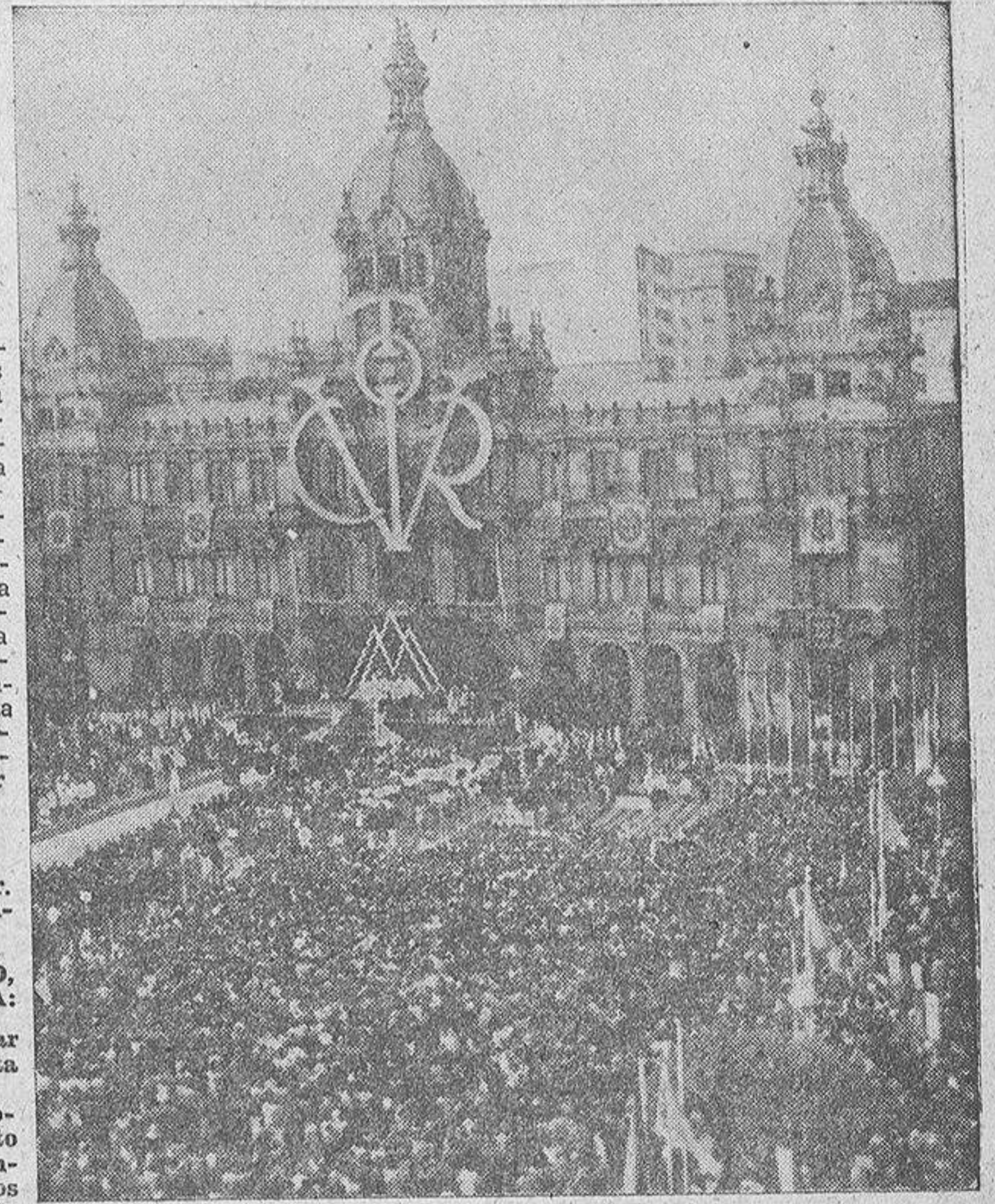
Perspectiva de la Plaza de María Pita momentos antes de empezar la ceremonia de coronación de Nuestra Señora del Rosario

Y ahora, este acto de la coronación, en el que hemos querido resumir cuanto sentimos con relación a Ti; este acto de la coronación, al que ha querido asociarse de una manera inmediata y directa el Vicario de Cristo, --que conoce y aprecia nuestra tierra a la que visitó como peregrino al sepulcro del Apóstol Santiago--, regalándonos con su palabra de Maestro y de Padre y con la delicadeza exquisita de enviar un rosario bendecido por él, para que luzca en Tus manos; este acto de la coronación, al que piadosamente asiste, acompañado de su egregia esposa, Su Excelencia el Jefe del Estado Español, el Caudillo de España, honra de esta provincia que meció su cuna y fiel devoto tuyo, que desde el primer momento mostró su júbilo por cuanto proyectáramos y cuyo corazón no le permitió estar ausente en las horas de tu exaltación; este acto de la Coronación, en el que se han dado cita ilustres Prelados