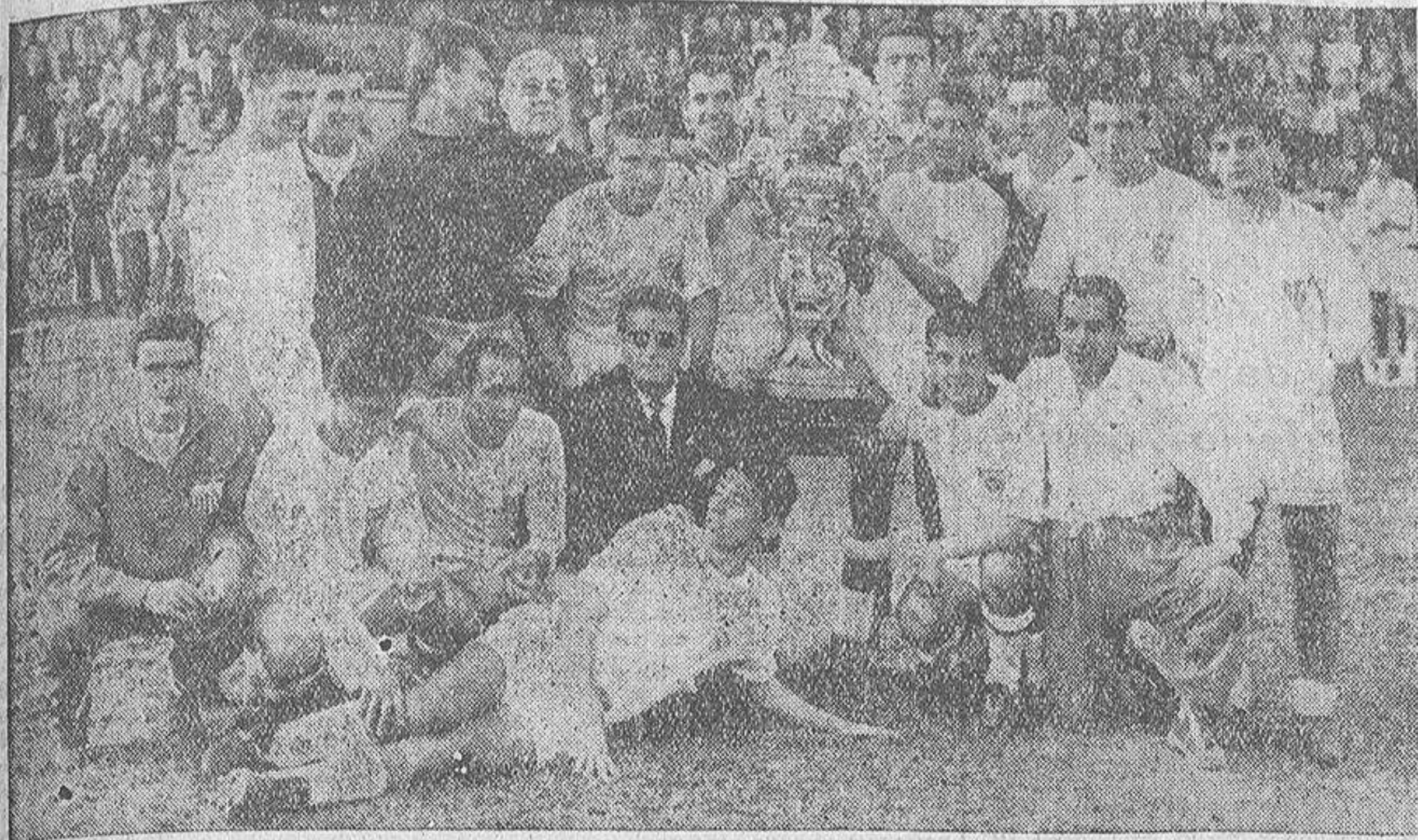
Jubilosos y llenos de orgullo, los jugadores del Sevilla, con su entrenador y directivos, se agrupan, después de concluir el encuentro y antes de dar la vuelta de honor al campo, en torno del magno trofeo, que el club de la capital andaluza ha conquistado por tercera vez. Anteriormente lo habían ganado al Atlético de Bilbao y al Helsingborgs, de Suecia