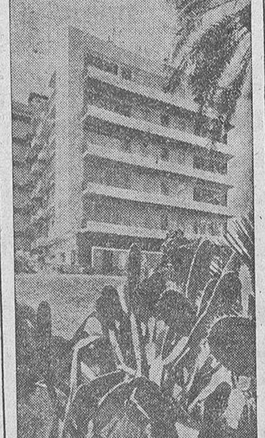
Este es el hotel Excelsior, de Beirut, que, junto al también espléndido hotel Palm Beach, otro "palace" situado frente al mar, con piscina privada, albergará a las representantes de los 17 países europeos que disputarán, en el Gran Casino del Líbano, el título continental de belleza.

—Como la belleza se presupone, puesto que ha sido proclamada Guapa, tal mujer no debe carecer de figura, distinción y talento. Me parece que esto sería suficiente para acreditar un título y defenderlo dignamente.