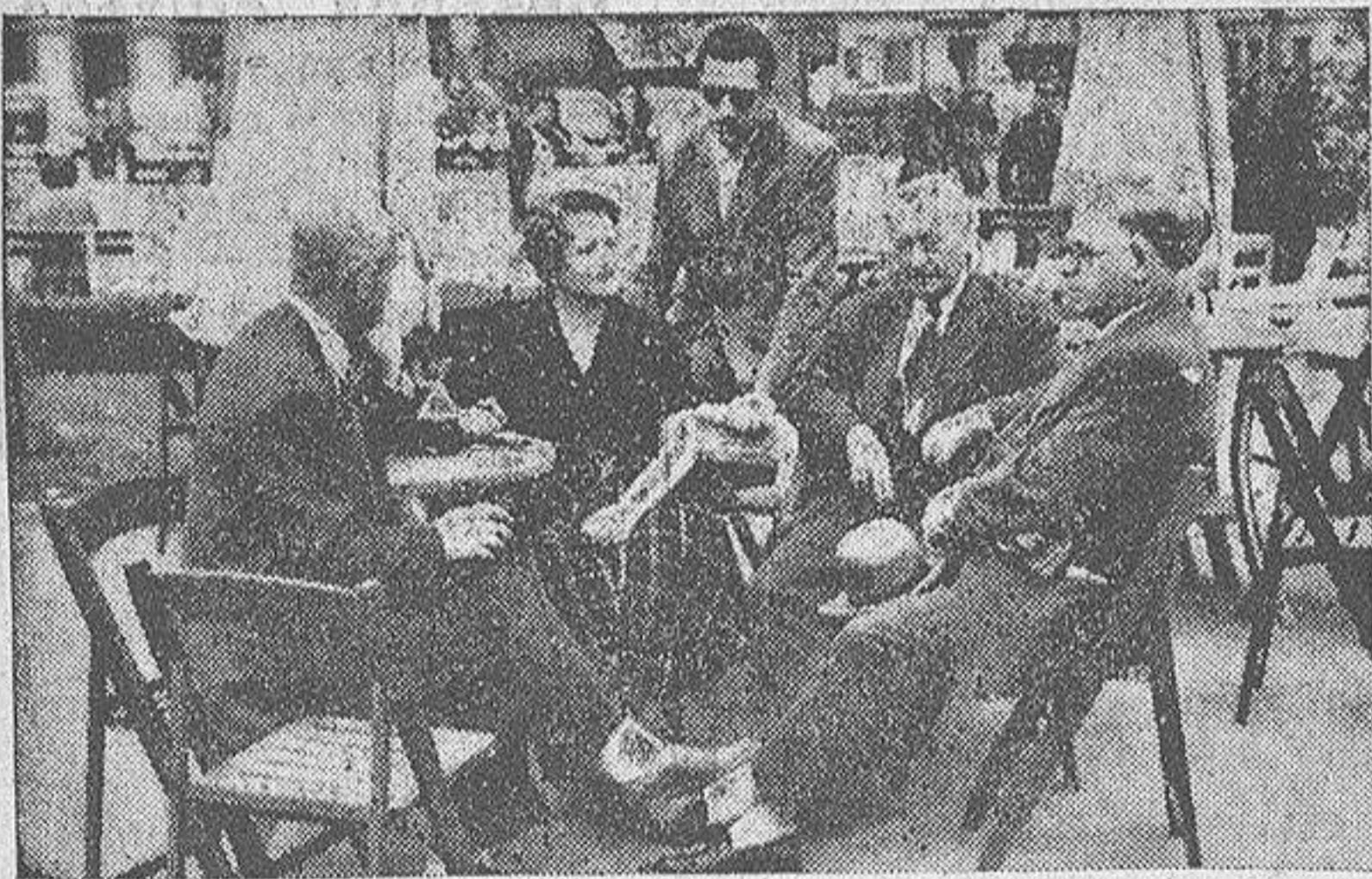
Los redactores gráficos relatan a la autora del reportaje curiosas particularidades de su profesión