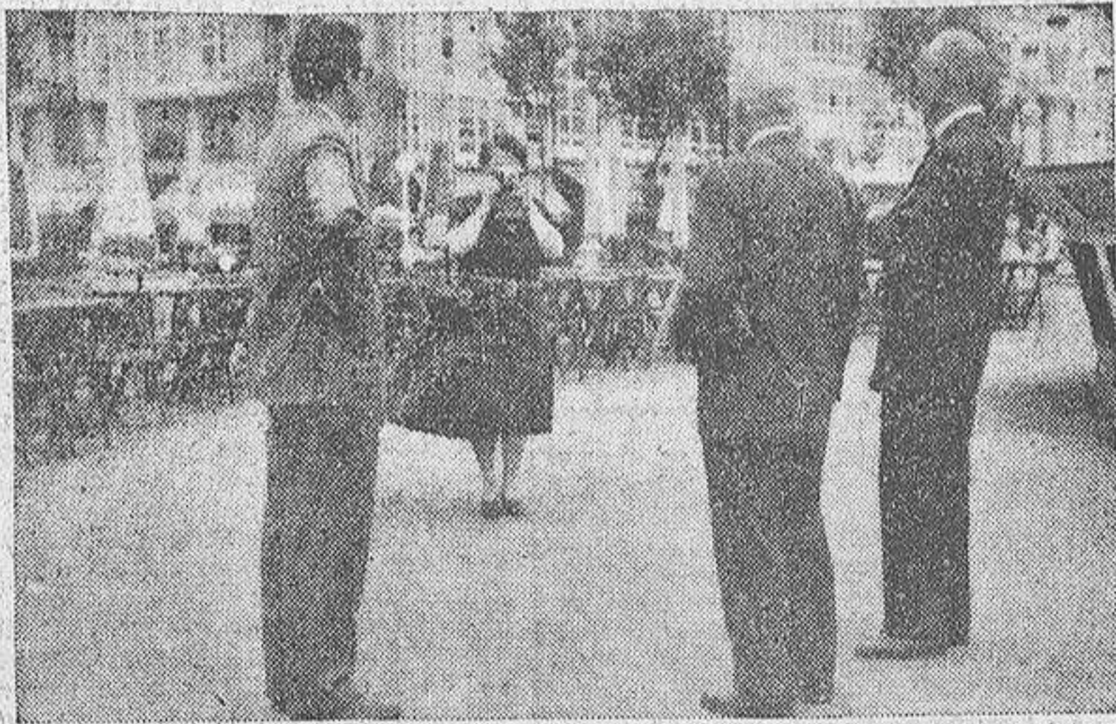
Los fotógrafos, fotografiados por la autora de este reportaje

—¡Figúrese! Tantos que no es posible hacer un cálculo ni siquiera aproximado, pues no son tan sólo las fotos que se publican sino otras muchas que no ven la luz. —¿Qué cantidad de recuerdos! —Múltiples, por lo que también es difícil espigar en ellos. —¿Qué personajes célebres retrató?