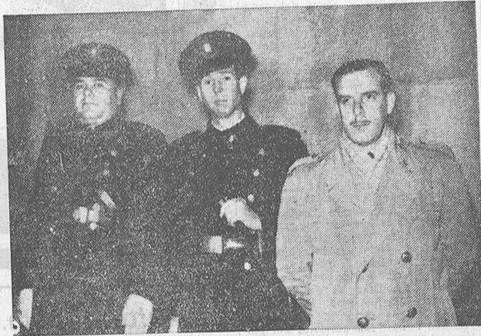
Tres guardias actores en tres intrascendentes sucesos. Ellos forman parte del transcurrir de la vida ciudadana, alterada de cuando en vez, y pronto, nuevamente, en calma

—Se le extienden unos recibos. Mira con gesto huraño, paga y se va malhumorado, rechistando por bajo.