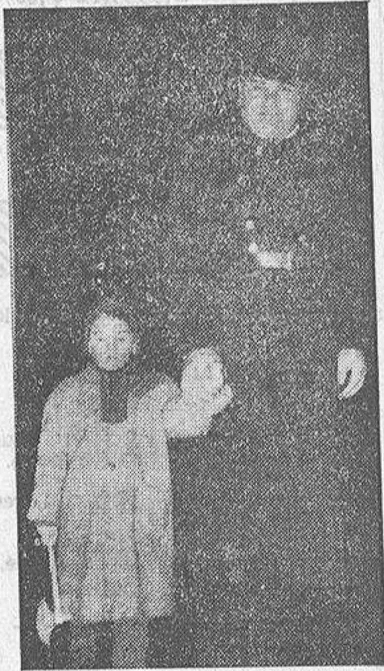
Contraste entre la corpulencia del guardia y la infantil ingenuidad del niño perdido. Sin embargo, el primero suaviza sus maneras para alegrar al segundo, que muy pronto estará de nuevo con sus deudos, gracias al eficaz servicio.

—"El Chiquillín", es un tullido madrileño que afirma que La Coruña es una ciudad maravillosa. Toda su vi-