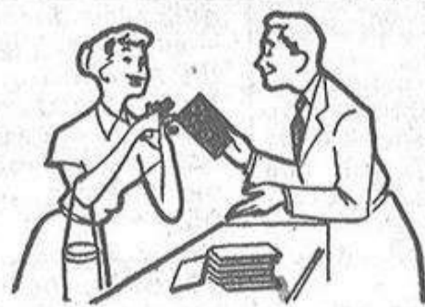
Compre siempre Chocolates NESTLÉ.