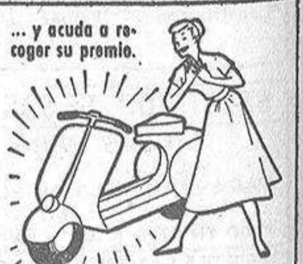
... y acuda a recoger su premio.