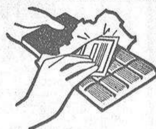
Vea el interior del envoltorio.