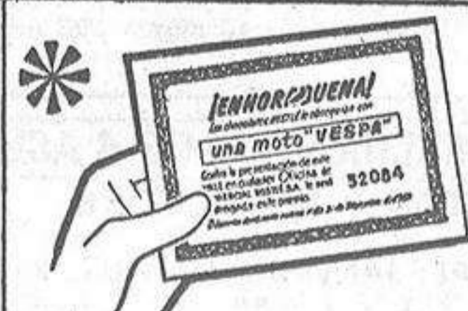
Compruebe si contiene un «Vale Premiado».