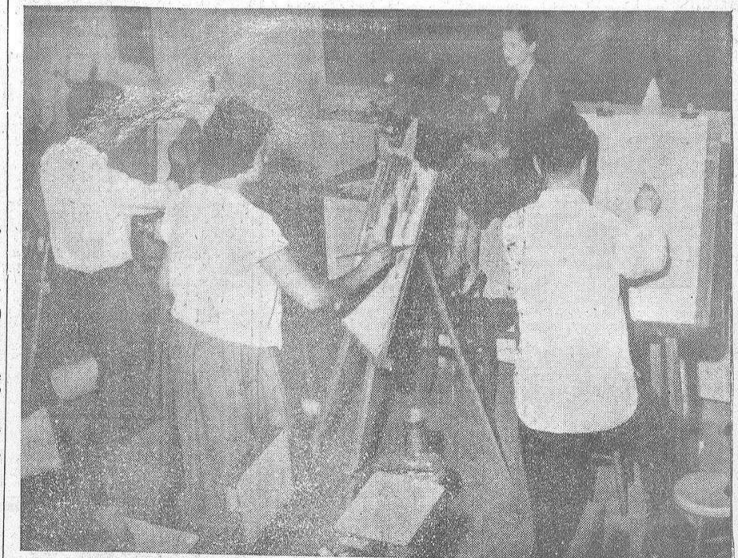
Los estudiantes de la Sección de Arte de la Universidad Americana en Beirut, se vieron sorprendidos por la noticia de que la esposa del Presidente de la República, Madame Chamoun, iba a posar para ellos. Durante una hora la primera dama del Líbano se prestó complacida a servir de modelo a los jóvenes artistas.