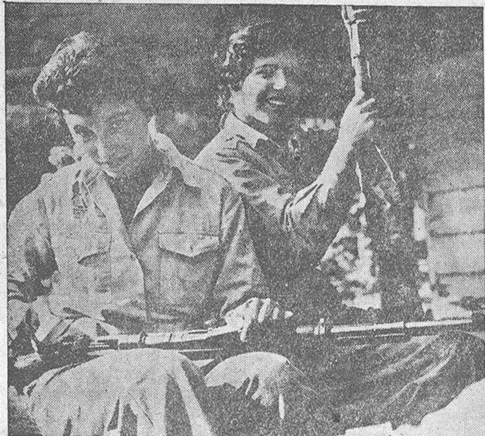
El ejército de Israel no se compone sólo de soldados varones. También las judías se batan en primera línea. He aquí dos ejemplares mortíferos de tal clase de milites. Porque una mirada de esta "soldada" bastaría para aniquilar un batallón, ¿verdad?...

IZMIR, (Turquía), 3.—Un barco de pasajeros turco chocó hoy, a las nueve horas de la mañana, con un barco de carga norteamericano y como consecuencia del choque el barco turco se hundió en el mar. Una persona resultó muerta y dos desaparecidas. El choque entre el buque turco de seis mil toneladas "Izmir" y el carguero norteamericano de ocho mil toneladas "Howel Likes" se produjo cuando el navío turco volvía a la punta de Yenikale, en este puerto. Como consecuencia de la colisión se abrió en el casco del buque turco un agujero de unos seis metros y medio, lo que produjo su hundimiento casi inmediato. Todos los pasajeros excepto los tres antes mencionados, consiguieron salvarse. El "Izmir" navegaba a una velocidad de dieciséis millas por hora cuando se produjo el choque.—(EFE).