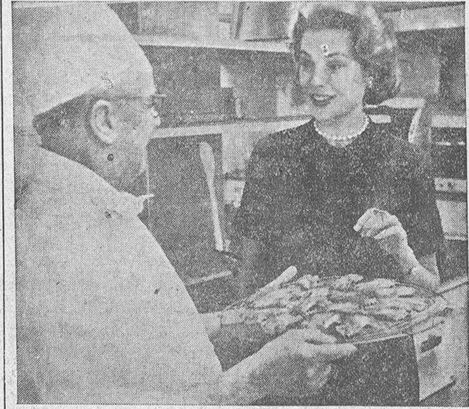
Pocos días después de haber venido al mundo la heredera del trono de Mónaco, la Princesa Gracia volvió a recorrer su palacio. En la cocina se vio agradablemente sorprendida por esta delicadeza del cocinero mayor: le había preparado una bandeja de sus pastillitos preferidos. Y la princesa los comió allí mismo con el natural apetito.

Los pasteles preferidos por la Princesa Gracia