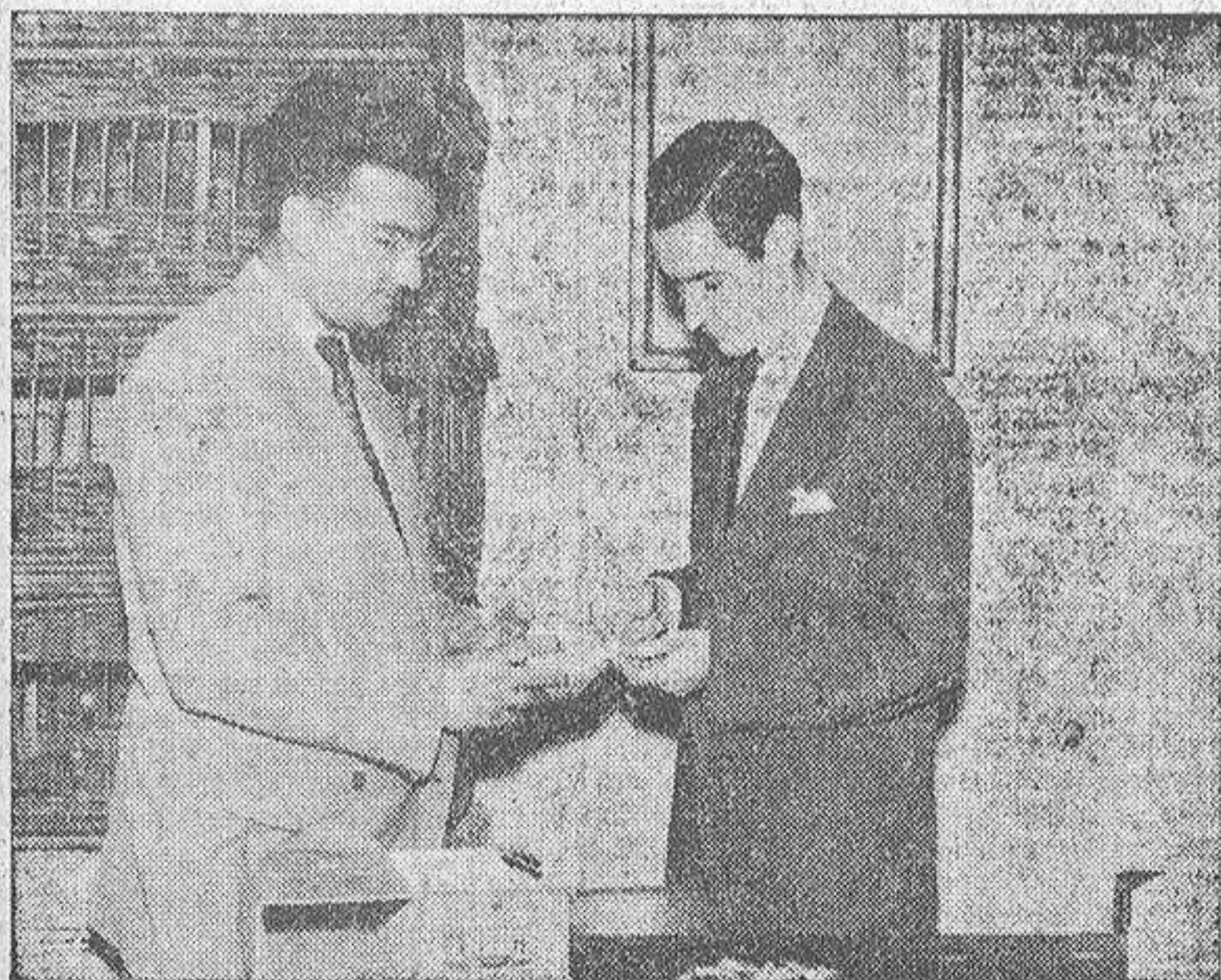
La difícil y complicada tarea del anillado, es explicada a nuestro colaborador por el presidente de la Sociedad Colombófila Coruñesa