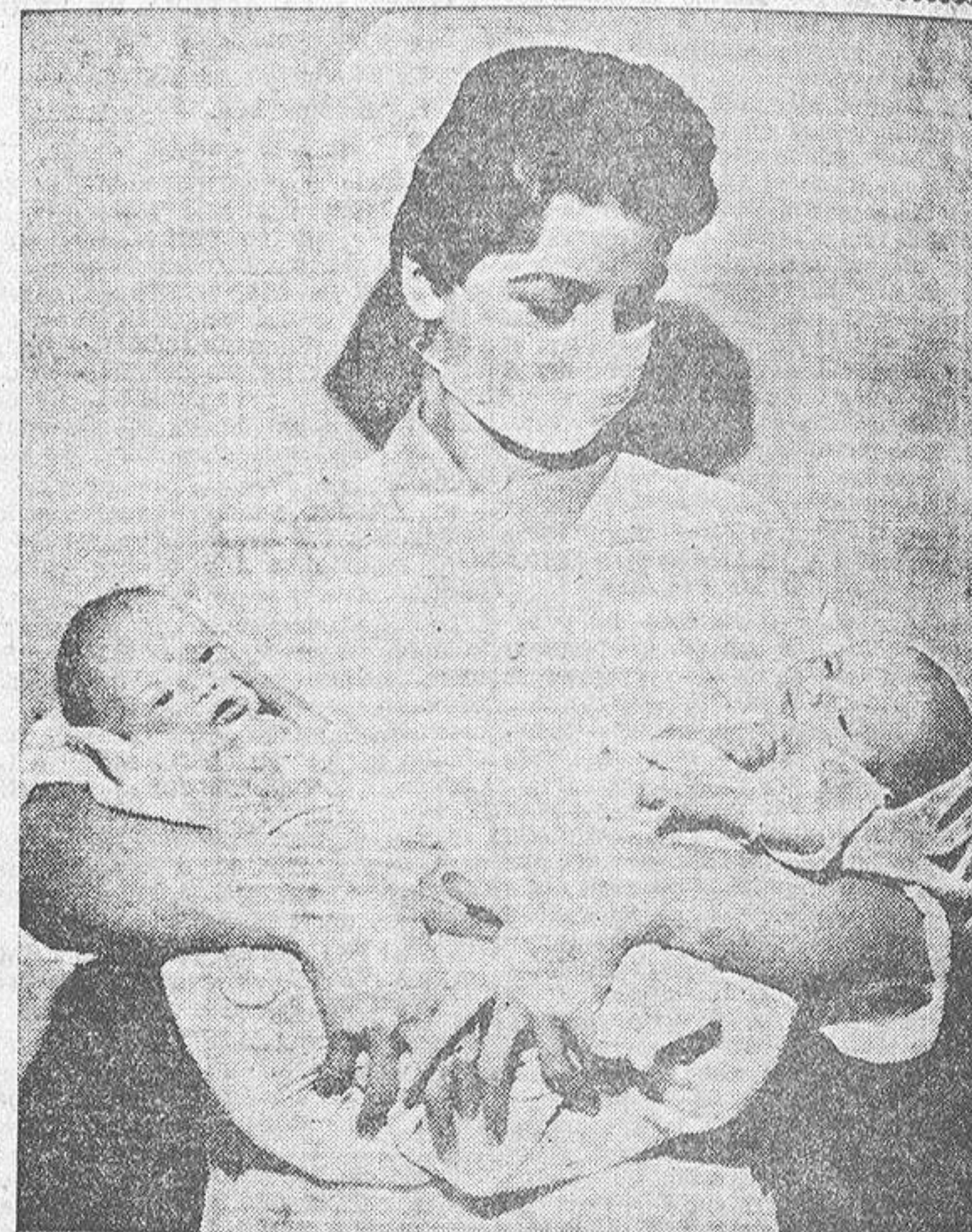
Estas dos gemelitas, nacidas en Glaspott (EE. UU.) hace tres semanas, vinieron al mundo con una grave enfermedad que hizo necesarias varias transfusiones. Las niñas se encuentran ya bien, pero por tres veces, les fué extraída su sangre y sustituida con sangre ajena.