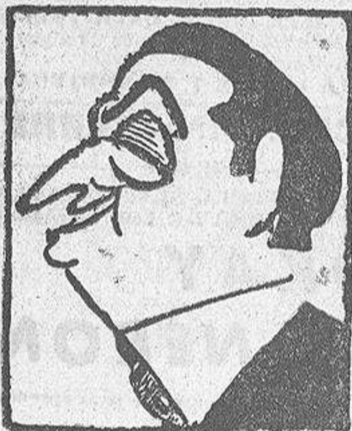
JOAQUIN CALVO SOTELO

Sólo unas horas precede este repor- taje a la llegada de Joaquín Calvo Sotelo a La Coruña. Y poco más de un día ha transcurrido desde que habló en Madrid con el autor de "La Muralla". Le he ganado en la llega- da porque me anticipé en la salida. Es un método que no suele fallar.