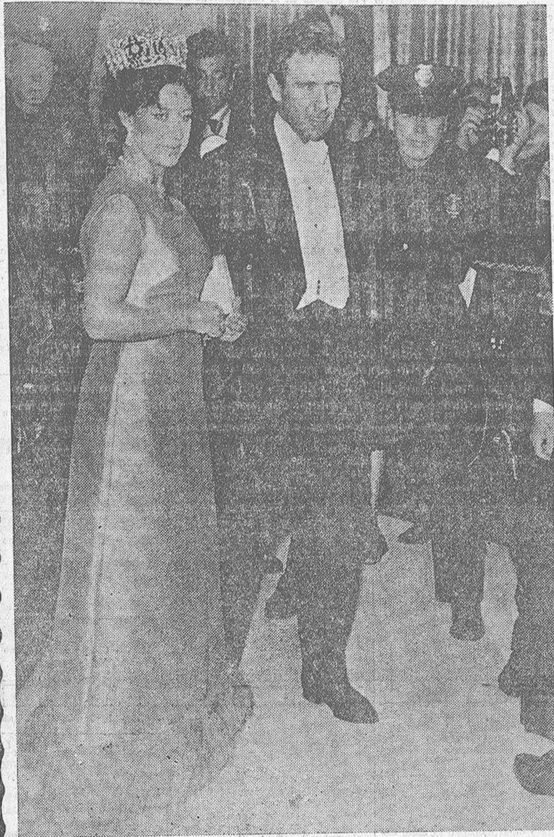
Margarita de Inglaterra y su esposo, Lord Snowdon, se encuentran de visita a los Estados Unidos. Durante su estancia en Hollywood, fueron objeto de diversos agasajos. Después de asistir a numerosas recepciones, fueron los principales invitados en un gran baile de caridad a beneficio de la infancia desheredada. Bob Hope y Frank Sinatra—uno de los actores favoritos de la Princesa—les hicieron los honores. Margarita fue la verdadera reina de la fiesta, a pesar de que en el salón se encontraban las más ajetadas intérpretes de la cinematografía norteamericana.

Athenagoras hará lo mismo con la que pesaba sobre el Papa León IX EN UNA ACCION PARA CERRAR LA BRECHA ENTRE LAS DOS IGLESIAS