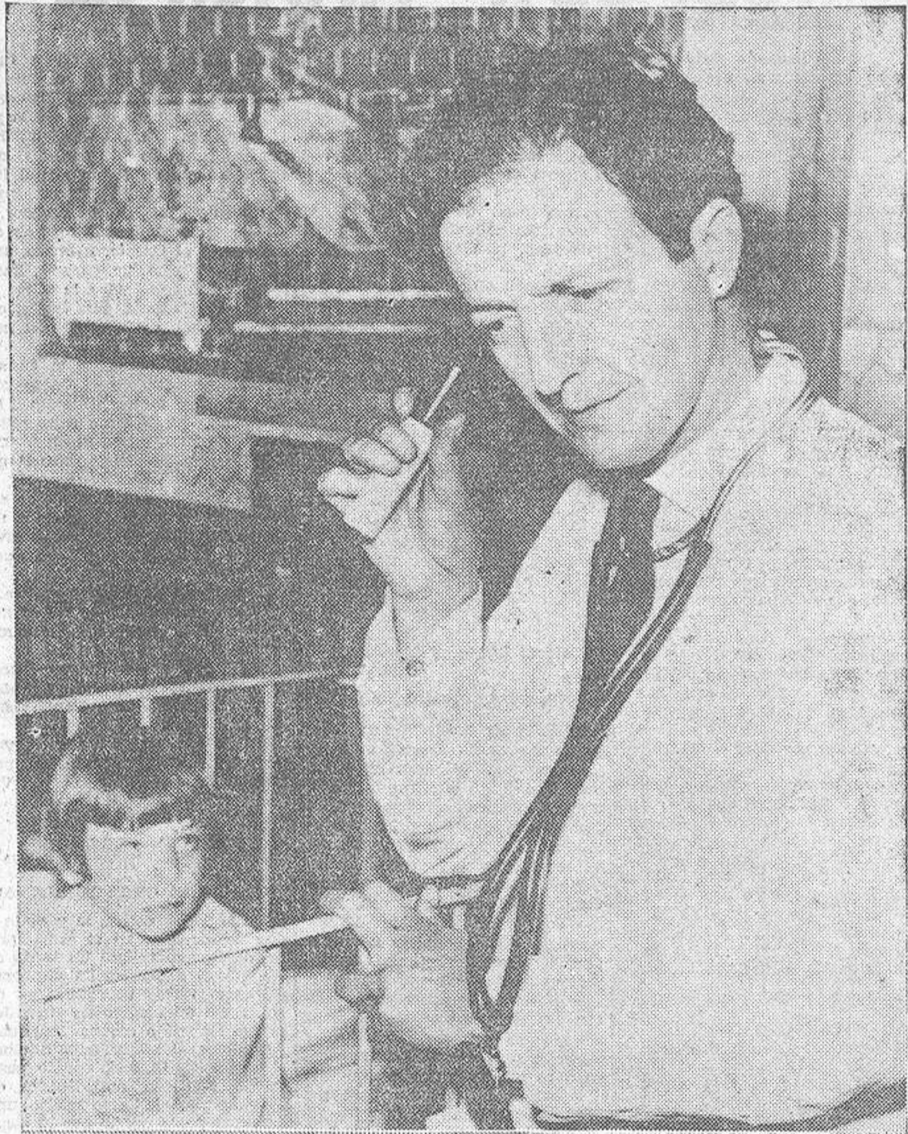
He aquí un nuevo sistema que se utiliza en una clínica de Londres, para transmitir comunicaciones a distancia a los médicos que realizan la consulta.

"Ola casi a diario a gente quejarse de dolores —decía a señora J. a los periodistas en su casa de Boston—, pero siempre pensé que se trataba de personas que no estaban contentas por algo o alguien."