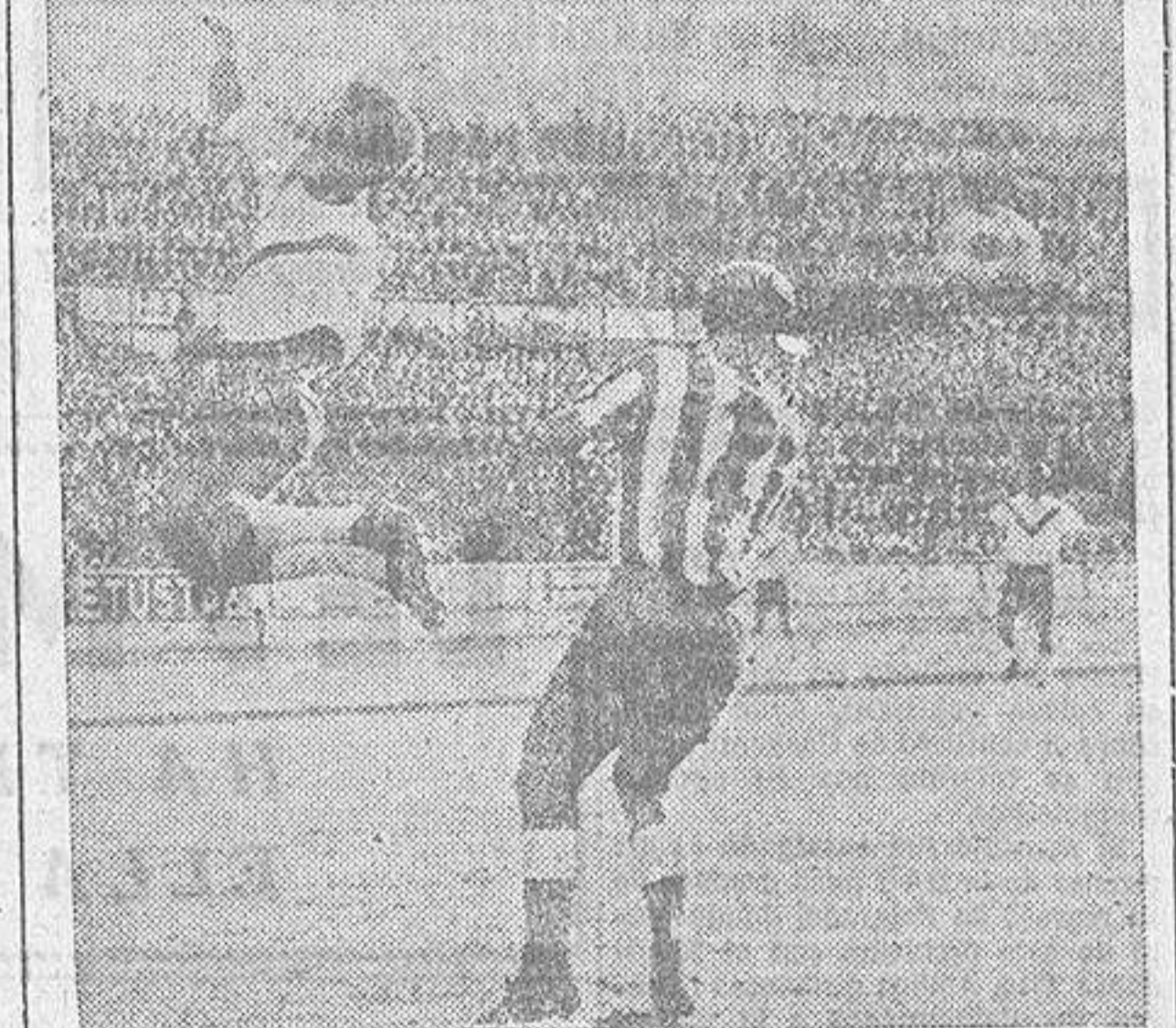
Un delantero catalán salta espectacularmente para hacerse con el balón, acusado por el deportivista Aure.

hada pero tampoco parece destinada a sufrir demasiadas inquietudes. Sabe moverse en el campo con rapidez y soltura y tiene gente eficaz y valiosa. Así, Sastre, que, manobrando en el centro del terreno dirigió con cierto los movimientos