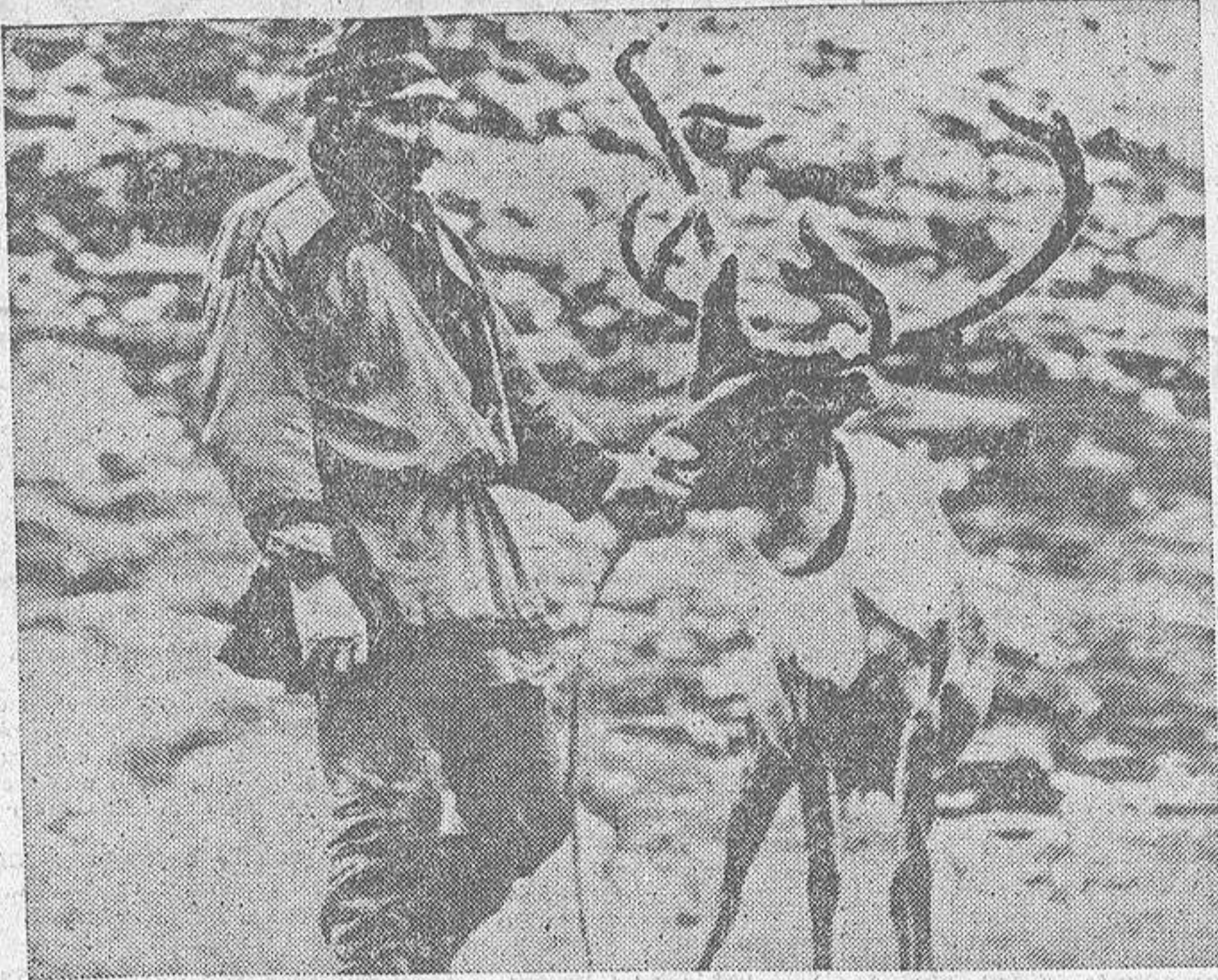
La vida del lapón es inseparable de la del reno.

cueros para fabricar tiendas, calzados y cinturones. Con las pieles se vistén, y los intestinos y tendones les proporcionan cuerdas para sus arcos y hilo para coger. Por último, las astas y la osamenta se prestan a diferentes usos; algunos de ellos muy artísticos. Los famosos "bastones de mando", que se ignoró durante mucho tiempo para qué servían, se tallan de la cornamenta aprovechando el hueso interno. En realidad no eran tales "bastones de mando", sino útiles destinados a enderezar los trozos de asta que habían de servir como flechas o arpones a los nómadas. De los huesos del reno se hacen anzuelos, puntas de arpones y de flechas, agujas y puñales.