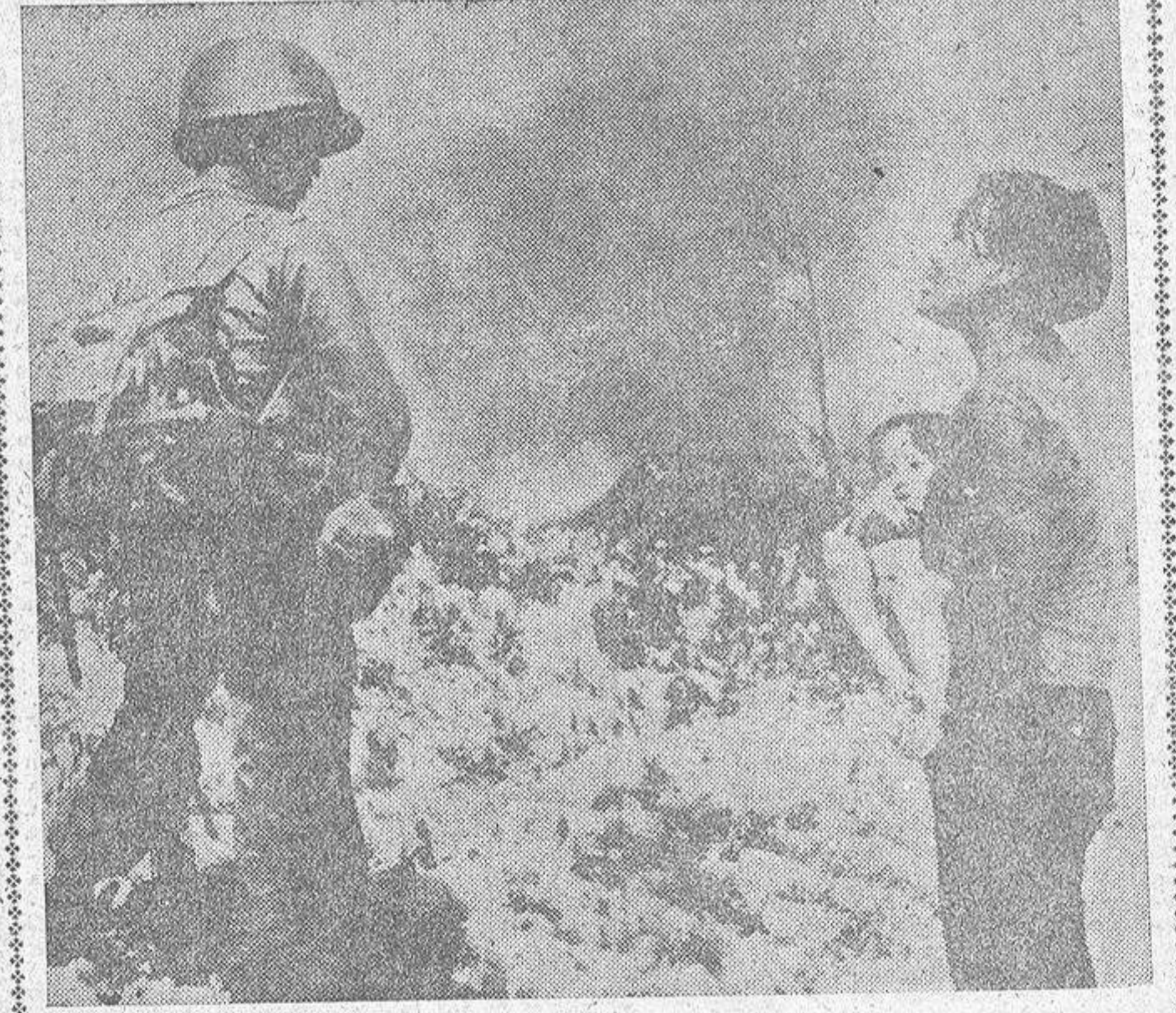
Una mujer vietnamita, implorante y con su hijo en brazos, demanda la ayuda de un soldado. La escena ha sido captada en un poblado situado a trescientas cincuenta millas de Saigón, que fue atacado y destruido por las tropas del 44 Batallón Rangers. Escenas como esta son frecuentes en las localidades objeto de las incursiones de los guerrilleros comunistas, donde se libra una lucha sin cuartel. Los invasores del "Vietcong" son unos treinta mil, dotados de armas ligeras y sin apoyo de la aviación. No obstante, traen a la raya al Ejército de Vietnam que con el apoyo americano y la falta de disciplina y las frecuentes crisis políticas en el país facilitan la tarea de los comunistas, que sabedores de la escasa moral de las tropas sudvietnamitas, cada vez se muestran más audaces en sus incursiones.